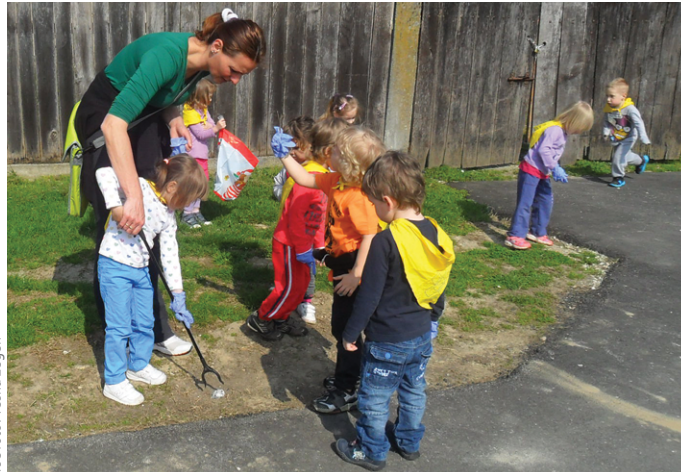
Čiščenje Vrtec Veržej