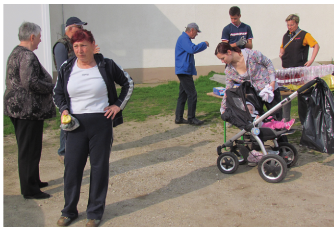
Čiščenje v Veržeju