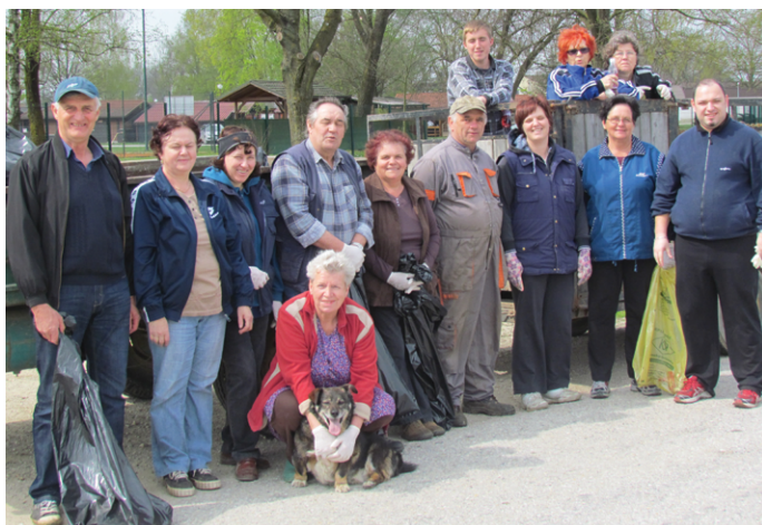
Čiščenje v Banovcih