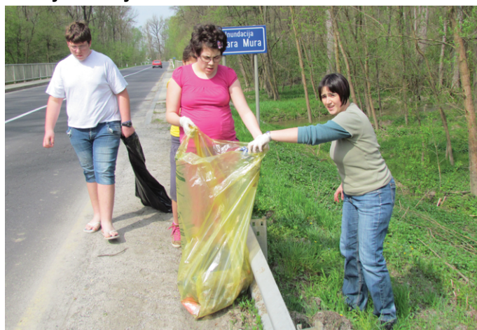
Čiščenje Vzgojni dom