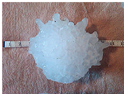
Slika 2: Primer največje toče v zgodovini ZDA, ki je padla v Južni Dakoti, 23. julija, 2010. Premer zrna toče znaša 20 cm (8 inčev), masa pa o.88 kg.

Velikost zrn toče je zelo različna. Najpogosteje so zrna toče v območju premera do 1 cm. Vendar se pojavlja tudi toča s premerom 2 do 3 cm. Pri zelo močnih nevihtah pa je že nastala toča, ki je bila debela kot golobja in kokošja jajca. Ta zrna toče so tehtala od 500 gramov do 1 kilograma. Do sedaj največja zrna toče so padala na Kitajskem leta 1902, ko so izmerili zrno toče s premerom 21 cm in težko 4.5 kg. Tudi pri nas se debela toča pojavi vsakih nekaj let. V Ljubljani je junija leta 2000 padala toča, debela kar 5 cm, lahko je tudi večja.