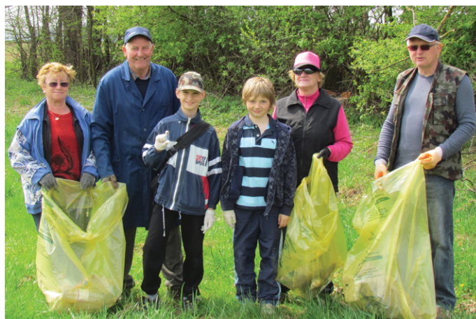
Čiščenje v Veržeju