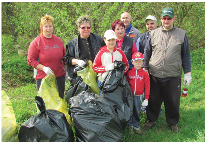
Čiščenje v Bunčanih