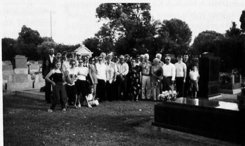
Slovenska srenja po molitvi in blagoslovu grobov na pokopališču v Wodongi v nedeljo, 25. 11. 2001.

† 17. 11. 1929 Črnice na Vipavskem † 26. 10. 2001 Sydney