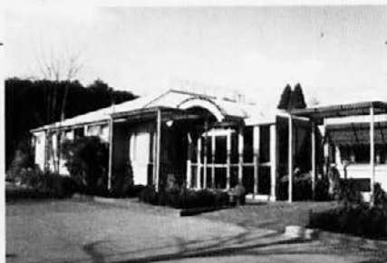
Dom počitka matere Romane Slovenski dom za ostarele 11-15 A'Beckett St, Kew, Vic. 3101