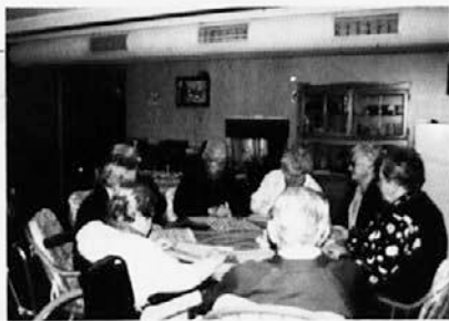
Mother Romana Home Slovenian Hostel for the Aged Ph: 03 9853 1054 Fax: 03 9855 0811

Dom počitka matere Romane je slovenska ustanova, ki za daljši ali krajši čas nudi domače okolje ostarelim in vsem, ki potrebujejo nego. Prijazne in tople sobe, domača hrana, vesela družba, popolna zdravniška nega in vsa oskrba so samo del tega kar boste našli v domu počitka, samo 20 metrov od slovenske cerkve v Kewju.