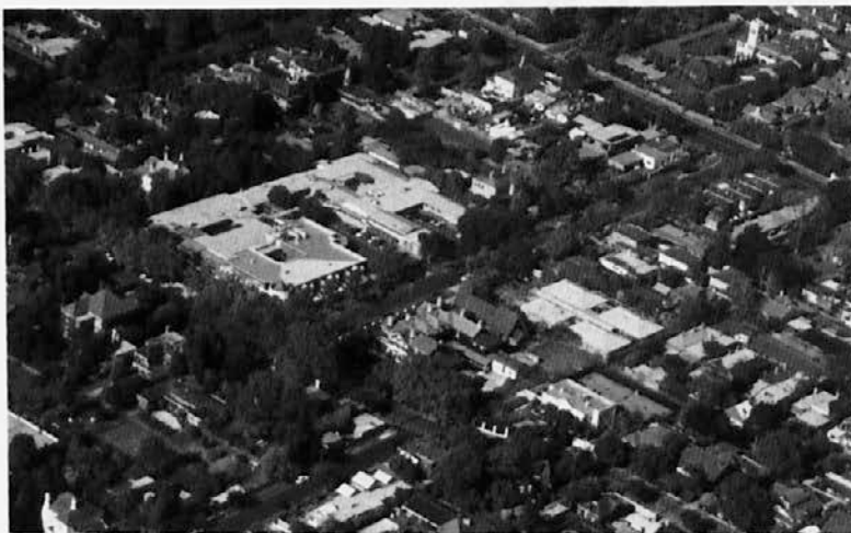
Pogled na Kew kakor ga vidijo ptice