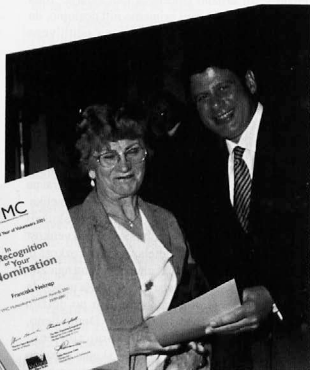
Government House - 25th July 2001

Svetovni slovenski kongres si prizadeva, da bi ustvaril skupni Dom za vse izseljence po svetu, v katerega smo vedno vabljeni in v katerem bomo vedno dobrodošli. V prvi vrsti pa rabi SSK uradne prostore, kjer lahko uspešno deluje. To dela zdaj že deset let in lahko smo ponosni na uspehe. Prostori, kjer ima sedež so na prodajo in če jih kupi kdo drug, bo SSK močno prizadet in mnogi programi, ki jih uspešno oblikuje skupaj s Slovensko Konferenco, bodo zelo okrnjeni. Vlada je prostore ponudila v nakup, zato se je vodstvo odločilo, da vsak član prispeva po 1000 dolarjev, toda takih darov rabimo tisoč. Vsak začetek je težak, vendar, v slogi je moč. Vsak prispevek, ki ga boste namenili SSK Za naš Dom, bo kamen do kamna palača.