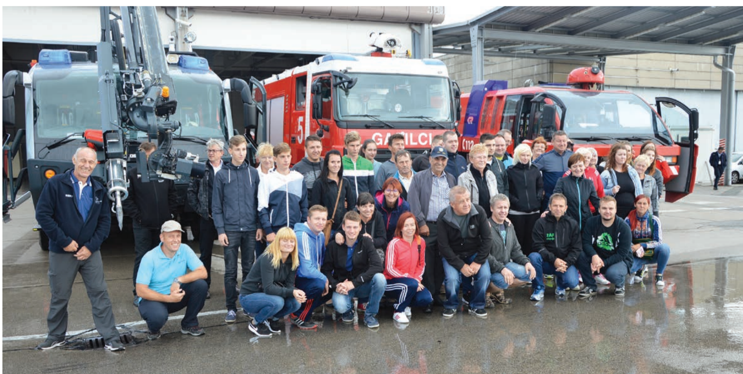
Markovske gasilke in gasilci na letališču Jožeta Pučnika Ljubljana