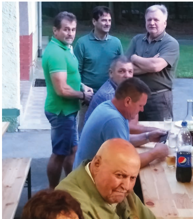
Lovci, ribiči in konjeniki so se srečali v lovskem domu v Sobetincih.