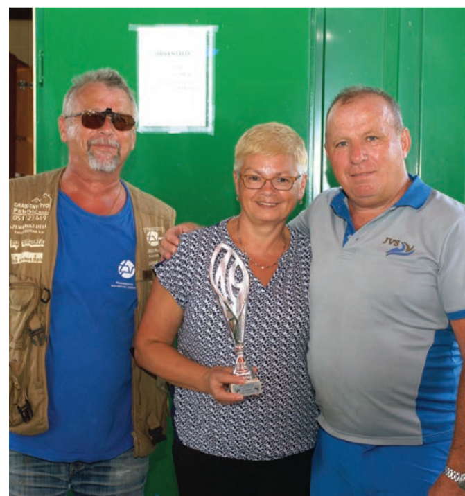
Zmagovalni pari, foto: Srdan Mohorič