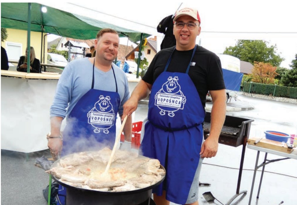
V prijetnem vzdušju smo se poslovili od poletja