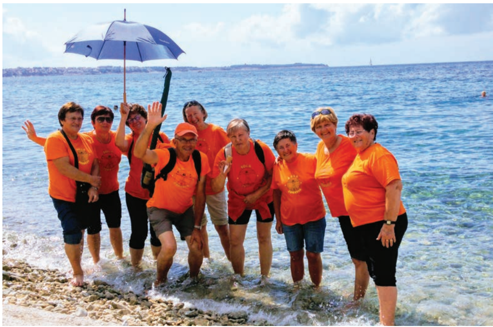
S Triglava v Piran