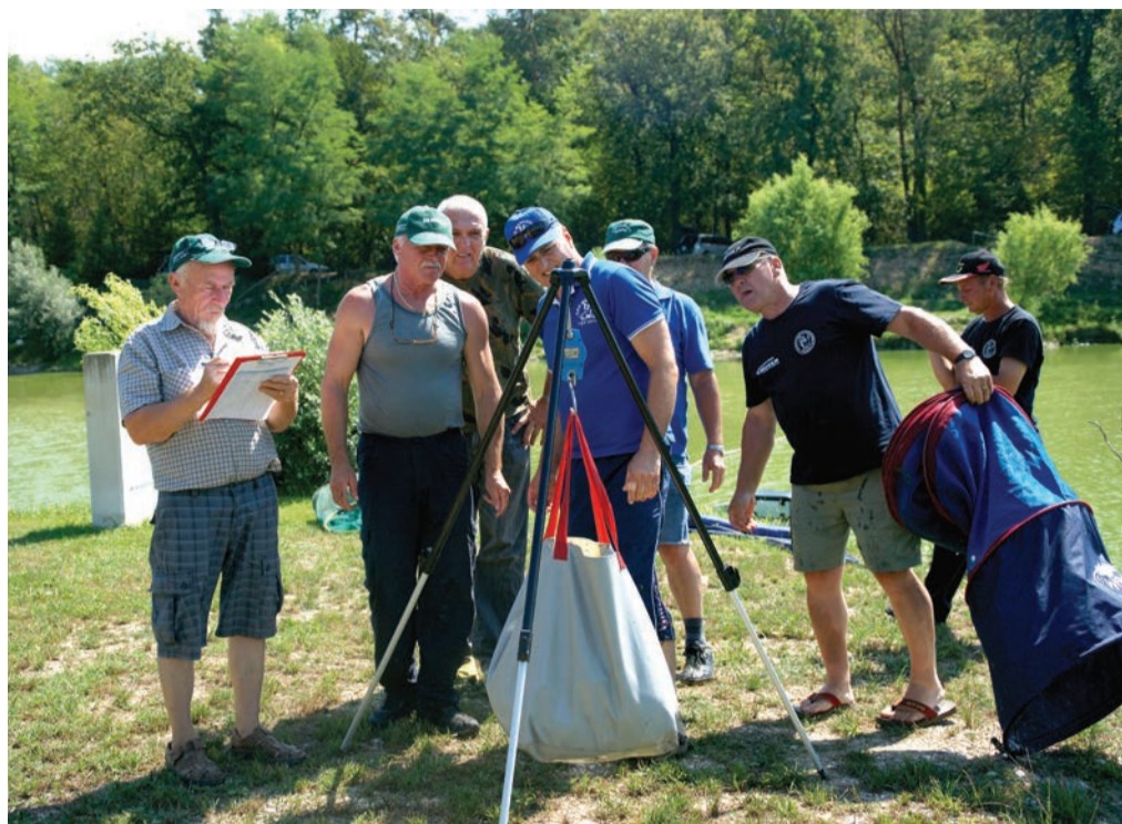
Skupni rezultat je bil neodločen.