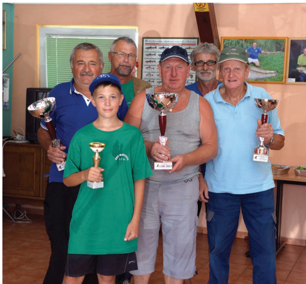
Tekma za ribiškega carja