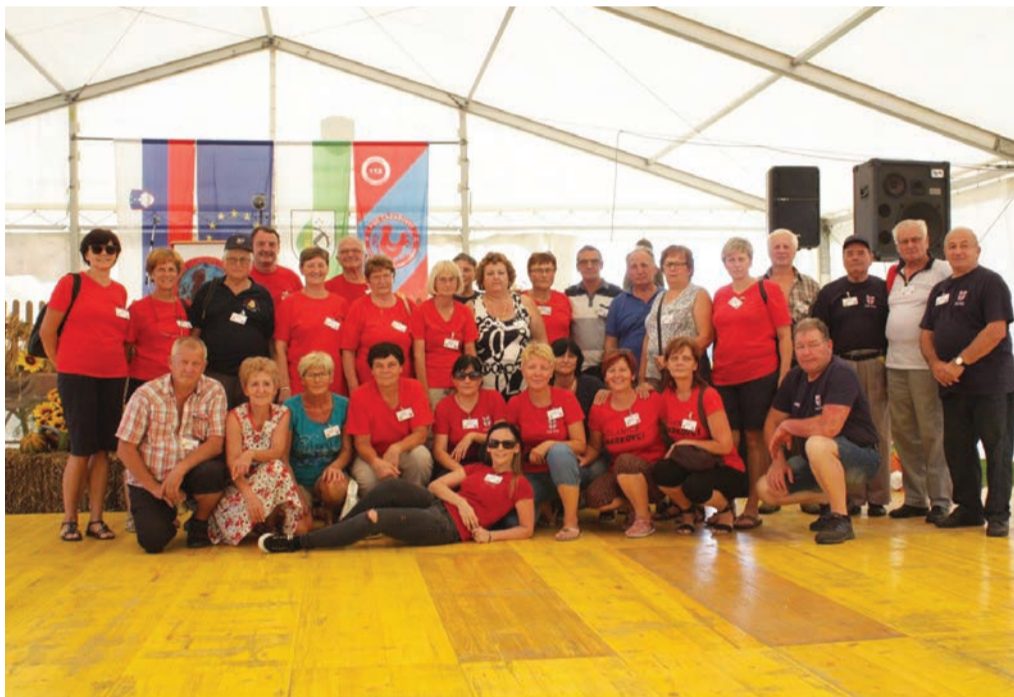
Prostovoljci gasilci OGZ Ptuj na srečanju v Črenšovcih v Prekmurju