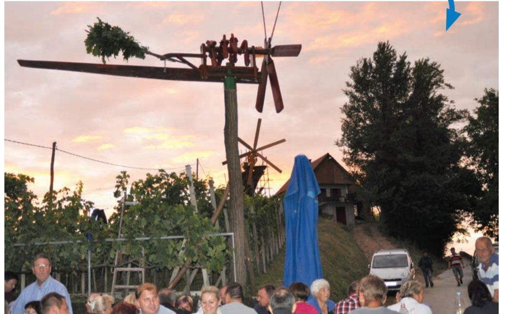
Bukovčani so s pomočjo vaščanov iz Repišč postavili kar dva klopotca; teden dni kasneje še enega.

Prostovoljno gasilsko društvo Bukovci je sredi junija pripravilo tradicionalno, že 34. tekmovanje za pokal vasi Bukovci. V Športnem parku Bukovci se je s pričetkom ob 9. uri pomerilo največ najmlajših gasilk in gasilcev. V kategoriji pionirji so prvo mesto osvojili Bukovci, prav tako v kategoriji pionirk in mladincev. Med pionirkami so drugo mesto osvojile Stojnčanke, v kategoriji članov pa so se prvega mesta razveselili člani PGD Stojnci A, drugi so bili domačini in tretji ponovno Stojnčani. Na tekmovanju sta sodelovali in nas obiskali tudi obe pobrateni društvi iz Hrvaške in Avstrije.