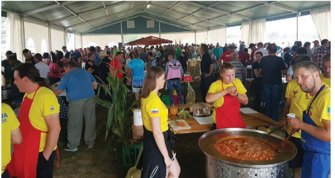
Praznovanje pod šotorom