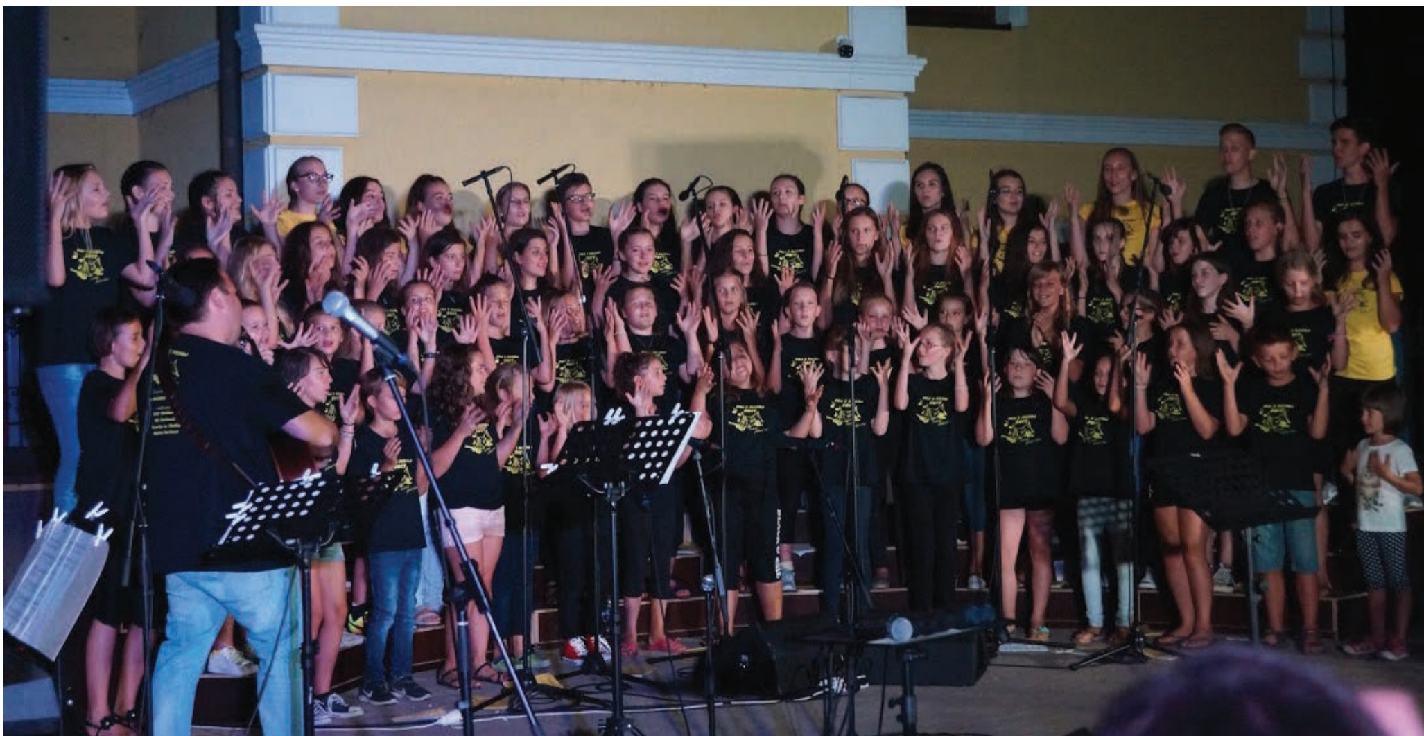
Zbrani taborniki na zaključnem koncertu na župnijskem dvorišču