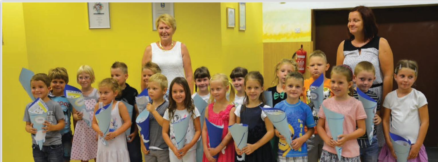
Prvošolčki v spremstvu svojih učiteljic