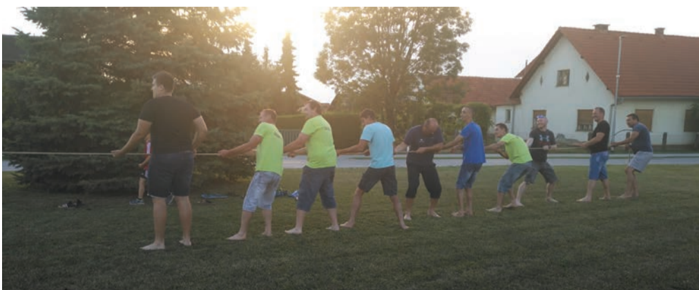
Piknik smo pripravili ob gasilsko-vaškem domu v naši vasi