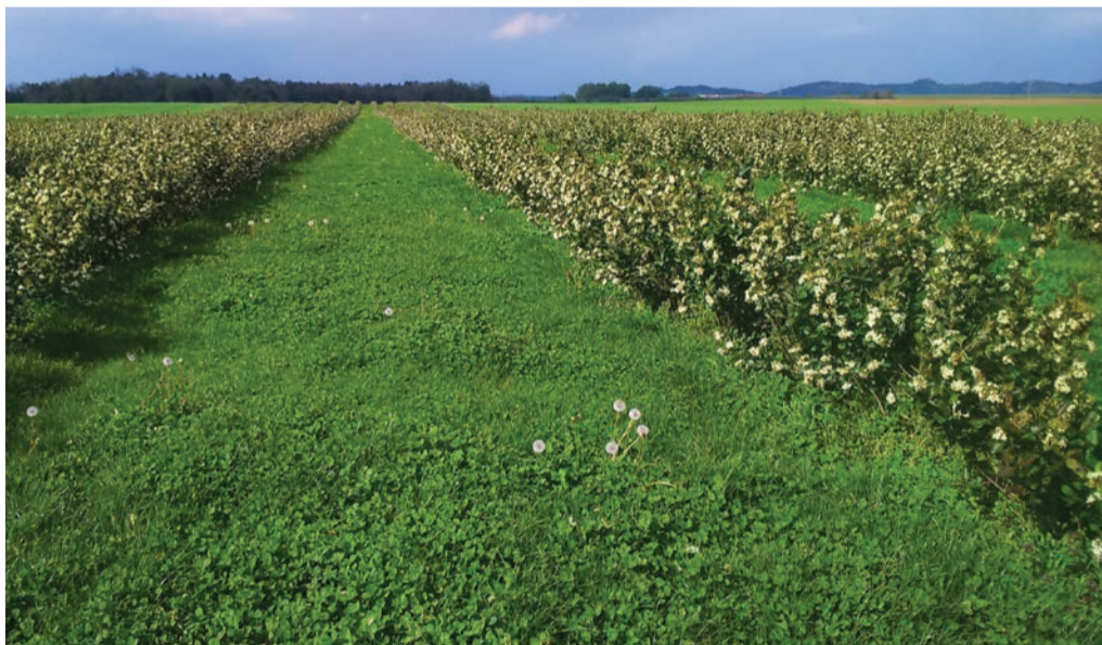
Cvetoči nasad aronije v Stojncih

Primerjava vsebnosti antioksidantov v 100 g različnega jagodičevja: aronija jih vsebuje 2147 mg, gozdne borovnice 705 mg, češnje 170 mg, rdeče zelje 113 mg in jagode le 35 mg ( www.ekosara.si/aronija ).