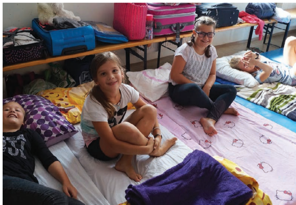
Domovanje mladih tabornikov je za 5 dni bilo v župnijski dvorani in veroučni učilnici.