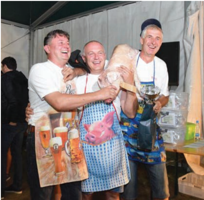
Trije ASI iz Vidma