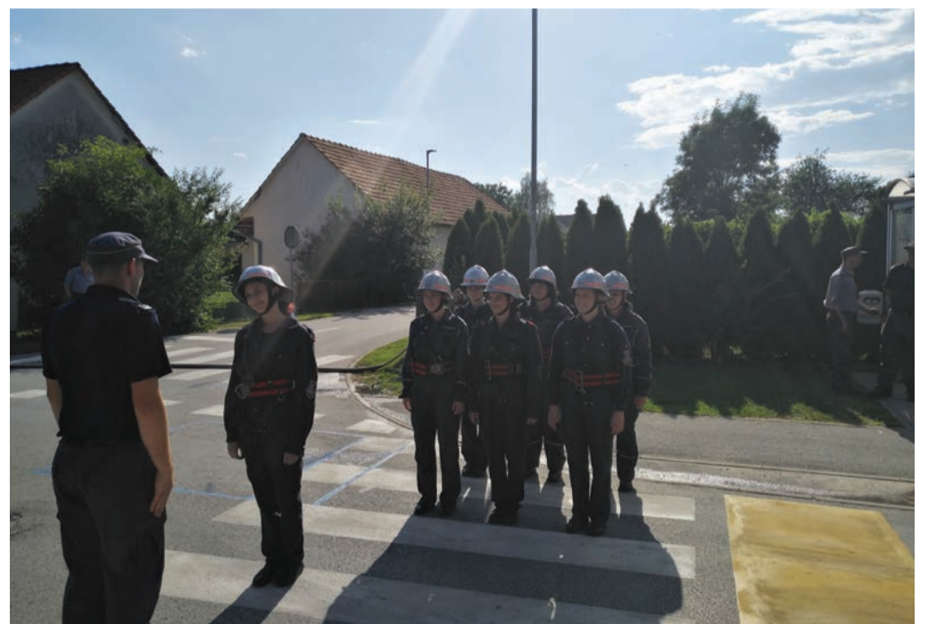
Gasilsko tekmovanje v Sobetincih

LIST IZ MARKOVCEV je glasilo občine Markovci, ki glasilo tudi izdaja. Uredniški odbor: Ivan Golob, Patricija Majcen, Anton Majerič, Marija Prelog in Alenka Domanjko Rožanc. Odgovorna urednica: Irena Pukšič. Lektoriranje: Alenka Domanjko Rožanc. Grafična priprava in tisk: Evrografis d.o.o., Maribor. Natisnjenih 1250 brezplačnih izvodov. Naslov uredništva: Markovci 43, 2281 Markovci. Telefon: 02 788 88 80. Spletni naslov: www.markovci.si https://www.facebook.com/ObcinaMarkovci