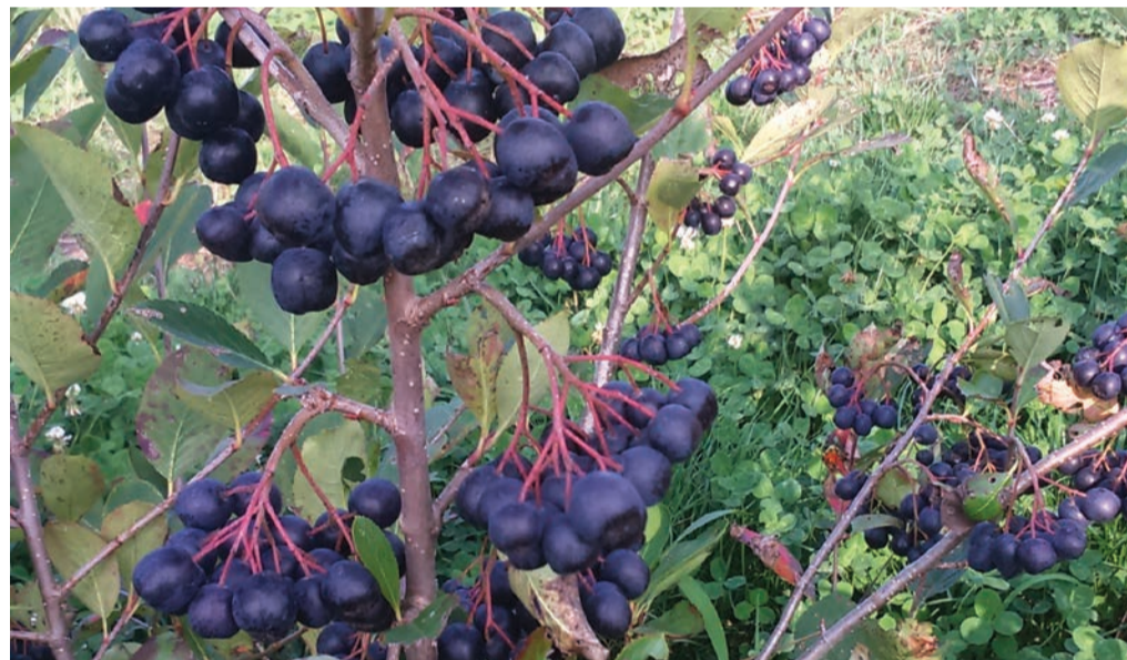
Zreli plodovi aronije