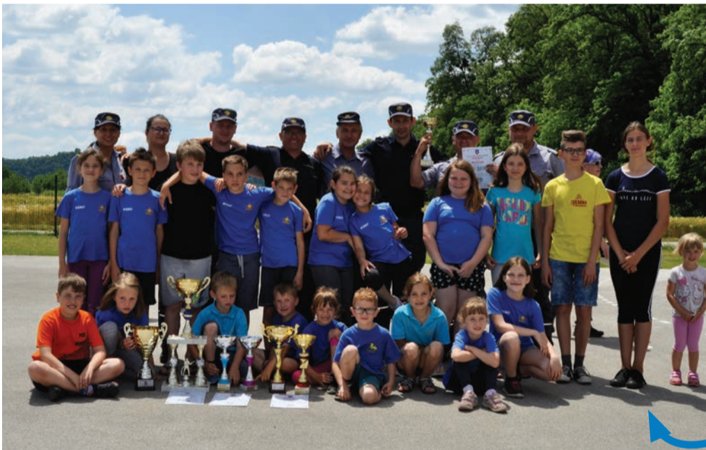
Zmagovalne desetine PGD Bukovci