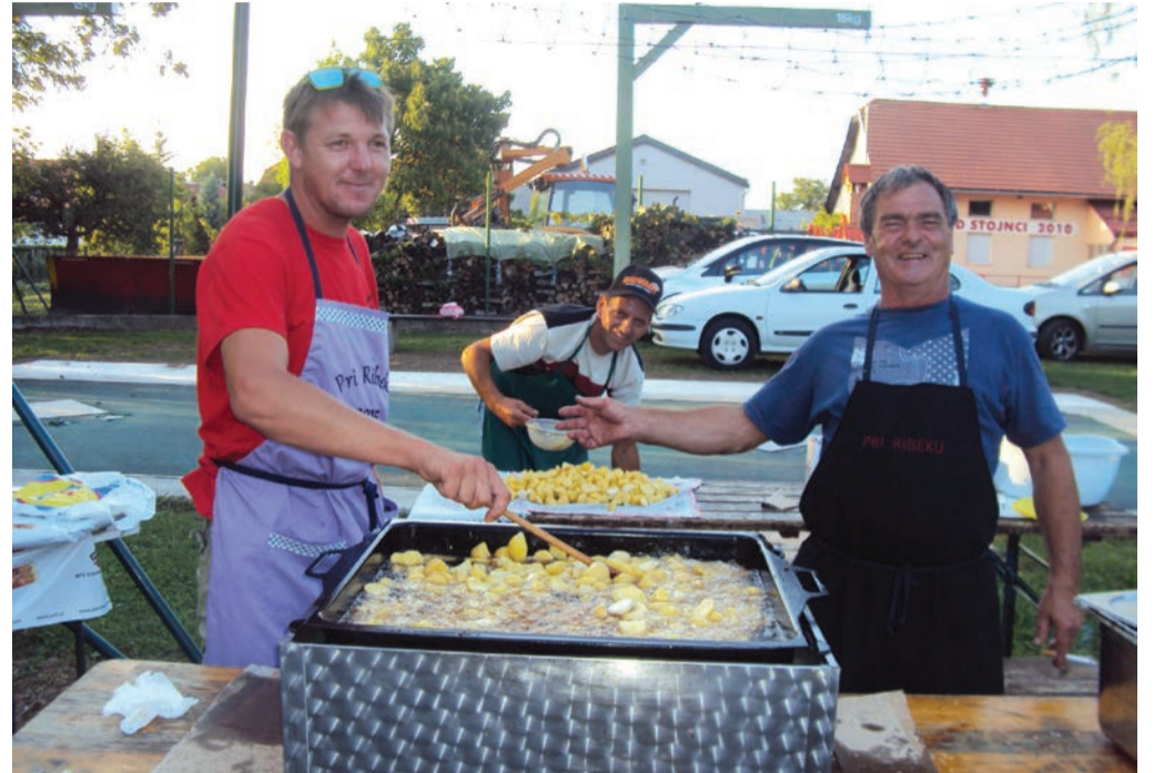
Stojncani so se pomerili v metu kocke, balinanju, odgovoriti pa so morali tudi na vprašanja iz kviza. Zadišalo je po dobrotah z žara in okusnem krompirju.