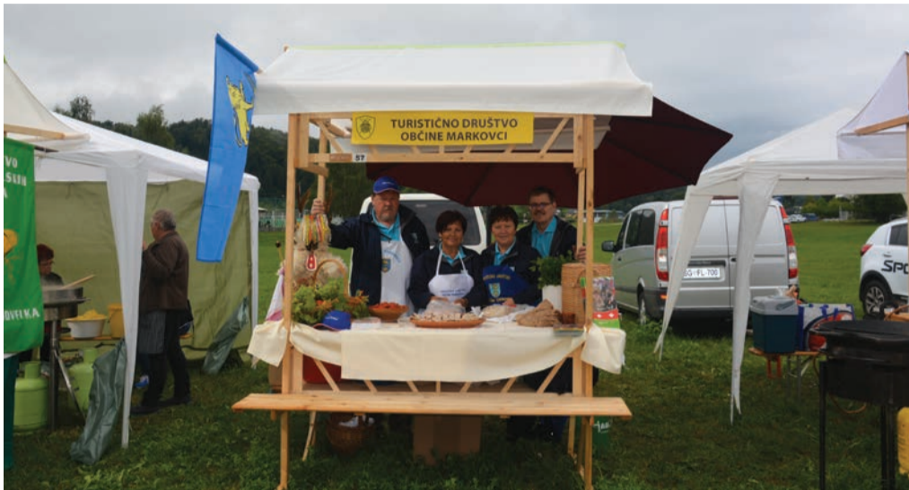
Člani TD Občine Markovci na festivalu praženega krompirja

Letos praznujemo 250 let od prihoda krompirja v deželo Vojvodine Kranjske. Lakota je odšla, prišla je dobra volja in ostala do današnjih dni. To dobro voljo med svoje člane in ostale ljubitelje te jedi deli in množi Društvo za priznanje