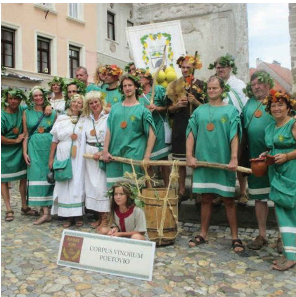
Ekipa TD Občine Markovci na 10. rimskih igrah