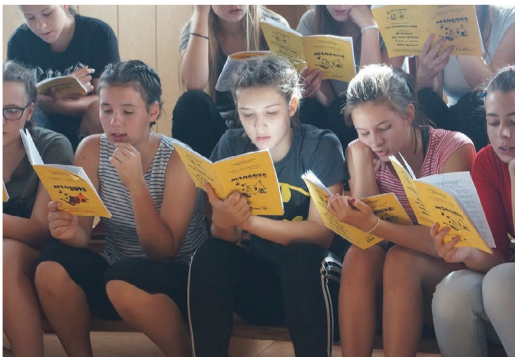
Animatorji so ob skrbi za otroke našli tudi čas za pevsko vajo.