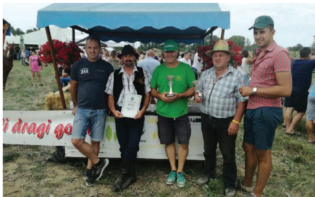
Na konjeniškem tekmovanju v hrvaškem Ludbregu so člani Konjeniškega društva Nova vas osvojili kar tri odličja.