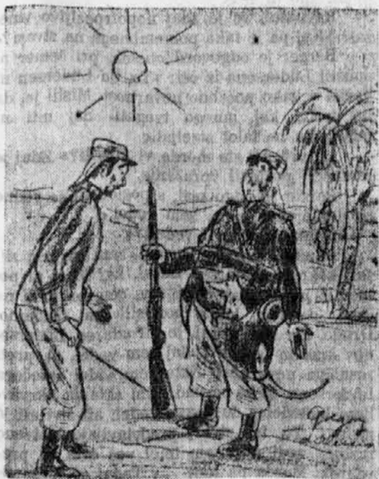
V tujski legiji.

Sreda, 19. februarja: Belgrad: 20 Zagrebški kvartet. — 21 Narodne pesmi. — 21.30 Jazz. — Zagreb: 20 Pianos iz Ljubljane. — Dunaj: 18.55 Salinkoferjeva opera »Dama v suzu«. — 22.10 Iz starih in novih zvočnih filmov. — 22.15 Jazz. — Budimpešta: 19.30 Pucničeva opera »La Bohème«. — 22.35 Ciganska glasba. — Trst: Milana: 30.35 Umetniški in kulturni večer. — 21.35 Komedia. — 22.10 Madrigali. — 22.45 Plesna glasba. — Rim-Bariz: 30.45 Respiantjeva opera »Ogionje«. — Praga: 19.25 Pihala. — 20.20 Ženski zbor. — 20.30 Schmidtjeva igra »Poslovilni večer«. — 21.25 Mlynarskega violinski koncert. — 22.15 Plošč. — Variava: 20 Filmske melodije na ploščah. — 21 Chopinove klavirske skladbe. — 22 Plesna glasba (iz Monakovega). — Vsa Nemčija: 20.15 Ura mlade generacije. — Berlin: 20.45 Pester večer. — Künigsberg: 21.10 Mali radijski orkester. — Hamburg: 20.45 Vojaški večer. — Pratišlava: 21.15 Iz avstrijskih alpskih dolin.