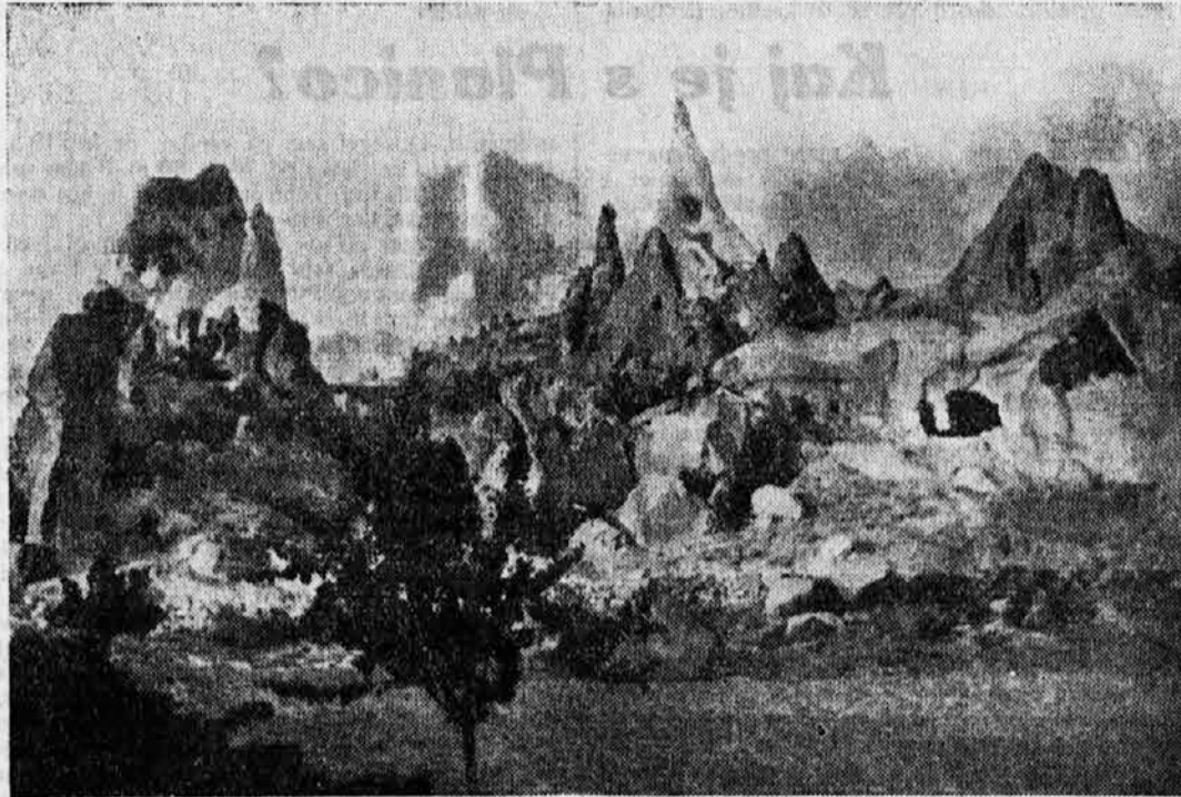
Pokrajina s konca sveta? Ne, samo divji kos narave iz maloazijske Kapadocije.

Na snegu in ledu so se prvi zabavali Finci. Narodni muzej v Helsingforsu ima med drugim v svoji zbirki tudi 3600 let stare skije, ki so jih našli v srednji Finski. Izraz »skij« izvira iz finske besede »suksi« kar pomeni snežne čevlje.