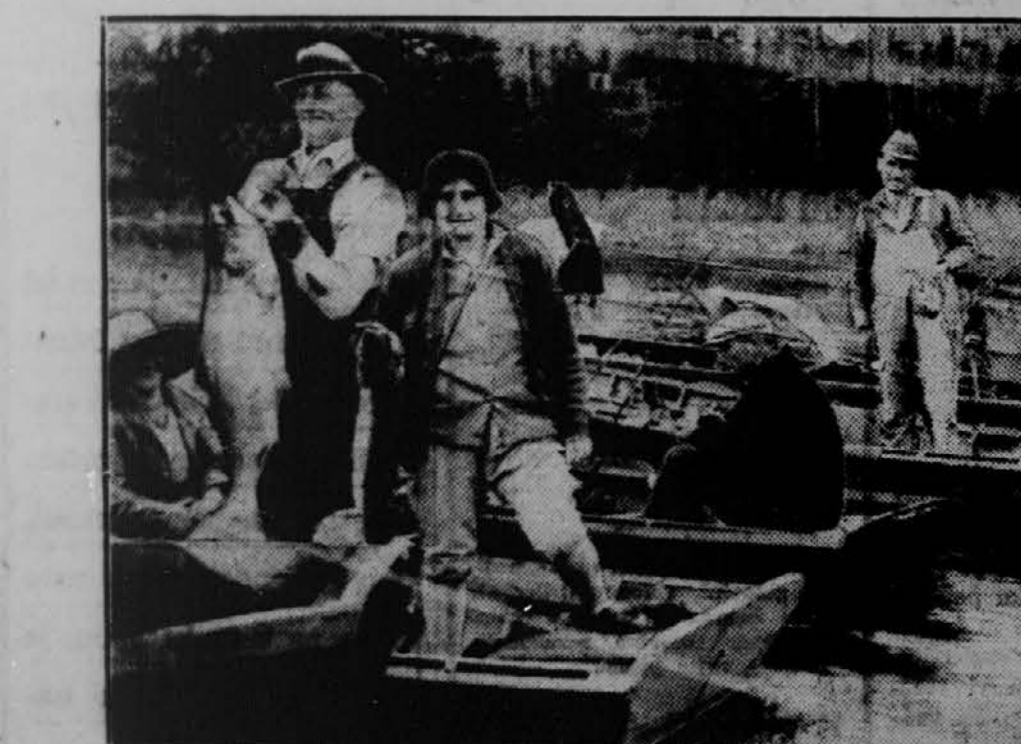
Prizor z reke Willamette v Oregon City, Ore., ko je velika množina losov (salmonov) dala nezaposlenim priliko, da nekaj zaslužijo. Čolani so bili tako tesno poleg drugega, da so tvorili pravcati most preko reke.