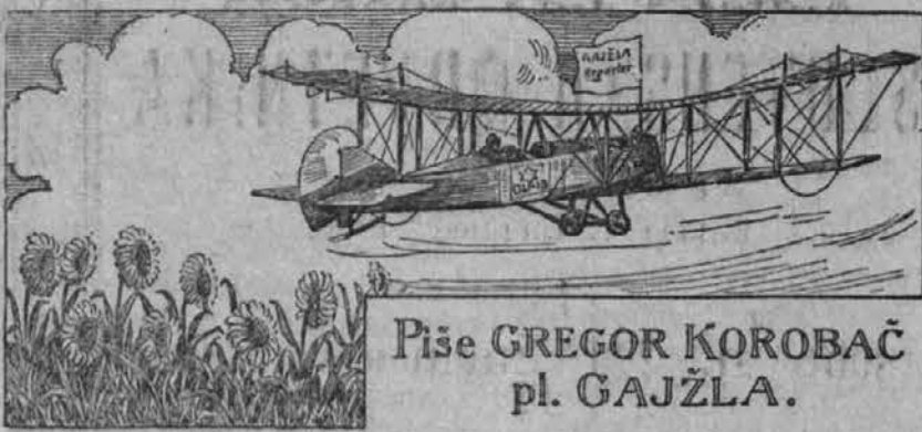
Piše GREGOR KOROBAČ pl. GAJŽLA.

To je pač zgodba, ki mora razveseliti sree vsakega davkoplačevalca v deželi. Vlada kupuje železnice, ki jih je prvotno podpirala v soglasju z ocenitvijo, ki je več kot petkrat previsoka. Zanje plača več, kot so vredne, potem pa jih zopet izroči v roke gospodom, ki so jih pognali v bankrot. To je pač rop ljudskega denarja v popolnoma odkriti obliki. Ta slučaj Missouri and North Arkansas železnice pa tudi dokazuje, zakaj so železniški magnetje tako navdušeni za infamni Cummins-Eschov zakon.