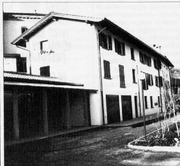
Al sta videli, kakuo so lepe ljudske hiše (case popolari), ki so jih an par miescu od tega uradno inaugural v Barnase?