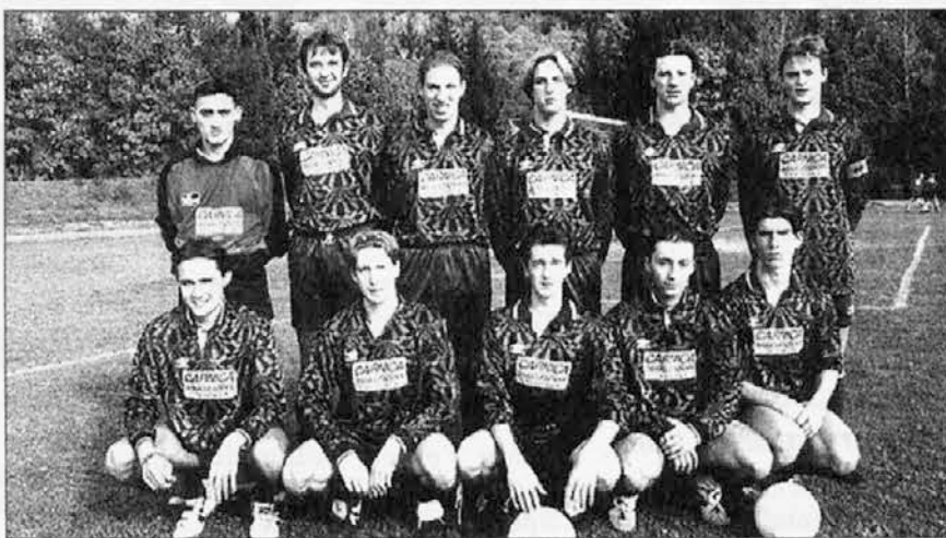
La formazione degli Juniores della Valnatisone

Le classifiche dei campionati giovanili sono aggiornate alla settimana precedente.