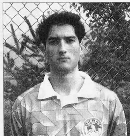
Zuiz, due volte in gol con la Valli del Natisone

La vittoria ottenuta consente alla Valnatisone di recuperare tre punti preziosi sulla Cividalese, che guida il girone. Domenica a Torreano gli azzurri affronteranno una squadra in piena salute. (p.c.)