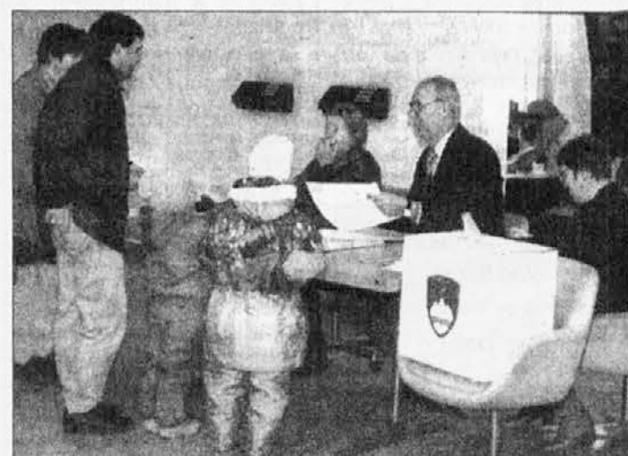
Alla consultazione referendaria riguardante il sistema elettorale in Slovenia è stata registrata una bassa affluenza alle urne, appena il 37%

Il ministro dell'agricoltura slovacco ha proposto "la cacciata" della Slovenia dalla Cefta, la commissione centroeuropea per lo sviluppo. La Slovacchia sostiene che Lubiana non si attiene alle normative della Commissione per quanto riguarda i dazi e le agevolazioni nel settore dell'agricoltura. Esiste una politica troppo protezionistica della Slovenia che impedisce gli scambi tra i paesi membri.