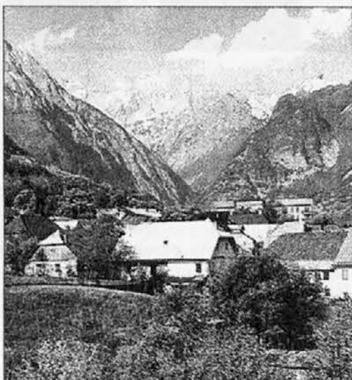
Pogled na Bovec

Na današnjem srečanju je najavljena prisotnost tudi samega slovenskega zunanjega ministra Davorina Kračuna.