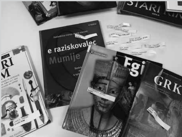
Slika 4: Dokazi o učenju

1. Naučil sem se, da se medicina lilo. pomešena se pred tisočimi leti. V različnih delih zgodovine so zdravilniki različno mislili in zdravili. 2. Naučil sem se brati CDK in polico knjige. 3: 😊