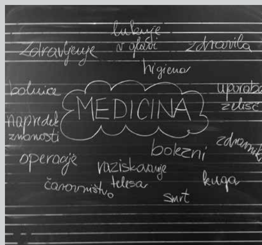
Slika 2: Miselni vzorec (preverjanje predznanja)