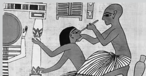
Slika 1: Očesna operacija v Egiptu v času starega veka

Oglejte si slikovno gradivo in preberite besedilo.