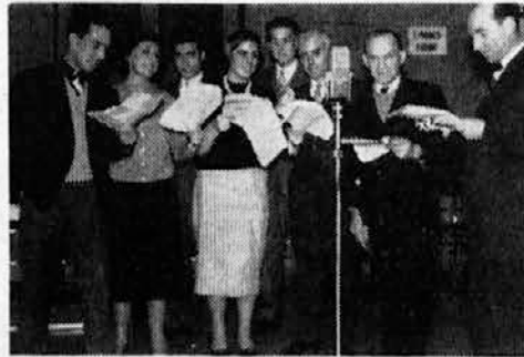
Radijski oder med oddajo

Največ smo igrali in igramo drame — govorimo o daljših dramskih oddajah — napisane za oder. Delno so ta dramska dela prirejena za mikrofonski pogost. Pogosto pa igramo tudi manj prirojene. Mnogo manjših dramskih tekstov pa je bilo napisanih posebej za radio. Tako posebno mladinske oddaje in dramatizirane zgodbe. Radijski arhiv hrani na svojih policah lepo število dramskih tekstov. Tako je človeku kar žal, da vse to tam leži kot mrtvo blago.