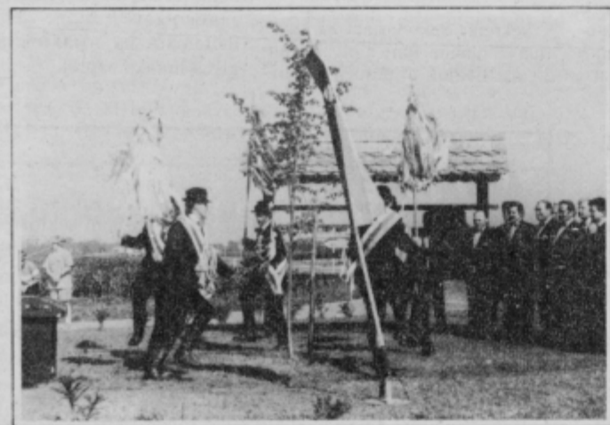
Okoli mlade lipe so zaplesali kopjaši.

ŽETALE: Vodstvo krajevne skupnosti si že dalj časa prizadeva, da bi zaradi naraščajočega tovornega prometa po cesti Podlehnik-Kozminci-Dobrina utrdili in popravili cestišče. Iz Sekretariata za gospodarsko infrastrukturo so jim na poslansko pobudo odgovorili, da bodo na ta odsek ceste do konca julija letos položili zaščitno plast asfaltbetona.