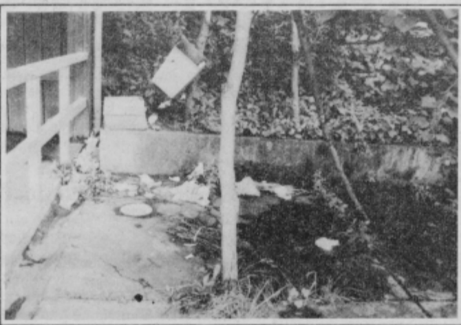
Ostanki kdove katerega piknika so ob prihodu k Dežnici prvi na očeh.