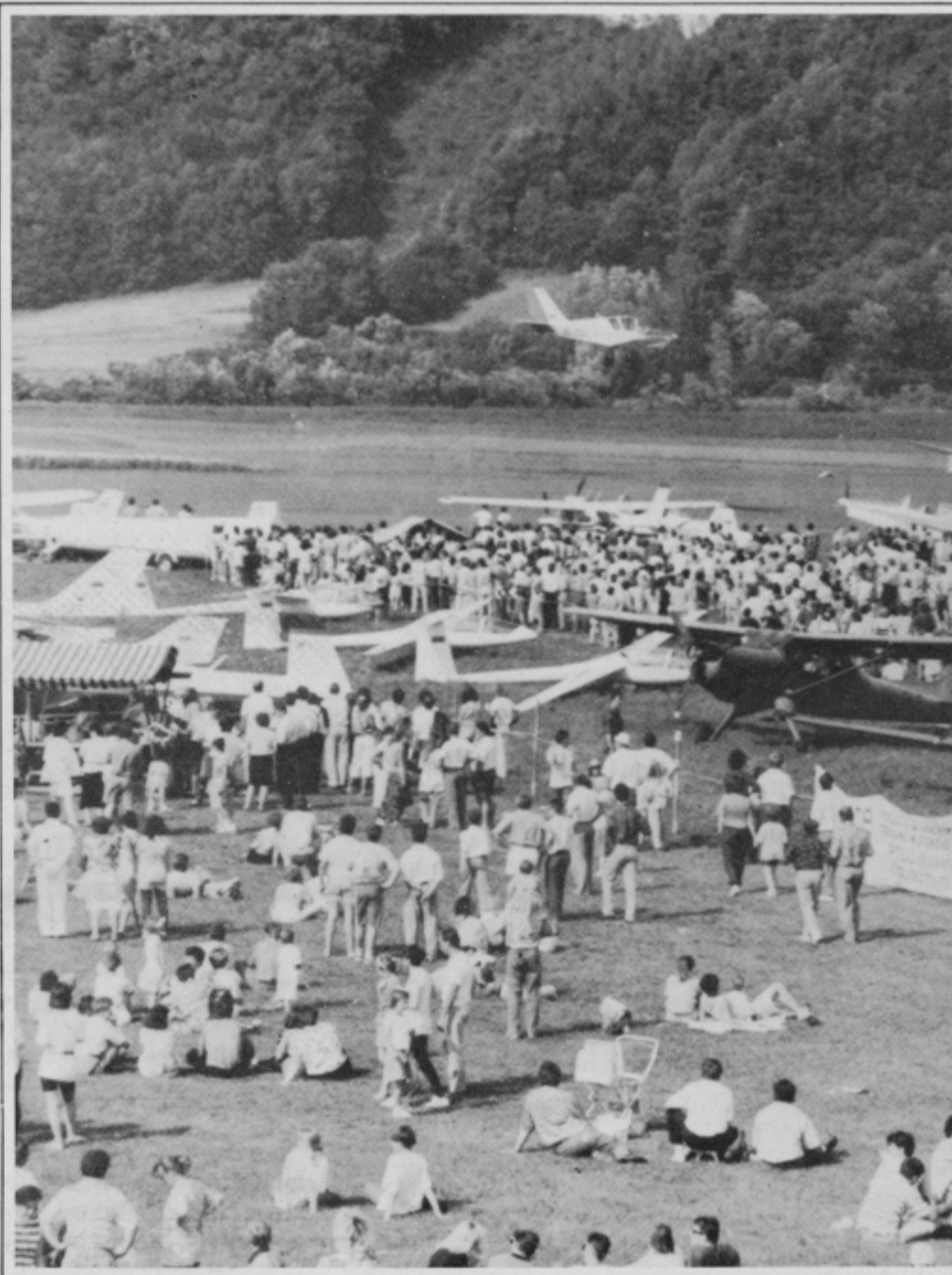
Množica letal in čudovito vreme sta na nedeljski letalski miting privabila več tisoč obiskovalcev. M. Zupanič