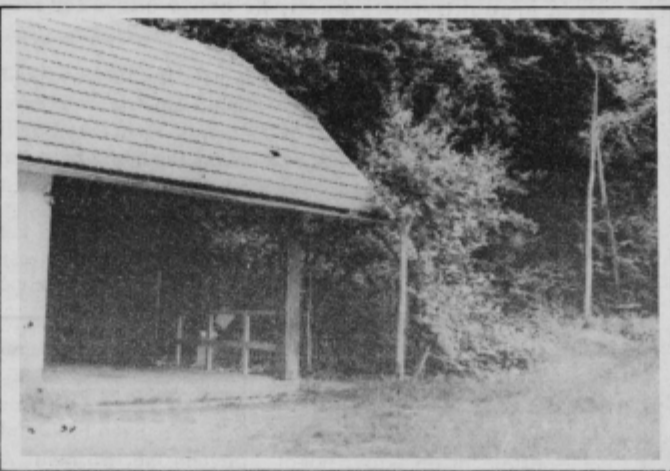
Ribiška koča Dežnica je le še senca nekdanje lepote. Streha je načeta, okolje zanemarjeno, brajda je klonila.