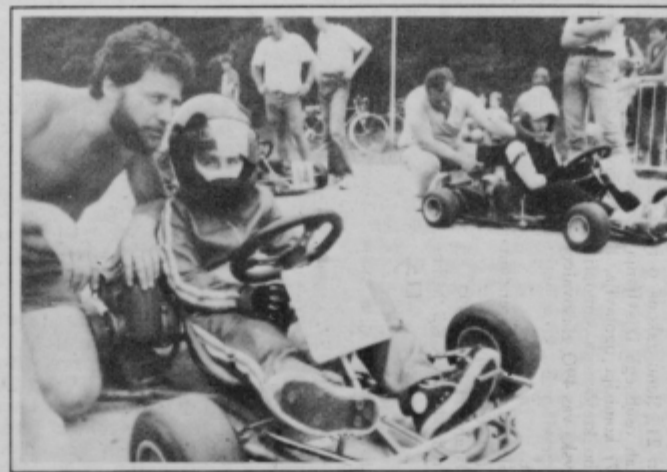
V nedeljo bo na 725 metrov dolgi najboljši progi v Sloveniji znova zelo zanimivo.

SREDA, 1. julija: 14.00 Uvod. 14.15 Novice, horoskop, varnost. 15.00 Obvestila, glasba in EPP. 16.15 Novice. 16.25 Za planince. 16.30 Po domače in čestitke. 17.00 Obvestila, mali oglasi, glasba in EPP. 17.30 VČERAJ-DANES-JUTRI, obvestila, mali oglasi. 17.55 Uspešnica dneva. 18.00 ROCK KOTIČEK.