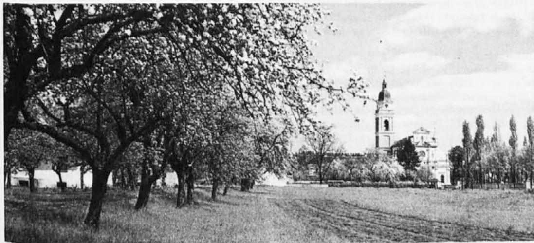
Marijino središče vernih Slovencev — božjepotna cerkev Marije Pomagaj na Brezjah

● Družinske šparovčke postne nabirke PROJECT COMPASSION vrnite čimprej, da moremo zaključiti nabirko in odposlati zbrani denar za najpotrebnejše na svetu!