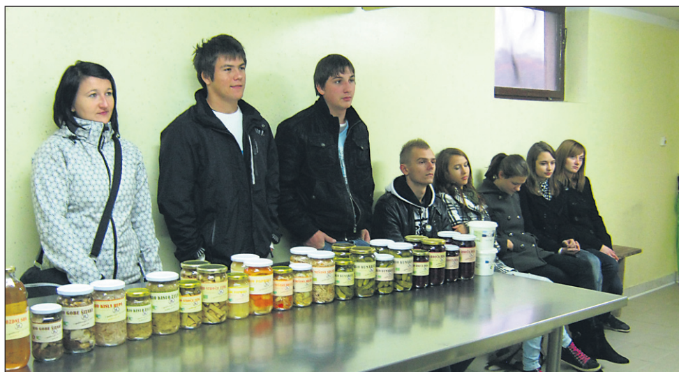
Dijaki smo spoznavali delo na biokmetiji Zel v Jastrebcih.