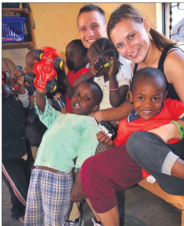
Izpod žgočega afriškega sonca kukajo iskrive in radovedne otroške oči ...