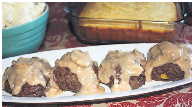
Telečja rulada z gobovim nadevom

Dobro zmešano maso razporedimo v obliki pravokotnika na peki papir. Do dveh tretjin nadevamo z rezinami mehkega sira (lahko tistega za toast), svežo rukolo, trakovi popečene (vlozene) rumene in rdeče paprike in kolobarčki oliv. Pozimi lahko rulado nadevamo z ostanki dušene špinače, grobo naribanim parmezanom itd. S pomočjo papirja tesno zvijemo in damo v hladilnik najmanj za nekaj ur, še bolje čez noč, da se strdi, okusi prepojijo ter da jo lažje režemo. Z ostrim nožem narežemo na 2-3 cm debele kolobarje. Previdno jih na obeh straneh popečemo na vročem