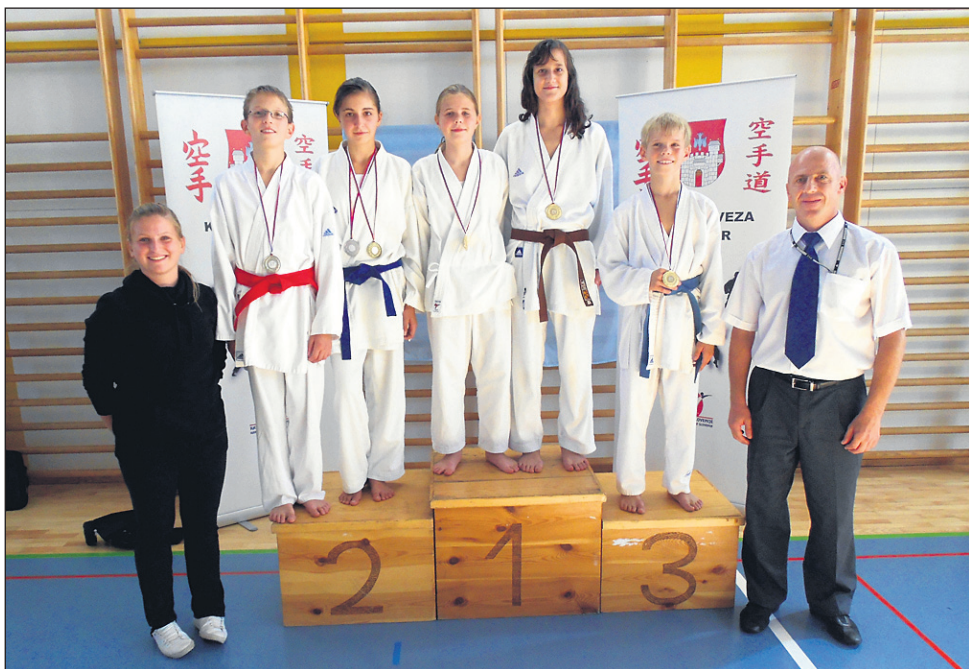
Uspešni mladi člani Karate-do kluba Ptuj