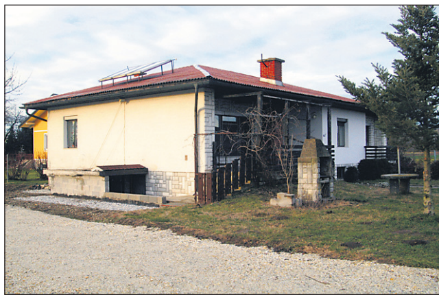
Čeprav je prva hiša oddaljena le nekaj metrov (zadaj levo), usodnega jutra sosede niso slišali nič posebnega.