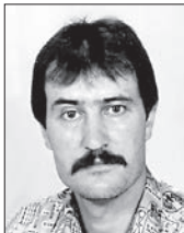
Vsi tvoji najdražji

Hvala vsem, ki prižigate sveče, prinesete cvetje in z lepo mislijo postojite pri njegovem grobu. Pogrešamo te!