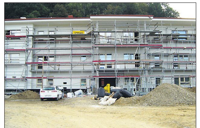
Enota ptujkega doma upokojencev v Juršincih bo svoja vrata predvidoma odprla 1. februarja.