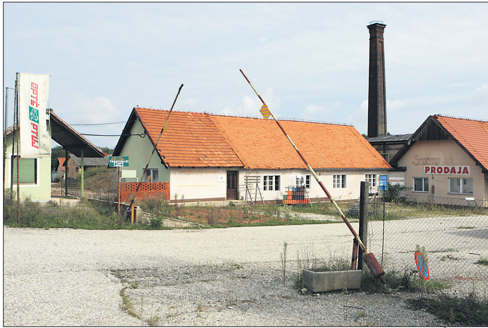
Zapuščena nekdanja opekarna, za katero še teče likvidacijski postopek, kaže žalostno podobo.