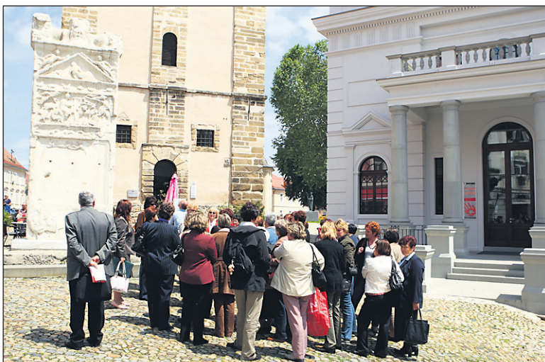
Ptujsko mestno jedro ne izpolnjuje pričakovanj domačih in tujih gostov