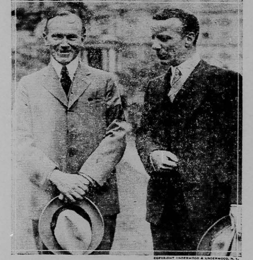
Slika nam predstavlja predsednika Coolidge-a in republikanskega kandidata za governersko mesto v državi New York, Col. Theodore Roosevelt-a.