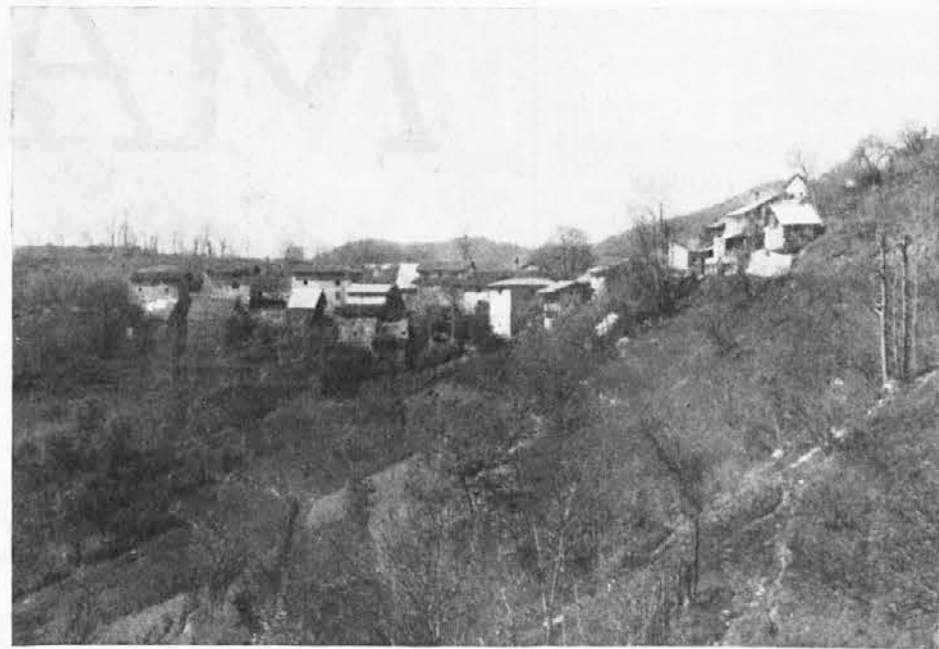
TRČMUN V SOVODENJSKI DOLINI, rojstna vas našega velikega pesnika in narodnega buditelja Ivana Trinka leži visoko v bregu na pobočju mogočnega Matajurja

Deželni odbor je sprejel okvirni načrt o ureditvi cest turistične važnosti. Načrt,