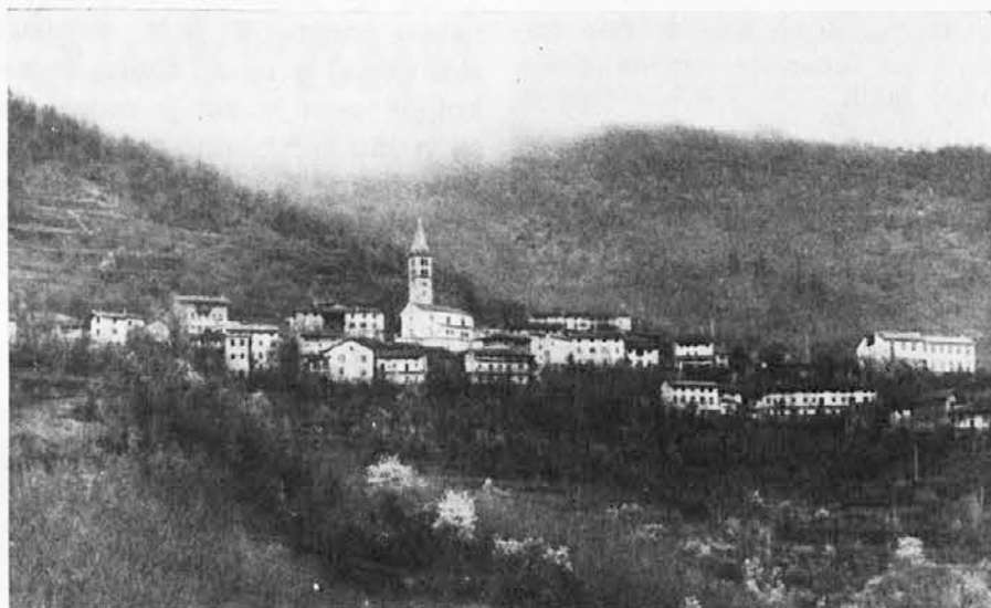
GORENJI BARNAS, precej velika vas v šempeterski občini. Tu so se do današnjega dne, več kot v katerikoli drugi vasi Beneške Slovenije, ohranila ustna izročila.

Od tistega časa oštarija je za gorenjega Barnašanja kù kalamita, de ne more mimo njé, an de če v nji dol sedne, se ne more vič odtrgati od klopi, dokjer ima še kajšno « palanko » v gajofi. An, magar takuò ne, ta boljzezan se širi še po drugih vaseh!