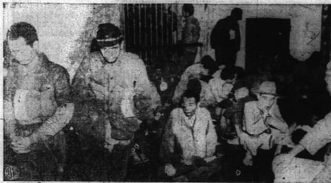
Ni res, da bi vsi japonski vojaki raje izvršili samomor, kakor pa se dalo ujeti. Vojaki na sliki so se že raje dali ujeti Amerikancem 37. divizije na Luzonu, Filipinski otoki. Zelo jih pa skrbi, kaj jih še čaka v bodočnosti, ko sedijo ali pa čepijo zaprti v tej sobi v ječi.