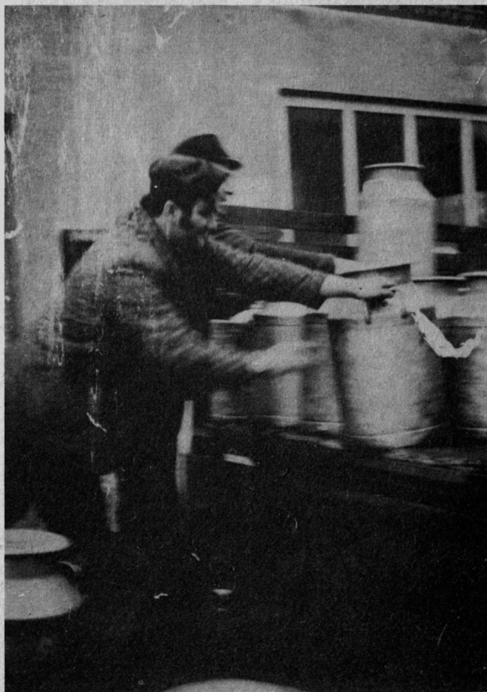
Le mleko „teče“ po predvidevanjih

Ob tem velja poudariti, da se veliko hitreje modernizirajo lokalne ceste. Temu je „kriva“ izjemna zagnanost nekaterih krajevnih skupnosti, predvsem pa seveda njihovi krajanji, ki to omogočajo z izdatnimi samoprivevki in z obilico prostovoljnega dela. V zelo kratkem obdobju so v krajevni skupnosti Ljubno na ta način modernizirali 8 kilometrov krajevnih cest, na Rečici 6, v Lučah 4, v Nazarjah 1,5 in v Mozirju približno 1 kilometer. Ostaja seveda dejstvo, da sredstev za ceste še naprej primanjkuje. To se odraža zlasti v dokaj slabem stanju nekaterih lokalnih in gozdnih cest, motnje v prometu pa povzročata tudi slabo organizirana zimska vzdrževalna služba na lokalnih cestah.