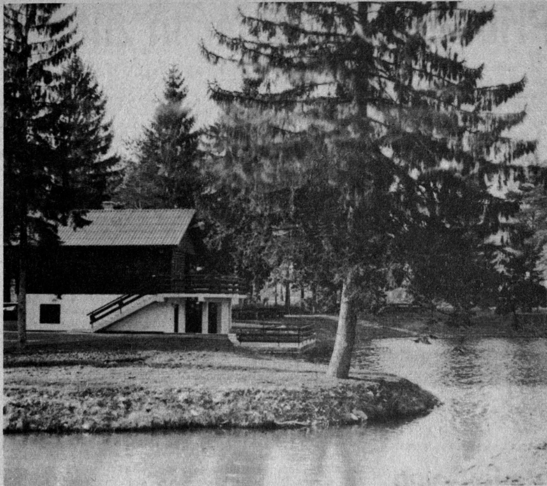
Dom ob ribniku – ponos mozirskih ribičev

Člani mozirske ribiške družine so se pred kratkim zbrali na svojem zboru in svoje delo v preteklem obdobju ocenili za zelo uspešno. Poleg rednega vlaganja in nakupa rib za potrebe voda s katerimi upravljajo, so ob Savinji zgradili obsežen ribnik in ob njem postavili prijeten ribiški dom. Ribnik so gradili skupaj s podjetjem NIVO in so si z njim tudi razdelili vložena sredstva. Danes je ribnik vreden 150.000 dinarjev, ribiči pa so vanj že vložili za 100.000 dinarjev potočnih postrvi, šarenk, krapov, belih amurjev in drugih belih rib. Dom ob ribniku so zgradili z lastnimi sredstvi in so zanj porabili 520.000 dinarjev.