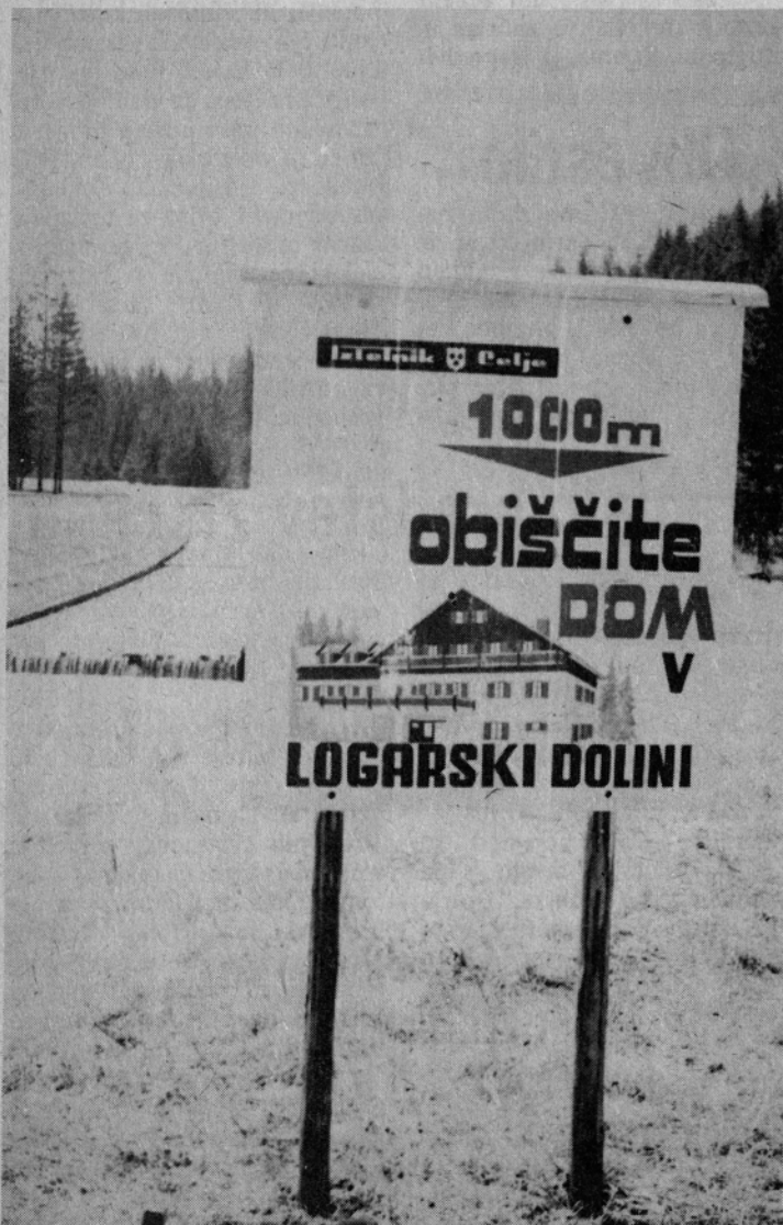
Prazni obeti ob vходу v Logarsko dolino