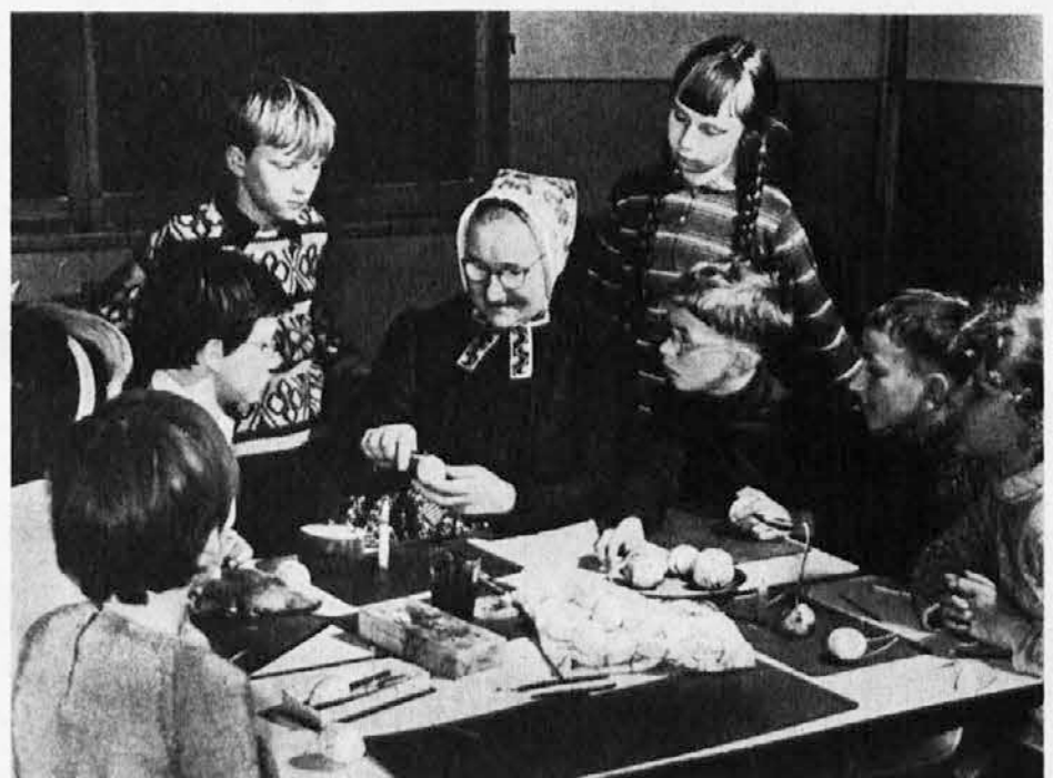
Usanze popolari degli slavi della Lusazia tramandate per secoli di generazione in generazione: Uova pasquali vengono pitturate.

Tutti questi fatti testimoniano della sagacia e promotrice opera che ha saputo svolgere, ai fini d'una piena realizzazione delle aspirazioni della minoranza etnica degli Slavi della Lusazia, la politica delle nazionalità della Repubblica democratica socialista tedesca, la quale così ha dato agli Slavi della Lusazia, che da secoli la sognavano, finalmente una patria.