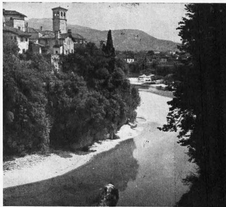
Čedad, ki je zaradi svoje lege imel vseskozi v zgodovini izredno važnost, se je že v langobardskih časih razvil v mirno in važno tržišče. Pavel Dijakon ga v svoji zgodovini imenuje « forum negotiationis ».

Za časa Napoleona je prišla Benečija pod Avstrijo. Meja na Kolovratu je odpadla, Tolminci so