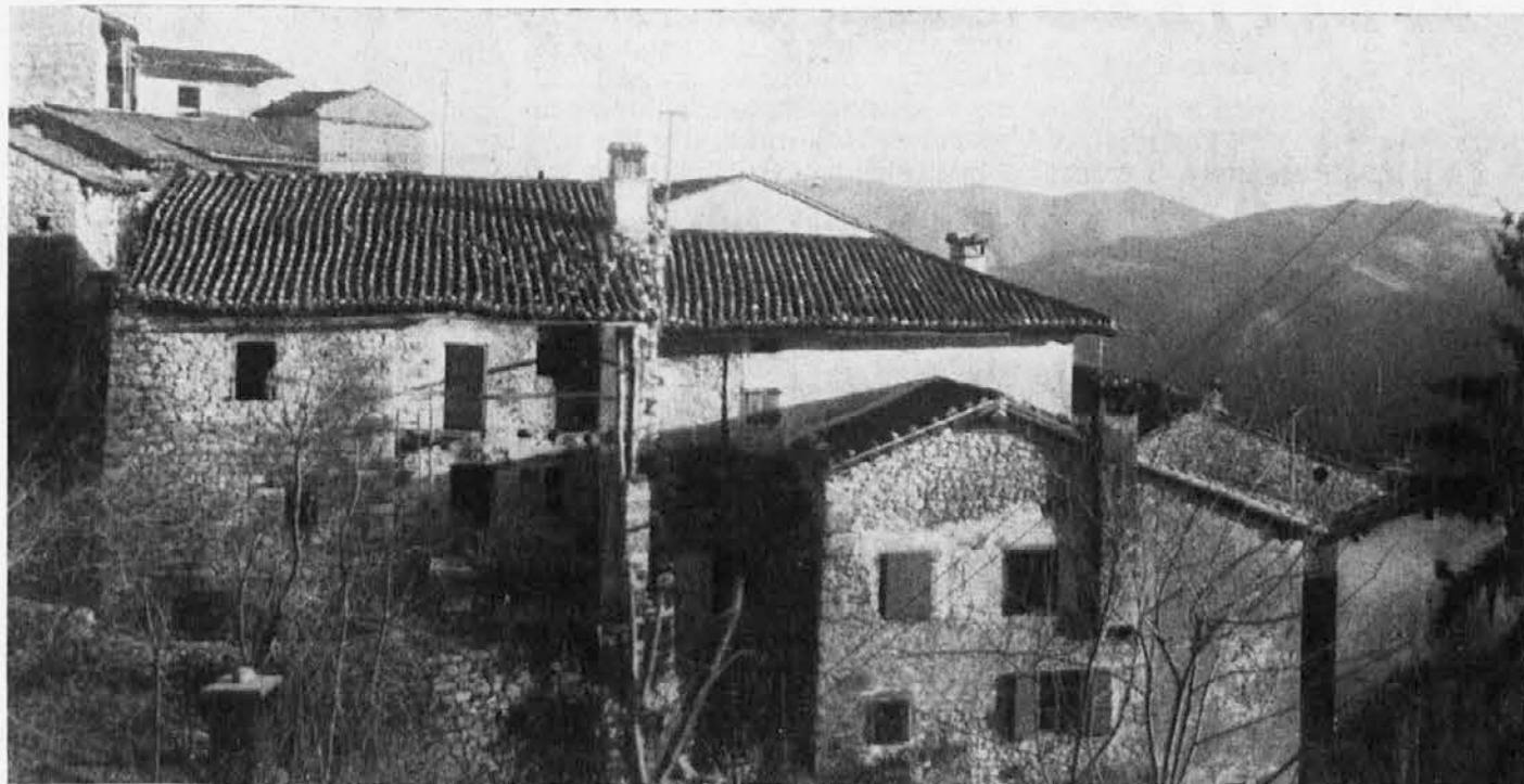
Breg v Terski dolini je najzapadnejša slovenska vas, ki pa na žalost počasi izumira. Ker ni v vsej okolici nikakega vira zaslužka, so se morali vsi njeni prebivalci izseliti. Na sliki: zapuščene in propadajoče hiše

Vprašujemo se, zakaj Slovenska skupnost ni prisotna v Beneški Sloveniji in Kanalski dolini. Čudno je namreč, da Slovenska skupnost na našem področju ni izkoristila v tem smislu ustavnih možnosti in zagotovil, ki omogočajo predvolilno kampanjo v slovenskem jeziku. Že s tem bi namreč lahko pridobila mnogo glasov naših ljudi, ki bodo zato verjetno odšli v korist drugih italijanskih strank. Tako smo spet zamudili edinstveno priložnost za prebujitev slovenskega življa v naši pokrajini in bomo morali zato verjetno čakati spet pet let, do novih volitev.