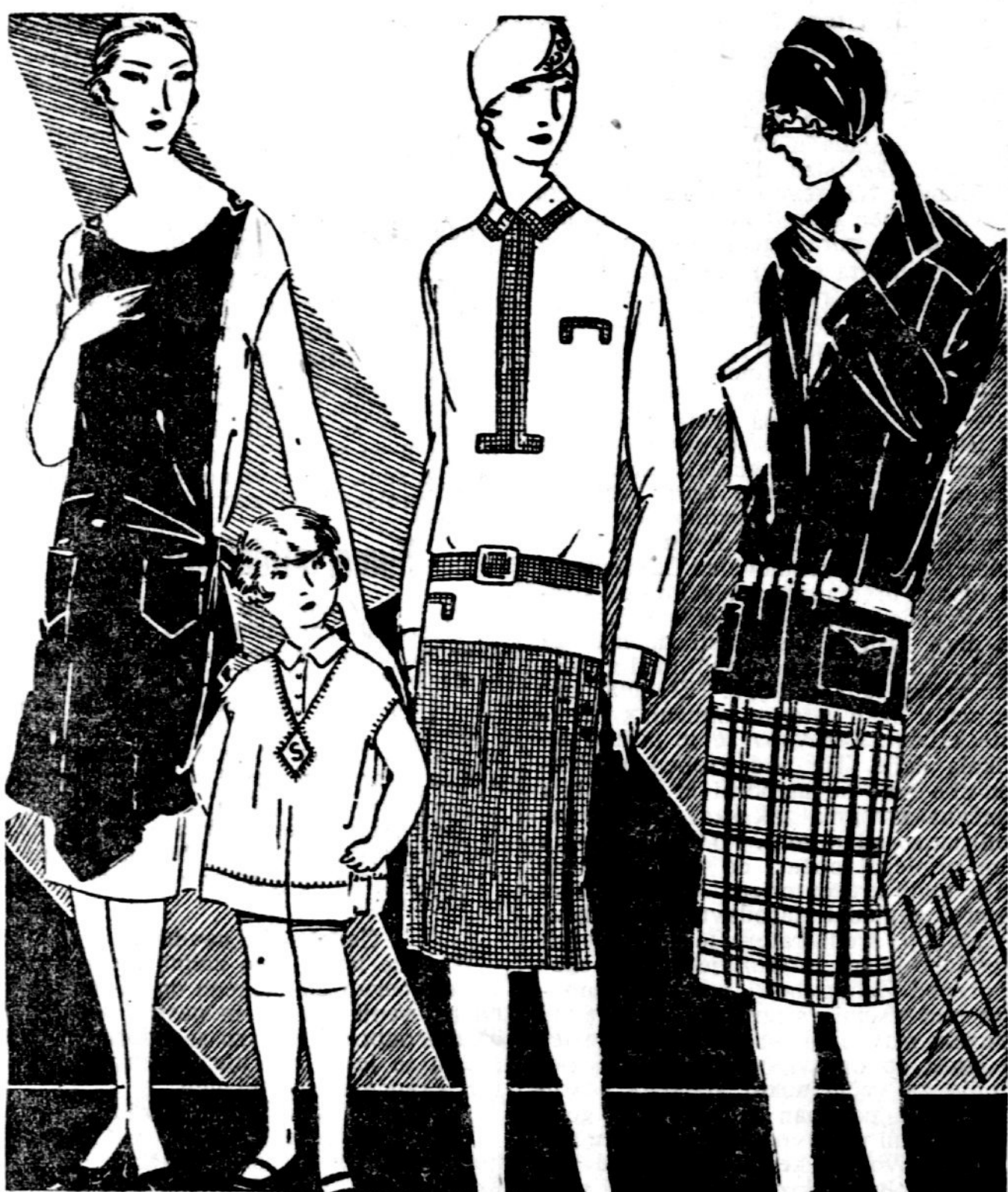
Trije vzorci elegantnih domačih oblek.