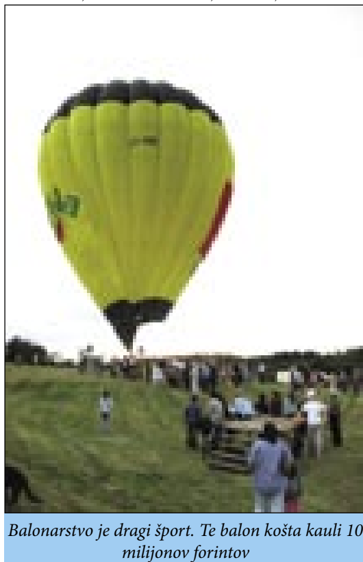
Balonarstvo je dragi šport. Te balon košta kauli 10 milijonov forintov

»Te balon gnauk zdigne gor kauli osemstau petdeset kil. Tü je pa od tauga odvisno, kak je vöni vrauče. Če je vöni fejst