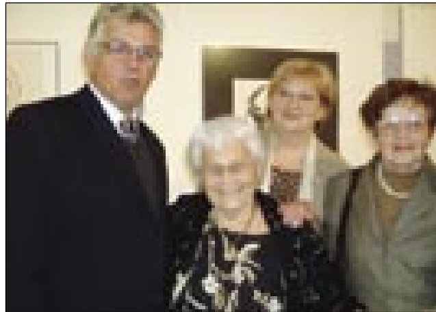
Gospa Pirike s svojimi nekdanjimi sosedi iz Murske Sobotne

smrti (l. 1998) prepustila mestni občini Murska Sobota, tako zanj skrbi Pokrajinski muzej Murska Sobota v okviru nastajajočega Kološevega kabineta umetniške fotografije.