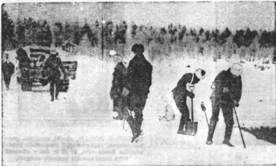
MINIRANJE OBMEJNEGA PASU. Finski vojaki polagajo mine vzdolž mejnega ozemlja proti Rusiji