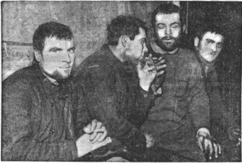
SKUPINA RUSKIH UJETNIKOV kadi pred zaslišanjem cigarete, ki jih je prejela od finskih vojakov