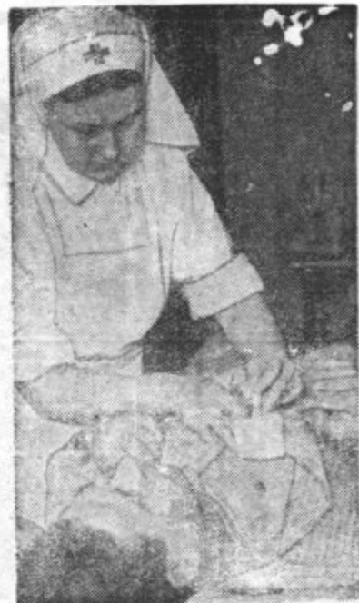
FINSKA BOLNICARKA neguje ranjenega finskega vojaka v poljski bolnišnici za fronto