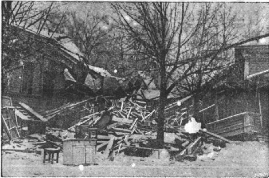
KADAR PADAJO BOMBE. Razdejanje, ki so ga povzročile ruske bombe v mestecu Hangö