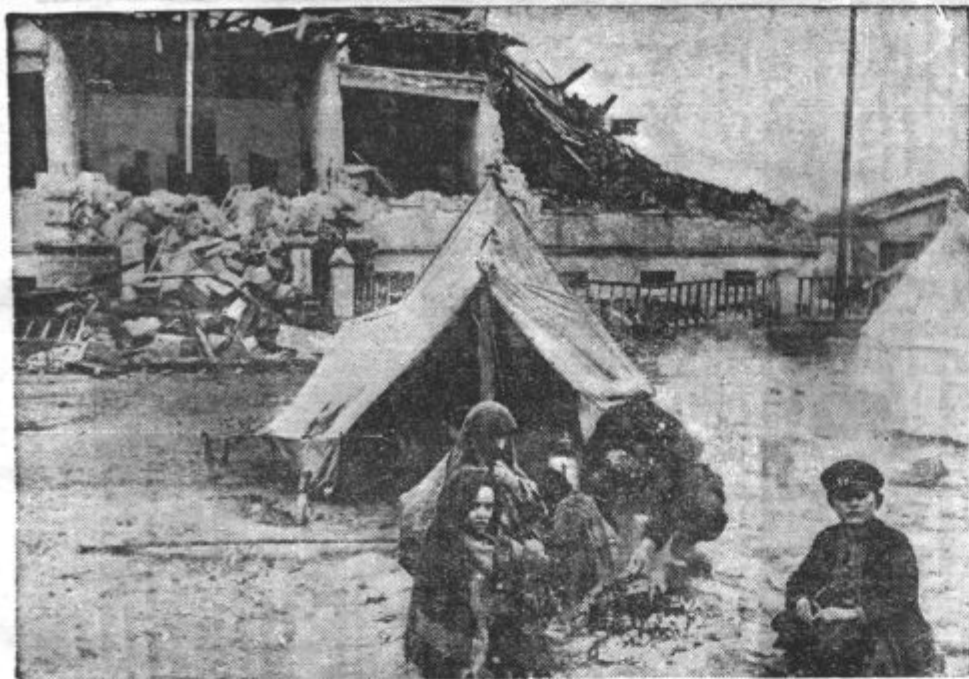
PO POTRESNI KATASTROFI V TURCIJI. Pred podrto hišo v Erzindžanu se je neka družina zatekla pod šotor