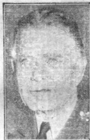
SENATOR BORAH , sloviti ameriški parlamentarec, najglednejši nasprotnik predsednika Roosevelta, ki je te dni v starosti 75 let umri zavrlo posledic nezgode