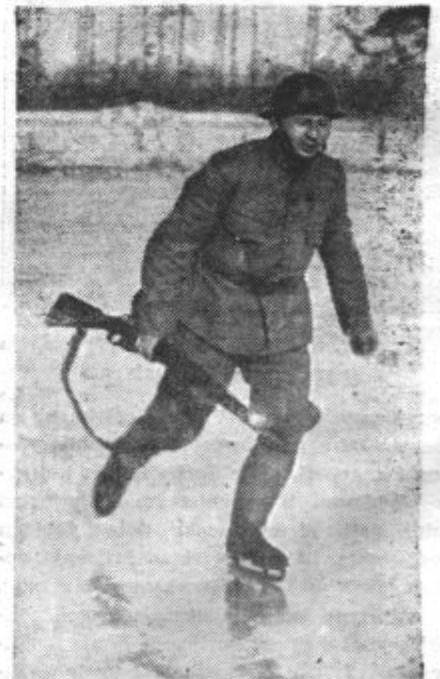
VOJAKI NA DRSALKAH. Zimski mraz je povzročil, da so prekopi in poplavljeni ozemlja na Holandskem zamrznila. Vojaki na straži so opremljeni zato z drsalkami, da se lahko hitro premikajo naprej