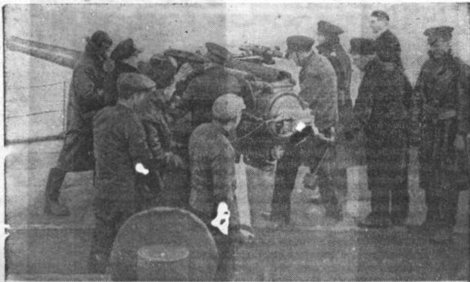
OBOROŽENA TRGOVINSKA MORNARICA. Anglija se je odločila, da bo vse svoje trgovinske ladje oborožila s topovi, da se bodo lahko same branile napadov nemških podmornic in letal. Admiraliteta je v ta namen osnovala organizacijo, ki naj to oborožitve izvede. Slika nam kaže pravkar montiran 12-centimetrski top na krovu britanskega trgovinskega parnika. Moštvo se vežba v ravnanju s tem topom