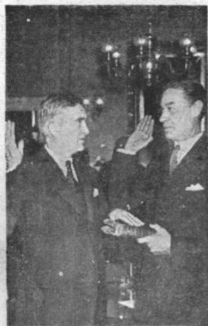
NOVI AMERIŠKI MORNARISKI MINISTER. Charles Edison, sin slavnega izumitelja, polaga ob nastopu svoje službe prisego