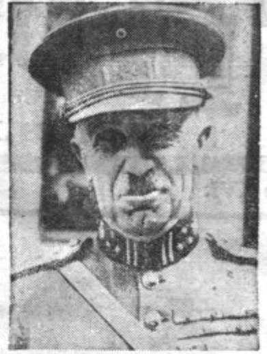
GENERAL HENRY DENIS , belgijski minister za narodno obrambo