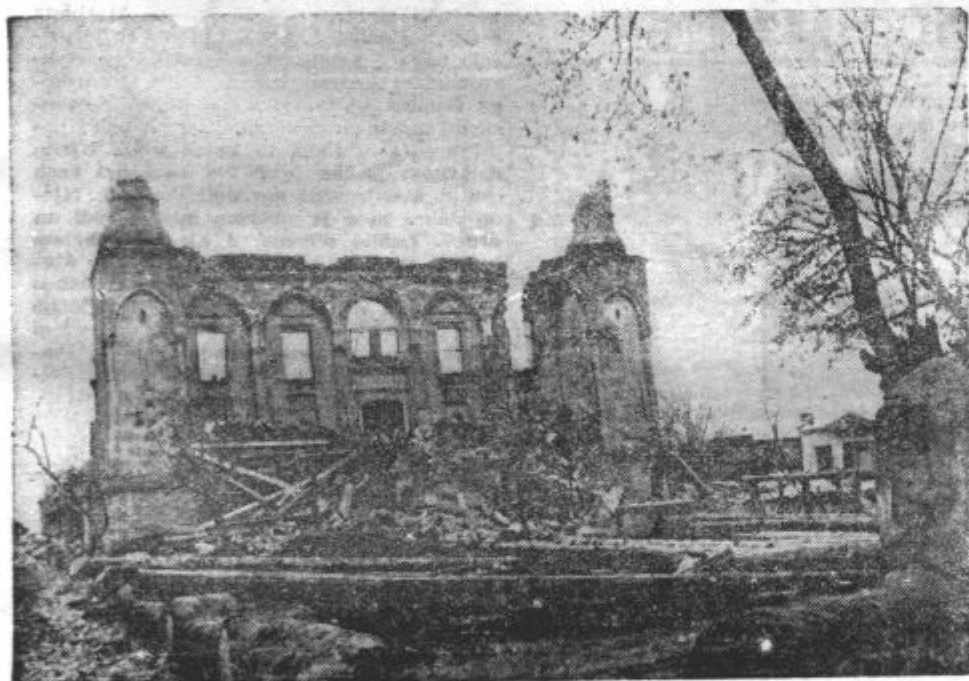
RAZVALINE MOSEJE V ERZINDŽANU