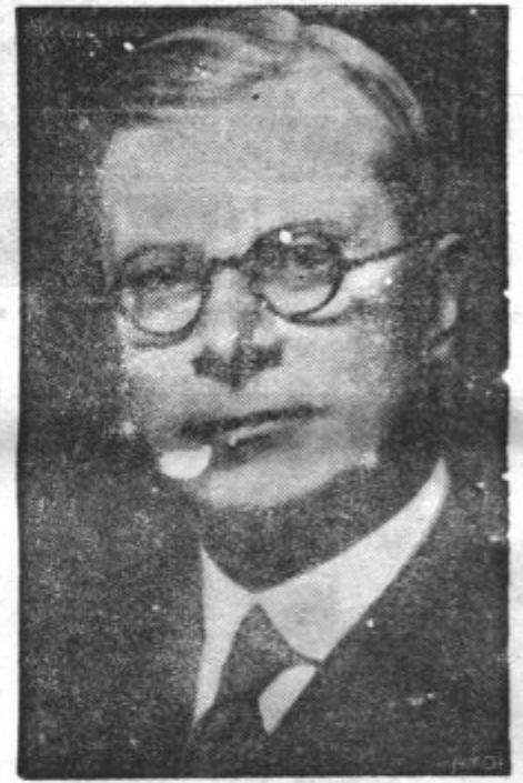
SIR OLIVER STANLEY , novi angleški vojni minister