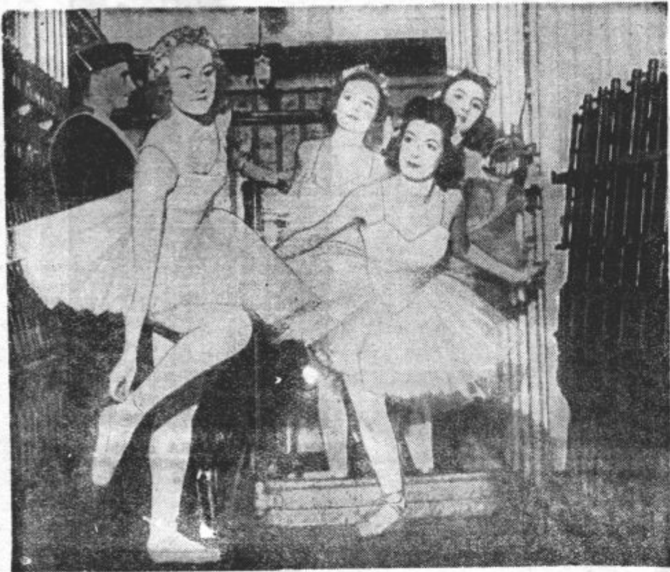
UMETNOST MED BOJNIM PLESOM. Da bi v vsakdanjost mornariških vojakov spravil nekaj spremembe, je baletni zbor pariške opere obiskal veliko francosko bojno ladjo in je posadki predvajal svojo umetnost