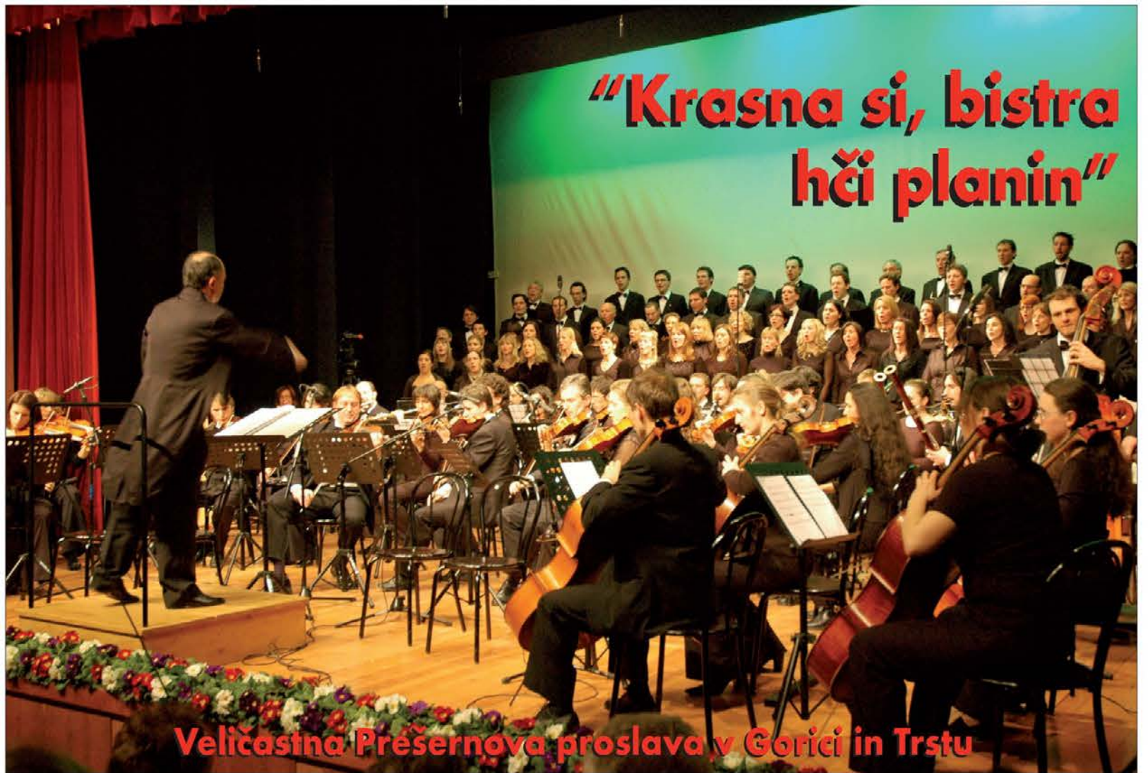
Velिकासina Préseernova proslava v Gorici in Trstu

Pravzaprav: Mar ni človeško, krščansko pa obvezujoče!, da bolnike obiskujemo, da se jim tudi na smrtni postelji nudi tolažba, da se za bolnike molji? A kako bomo-bodo to počeli tisti, ki še v svetost človeškega življenja in o svetosti svojih simbolov nismo-niso prepričani?