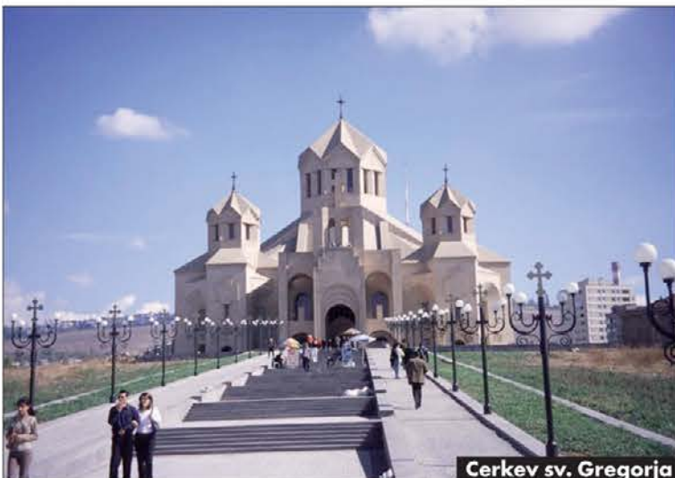
Cerkev sv. Gregorija

opravljal nekaj let škofovsko službo, nakar jo je podelil svojemu sinu, tako je v njegovi družini postala dedna služba, prehajala je od očeta na sina. V 5. stoletju je menih sv. Mešrop izumil armensko abecedo ter prevedel bogoslužne knjige v armenski jezik.