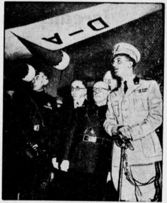
Italijanski prestolonaslednik Umberto si na mednarodni zrakoplovni razstavi v Milanu ogleduje nov model letala.

Krma za govejo živino je prav tako skrbno sestavljena in je shranjena v treh silosih na farmi. Hlapci, ki so na farmi v službi, so vsi doma iz okolice in so seveda za svoje opravilo posebej izšolani. Le po šest dni na teden delajo, v poletnem času seveda po deset ur na dan, pozimi pa imajo več prostosti, vendar so vedno enako plačani. Za te službe je zmeraj veliko prosilcev, zakaj služba na Pasteurjevi farmi je prijetna in velja kot odlično priporočilo za druge svobodne službe.