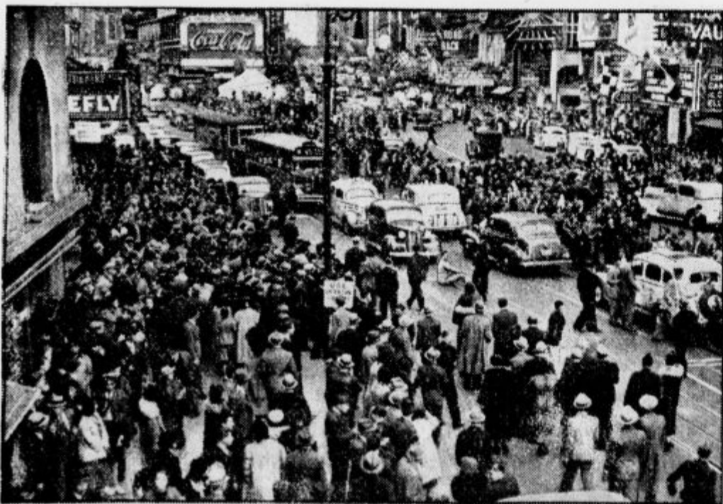
S sedenjem so štrajkali v Njujorku člani ameriških legionarjev. Na noben način jih niso mogli spraviti naprej. Zato so nastale velike prometne ovire.

20 gramov mandeljev popariš in olupiš. Nato jih v možnarju, kamor daš še malo vode in pet sladkorjev, jako na drobno stolčeš. Potem vse prevreš na ¼ litru mleka in pustiš stati 20 minut. Nato pretlačiš skozi gosto sito ali primerno blago in imaš pijačo — toplo ali mrzlo. (Tudi za oslabele, za slab želodec, slabo srce.)