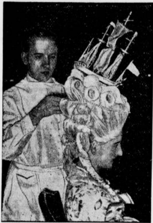
Takole so se dale ženske frizirati njega dni! — To frizuro je bilo videti na brivski tekmi v Berlinu