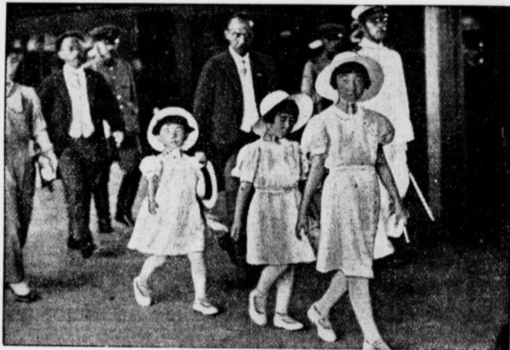
Japonske princeze Teru, Taka in Yori so se vrnilo s počitnic v Hoyami domov v Tokio.