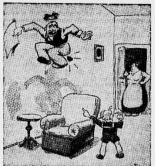
»Živijo! Lej mama, očka je pa le našel tisto iglo!«