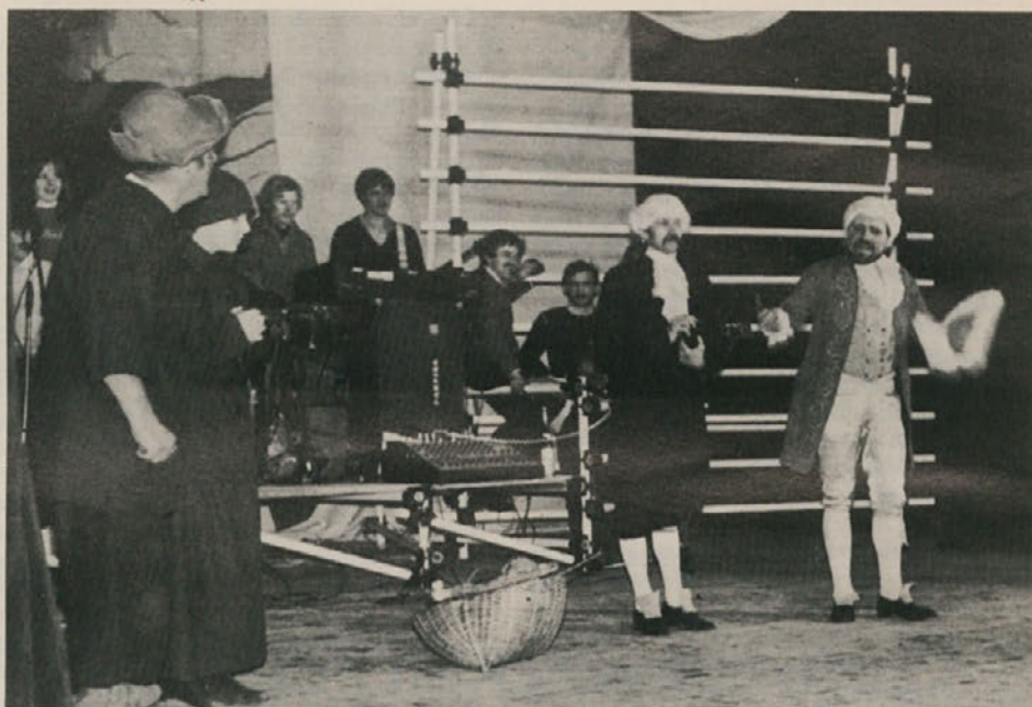
Prizor iz igre «Same pravce»

Program bo vseboval mednarodne partizanske in delavske pesmi posvečene miru v svetu.