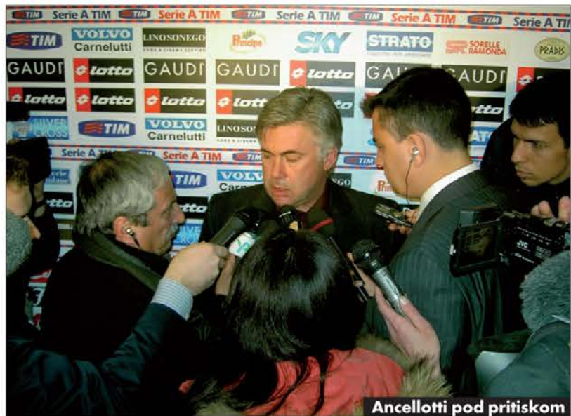
Ancellotti pod pritiskom

no je zjutraj ob kapučinu in briouso dan začeti brez časopisov. Za italijanske bralce je to res zelo težko. Saj bi brez Corriereja in Repubblica že preživeli, a kaj ko v stavko privoljujejo tudi časnikarji Gazzette. Prava tragedija. In v času zadnje stavke, pred Božičem, je bilo na sporedu tudi nogometno prvenstvo. Italijanski državljani so ravno v času božičnih počitnic, ko imajo največ časa na razpolago, ostali brez najbolj priljubljenega čtiva v roza preobleki. Dve prvenstveni koli in prvi odzivi na zimsko kupoprodajno borzo brez časopisov (nogometnaši so tekali po zelenicah 20. in 23. decembra, časopisov pa v kioskih ni bilo od 21. do 26. decembra). Informacije in komentarji na psu. Nogomet se je na novinarsko stavko požvižgal in v odsotnosti časopisov speljal kar dve prvenstveni koli. Zanimivo, kako so lahko Italijani preživeli toliko časa brez časopisne športne informacije. Verjetno pa je še bolj zanimivo, kako so nogometiški preživeli toliko časa brez zasvoženih