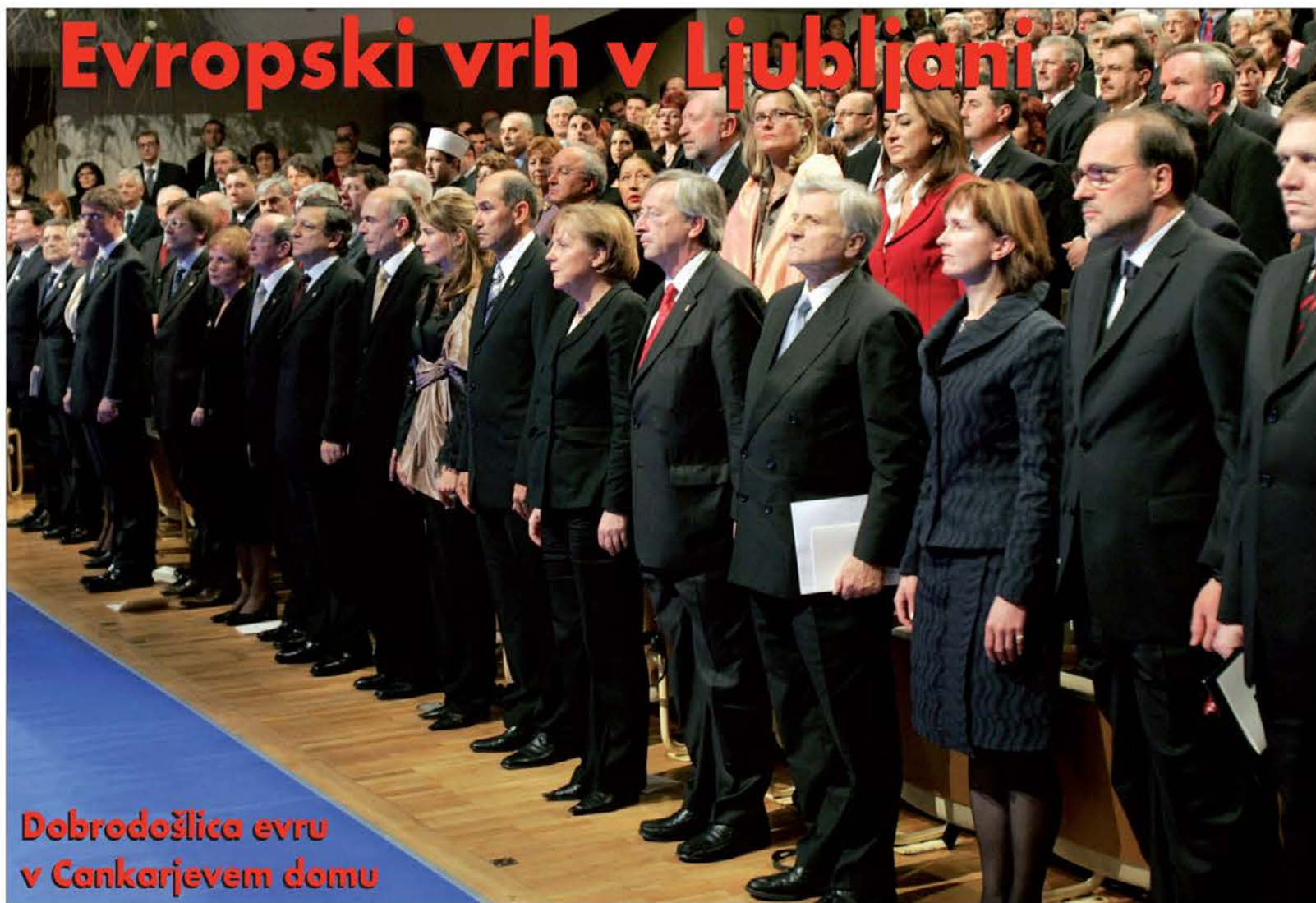
Dobrodošlica evru v Cankarjevem domu