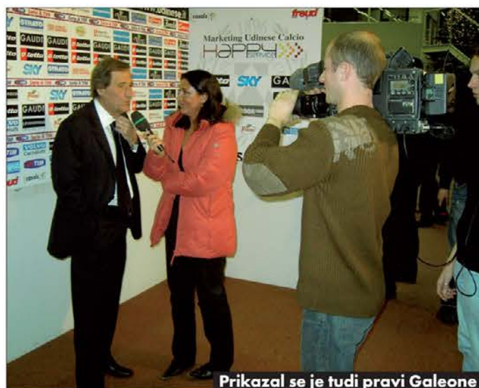
Prikazal se je tudi pravi Galeone

liko pa je bilo kamermanov in novinarjev z mikrofoni. Obredno so si vsi novinarji najprej ogledali zadetke in komentirali tekmo. Prednjačili so seveda krajevni novinarji, tako da so bila mnenja o velikem deležu sodnikove krivde za Udinesejev poraz soglasna: "Ja, ko bi Milanu ne dosodil neob-