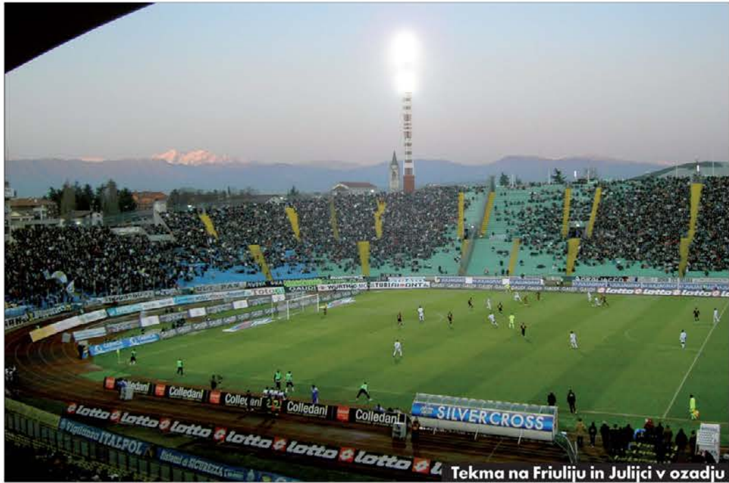
Tekma na Friuliju in Julijci v ozadju

Tekma je nekoliko nepričakovano pripadla Milanu. Ancellottijevi varovanci so zmagali s tremi goli razlike. Sodnik je Udineseju neupravičeno odrekel in Milanu velikodušno dosodil enajstmetrovko. Rdečečrni so tako zlahka osvojili tekmo. Novinarska tribuna, ki je bila vleskozi dokaj polna, je tako za stavkajoče časopise in nastavkajoče radie in televizije beležila preporod Milana, ki si je predvsem po zaslugi Kakaja polepsal Božič in omogočil Ancellottiju, da je brezskrbno pil novoletni šampanjec. Po tekmi se je seveda novinarska srenja, ki se je zbrala na Friuliju, preselila v "spodnje prostore", v prostore za tiskovne konference. In tam se je šele začela prava veselica. Predstavniki tiska res ni bilo dosti, veliko pa je bilo kamermanov in novinarjev z mikrofoni. Obredno so si vsi novinarji najprej ogledali zadetke in komentirali tekmo. Prednjačili so seveda krajevni novinarji, tako da so bila mnenja o velikem deležu sodnikove krivde za Udinesejev poraz soglasna: "Ja, ko bi Milanu ne dosodil neob-