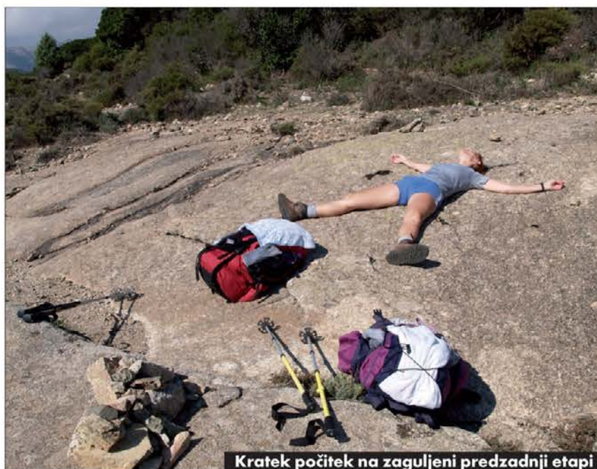
Kratek počitek na zaguljeni predzadnji etapi