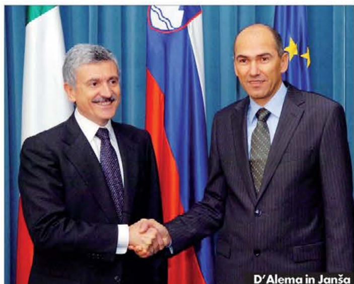
D'Alema in Janša

trebno tudi skladnejše sodelovanje med dvema parlamentoma, je rekel. Cukjati je poudaril pomen evroregionalnega povezovanja, ki odpira velike možnosti gospodarskega in družbenega razvoja. Nato se je italijanski minister srečal s člani odbora DZ za zunanjo politiko, pri čemer mu je skupina poslancev predala pobudo v zvezi z vračanjem omdulin umetnin ob začetku druge svetovne vojne, ki jih je Italija po mirovni pogodbi iz leta 1947 dolžna vrniti. D'Alema in Rupel sta napovedala ustanovitev medministrske delovne skupine za sodelovanje pri energetiki, transportu in ekologiji, ki naj bi pripravila skupno strategijo za omenjena področja. Italija obljublja prozorno sodelovanje tudi pri načrtovanju plinskih terminalov v