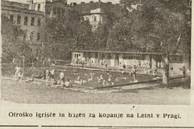
Otroško igrišče in bažen za kopanje na Letni v Pragi.