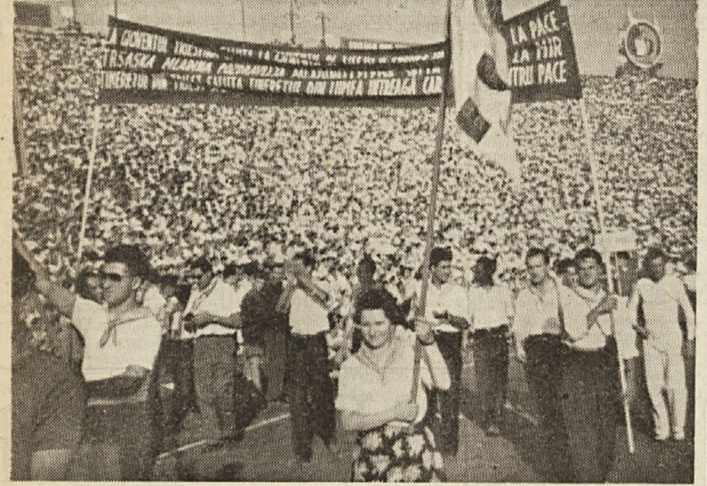
Tržaška mladinska delegacija v povorki na Festivalu v Bukaresti

V Rimanjih: na sporedu je razvite sekcijske zastave, zanimiv kulturni spored in razstava ZSSR.