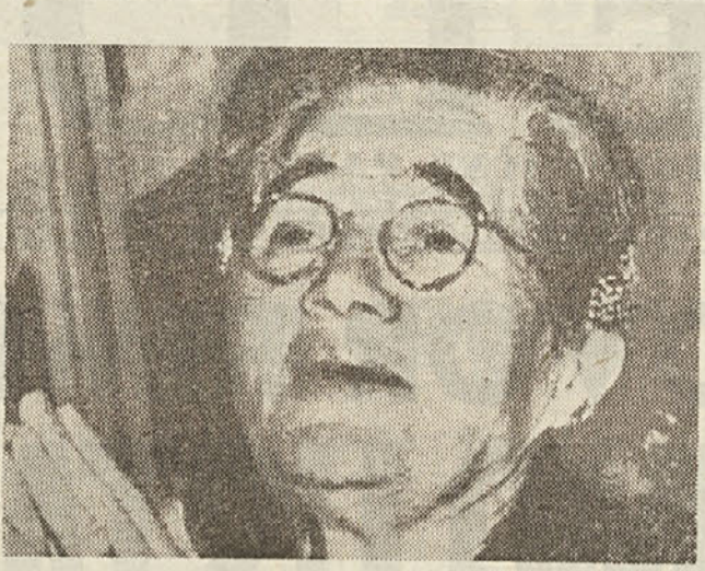
Niti prošnje trpečih matere niso omeščale trdosrčnosti Eisenhowerja