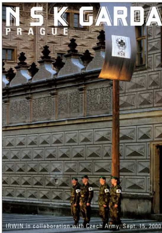
IRWIN in collaboration with Czech Army, Sept. 15, 2000