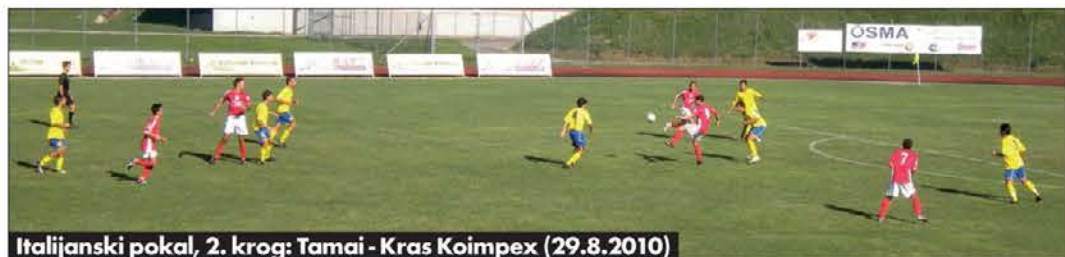
Italijanski pokal, 2. krog: Tamai - Kras Koimpex (29.8.2010)