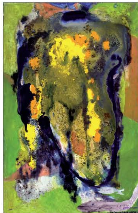
Suzana in starci, akril, platno, 2009 100 x 65 cm

kakor bi želela; žal ima pred seboj realno zemljo. Toda prav v tem trenutku je vse več ustvarjalcev, "ki objemajo nebo in širijo