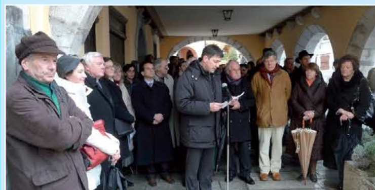
Slovensnost ob odkritju plošče v spomin na Trubarjevo bivanje v Gorici