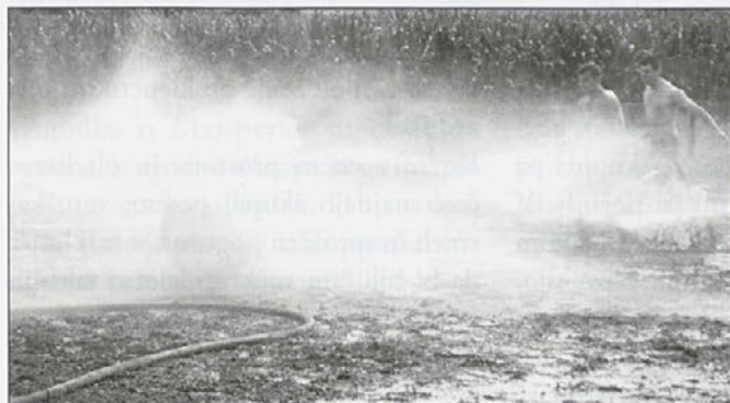
Kje je žoga?