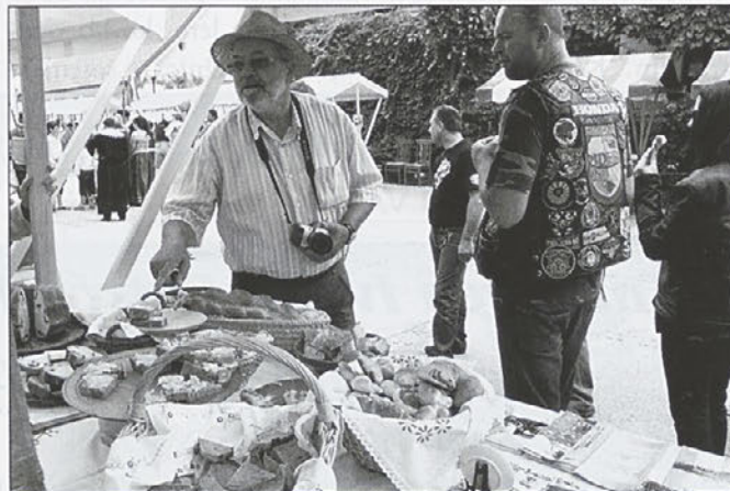
Številni so se ustavili pri bogato obloženi stojnici TD Ptujška Gora.

odzvalo povabilu, da pripravi prikaz sojenja. Prav tako smo prosili Društvo žena Tisa iz Ptujске Gore, da speče nekaj dobrot. Res so se potrudile, saj je bila naša stojnica najbolj obložena. Mi smo s seboj vzeli promocijski material turistične ponudbe naše občine, knjige o Ptujski Gori in nekaj spominkov. In še nekoga smo srečali na trgu Podsrede - našo županjo. Bili smo zelo veseli, da je naša čas za to prijetno prireditev in druženje z nami. Po uvodnem pozdravu, nagovoru župana ter otvo-