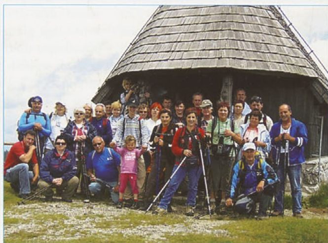
Skupinska pri cerkvi