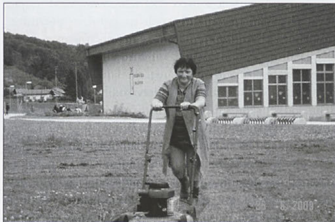
Posamezni vzorni primeri. Za takšne moraš imeti res srečo, da jih srečaš.