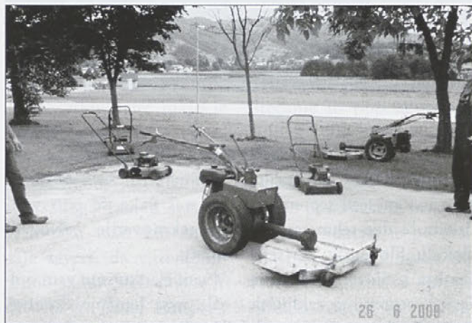
Motorizirana enota koscev PGD Majšperk