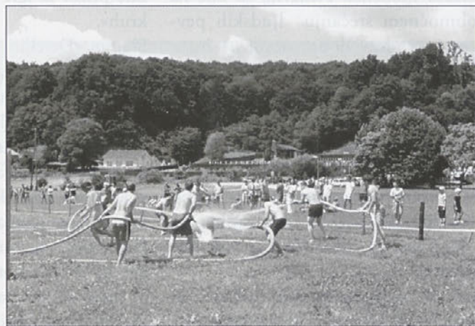
Sonce, blato in voda