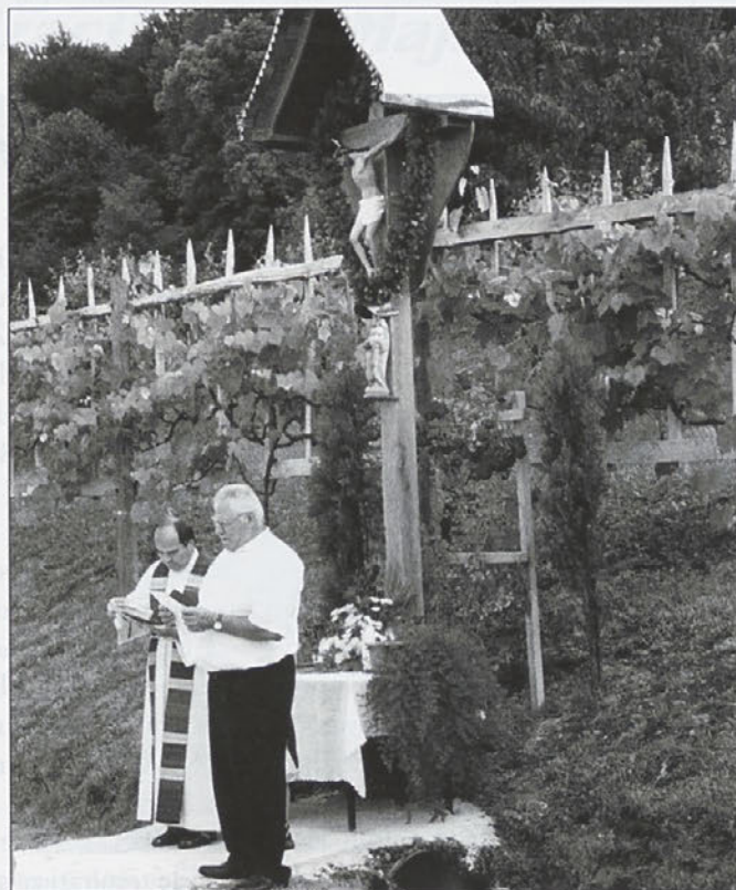
Fotografija desno: Nov križ v Podložah