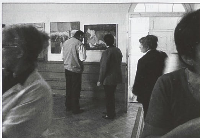
Razstava Abstrakcije v Hamrah