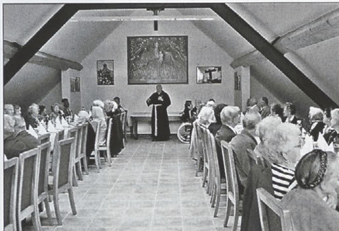
Starejši na Ptujski Gori