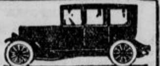
Model 56 sport

GLAVNO ZASTOPSTVO: - ELASTO D. D. ZAGREB - BOŠKOVIČEVA UL. 8