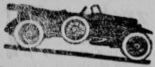
Model 56 Torpedo