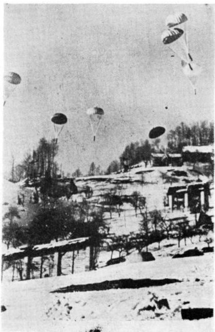
Pomoč iz zraka med borbo na Cerkljanskem (dokumentarni posnetek)