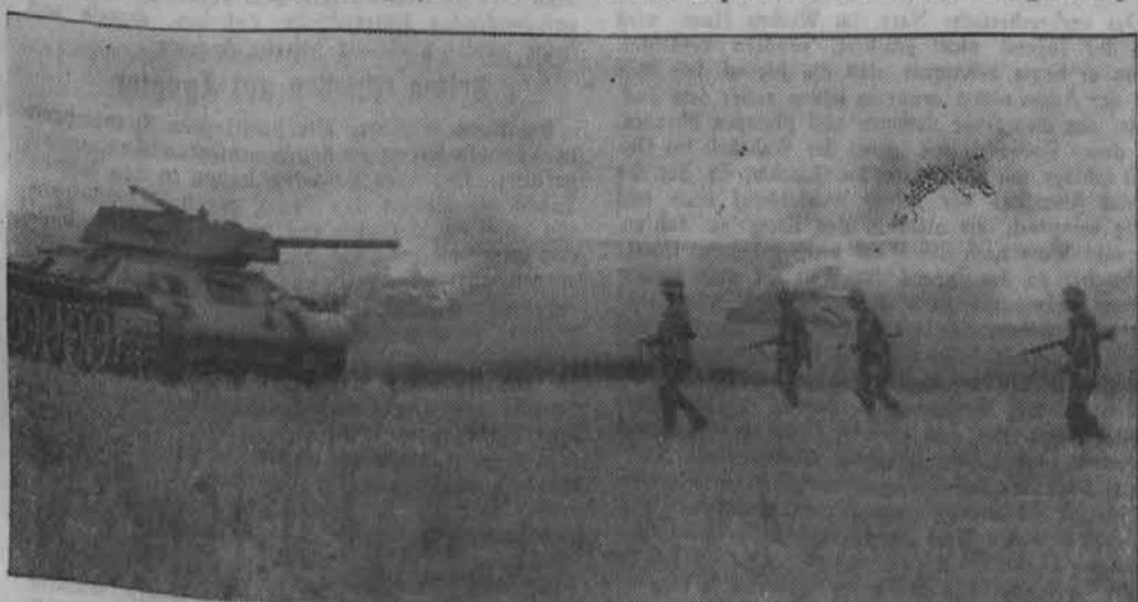
Kako so se zrušili sovjetski poskusi izpadov