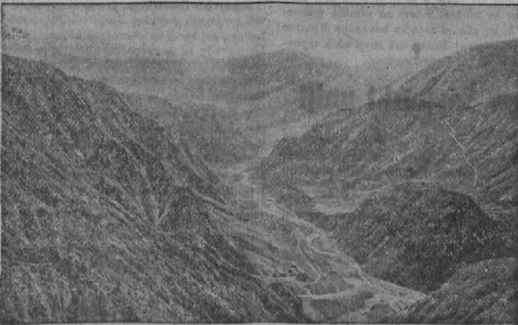
Nemške čete napredujejo v kavkaškem ozemlju. Počel na neko s pragozdovi pokrito dolino kavkaškega pogorja.

Genf, 9. septembra. Mornariški minister USA Knox se je izrazil pred zastopniki častopisja o enem izmed najbolj perečih problemov Zedinjenih držav, to je o tonažnem problemu. »Podmorniški problem«, tako je izvajal Knox dobesedno, »še nikakor ni rešen. Tudi bo vedno težje dobiti zadostno število ljudi za ladijsko moštvo«. Depremirujoči vtis, ki ga morajo te besede odgovornega moža za ameriško plovbo napraviti na široko javnost Zedinjenih držav in Anglije, je poskušal Knox hitro že v naprej ublažiti s hitro pristavljeno opazko, da se je položaj že zboljšal.