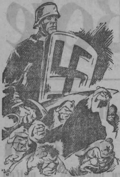
Rešitelj pred zmedo