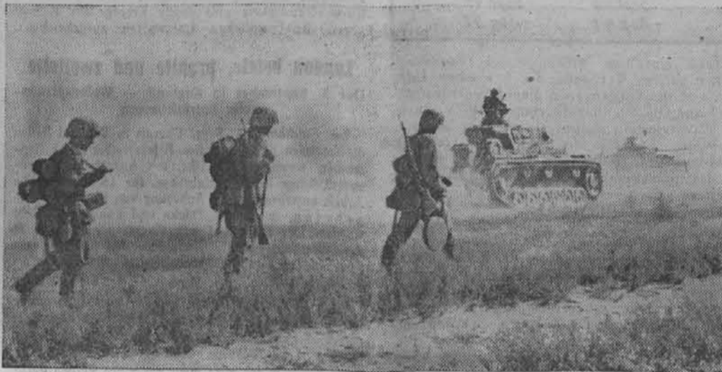
Oklopnaški grenadirji in oklopnaški gredo skupno v boj

Tako predstavlja Panzergrenadirski polk s svojo razporeditvijo, oborožitvijo in tak- tično uporabnostjo oklopnaško divizijo v malem in je dejansko postal ena najbolj mnogovrstnih vrst orožja nemške oborožene sile.