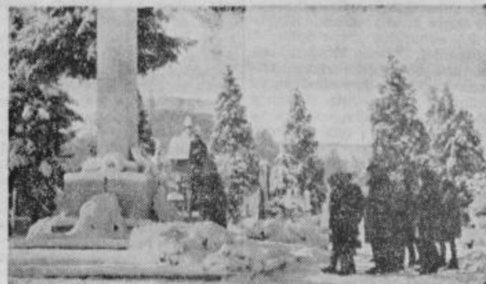
Skupina pionirjev je posadila čebulice tulipana iz Holandske