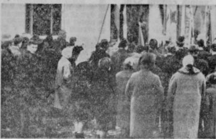
Ob odkritju spominske plošče v Dornavi

Na pročelju združnega doma v Dornavi je ob 29. novembra 1965 dalje nova spominska plošča z imeni padlih aktivistov OF in borcev iz Dornave in Mezgovca. Za ploščo je poskrbel občinski odbor Združenja borcev NOV Ptuj skupno s krajevno organizacijo združenja, za slovesno odkritje pa slednja ob pomoči in sodelovanju organizacije SZDL, šole, doma in gasilcev. Odkritja se je udeležilo poleg svojcev padlih okrog 150 mladincev in odraslih iz Dornave in Mezgovca ter predstavniki iz Ptuja.