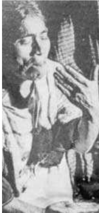
Maria Sabina, znana mehiška šamanka, govori v transu vzbudjenem s pomočjo rastlin

Zagotovo; ne mislim, da je posredi kultura. Ko pokadiš DMT, imaš izkušnjo, ki prihaja iz mesa in krvi tvoje človeškosti. Vendar ta izkušnja ostaja v celoti zasebna realnost, dokler ni prelita v posodo jezika. Če jo preliješ v lingvistično posodo Angleža, bo videti zelo različna od tiste, ki jo ubesedi Mazatec. Stvar je v neizbežni relativnosti jezika. Del posla, ki sem si ga zastavil, je ustvariti fenomenološki