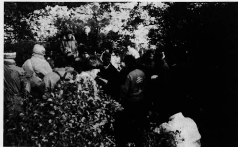
Posnetek z drugega Speleopohoda pri Slivnem, ki ga je priredilo društvo »Grmada«

Danes je v jamarski sekciji približno 15 članov. Njihova poglavitna dejavnost je odkrivanje novih jam in raziskovanje že znanih. Večinoma raziskujejo na »domaćih tleh«, to je v devinsko-nabrežinski občini. Društvo je med drugim že prijavilo deželnemu jamarškemu katastru lepo število doslej neznanih jam, ki so jih odkrili