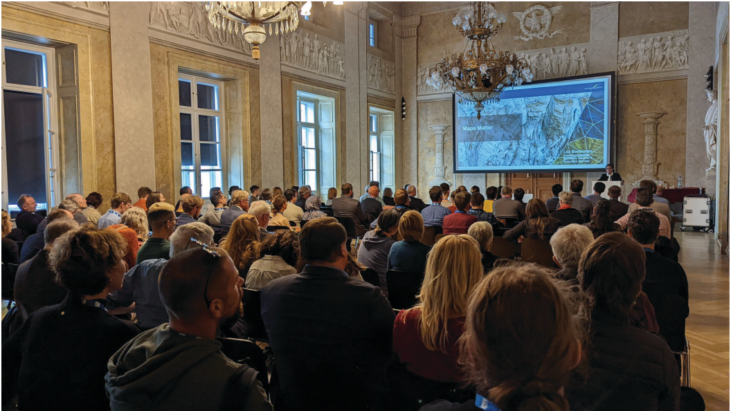
Slika 1: Prizor s predavanj.