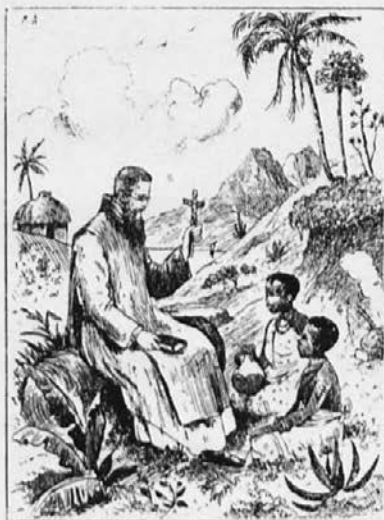
Misijonar uči zamorčeka

sv. veri, uče nato svoje rojake verskih resnic. Ker delajo v službi misijona, jih mora ta tudi vzdrževati. Kdor torej podpira katehiste, pomaga s tem pri delu za rešitev duš.