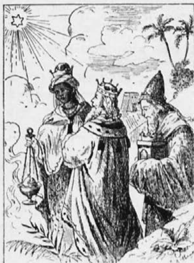
Sv. Trije kralji

Število misijonarjev v poganskih deželah je majhno, delo pa se, hvala Bogu, vedno množi. Malo jih sicer ima srečo, izpolniti nastale vrzeli in darovati svoje življenje za rešitev duš. Toda nekaj lahko storimo vsi: Iz daljave podpirajmo poganske misijone z molitvijo in miloščino. Misijonarji prosijo zlasti prav pogosto pomoči za svoje katehiste. Katehisti so zamorski pomožni učitelji, ki, od misijonarja dobro poučeni v