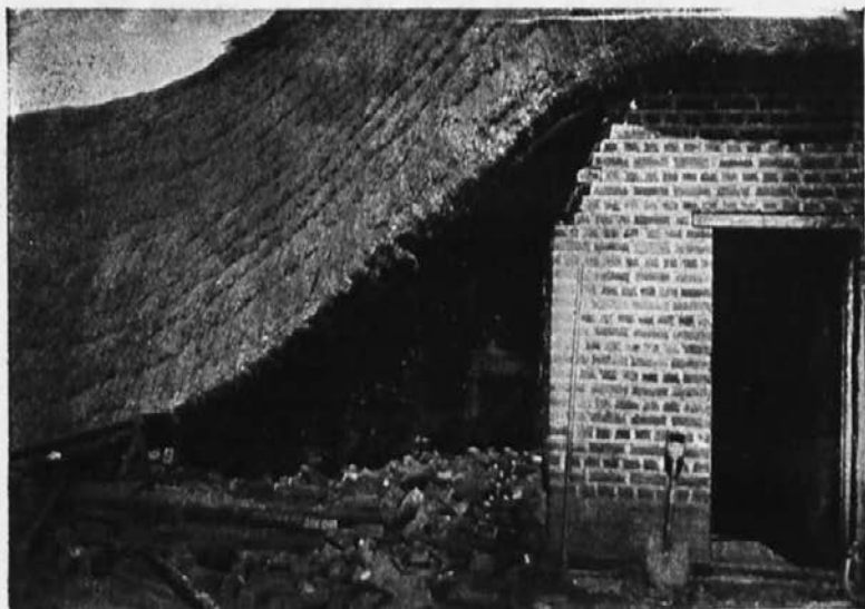
Od viharja podrta misijonska cerkvia.

hovniške hiše v Ilaki, ki nam jo je grozni vihar podrl. Čudežu se moram zahvaliti, da sem ostal pri življenju in pa usmiljenju svojih kristjanov. V 24 urah strašnega viharja se je stanovanje trikrat posipalo nad menoj in okrog mene. Včerajšnjo nedeljo sem mogel zopet maševati v borni koči, ki so jo kristjani napravili za silo. Vse bo treba nanovo pozidati. Bog naj nam da moči in poguma! Tudi na pomoč svojih dobrotnikov se zanašamo. Tu ni nihče prišel ob življenje, drugod pa je mnogo človeških žrtev, ki so jih vode odnesle in so ostali nepokopani. Ljudje so v veliki revščini in jim preti glad, ker