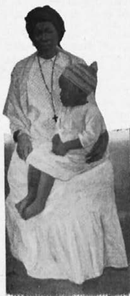
Krščanska zamorska mati.

Vse to sem Vam pisal, da vidite, za kako važno stvar se trudite, da Vaše delo in Vaš trud za Afriko ni zastoj, in bo Bog vse bogato poplačal. Tu in poprej v Vzhodni Afriki sem se prepričal, da afriški domačini res zaslužijo naših molitev in žrtev. Tu more naša sv. vera mnogo dobrega storiti na polju ljubezni do misijonov.