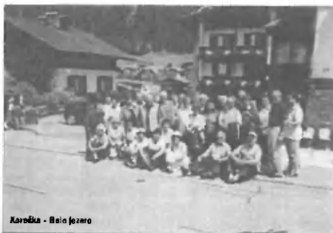
Koroška - Beilo jezero