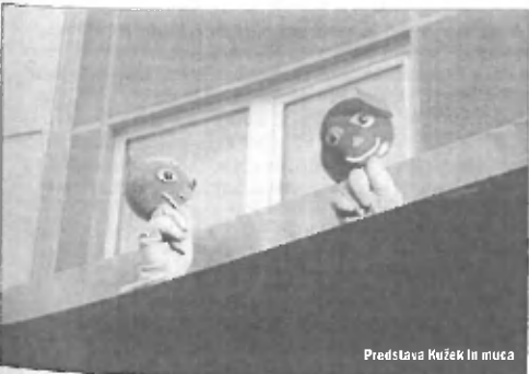
Predstava Kužek in muca

Kvalitetna, dobro narejena ulična predstava je pogoj za preboj