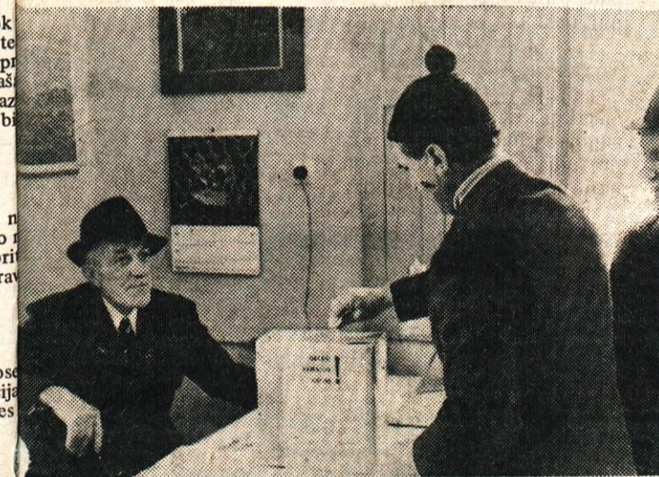
Nimam kaj skrivati, glasoval sem za vodovod in boljši električni tok, je bilo slišati na volišču Kalcit v Stahovici