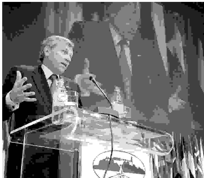
Jaap de Hoop Scheffer, generalni sekretar Nata, med govorom udeležencem parlamentarne skupščine

vosti, naj-novejša operacija Nata pa bo zagotovitev logistične podpore operaciji Afrike unije v Darfurju. Scheffer je poudaril še pomen poglobljanja partnerstva med Natom in številnimi državami ter mednarodnimi organizacijami. Predsednik vlade Janez Janša je dejal, da je transatlantska povezava med ZDA in Evropo temelj skupne varnosti. Zunanji minister Dimitrij Rupel pa je izrazil zaskrbljenost, da negativni izid referendumu o evropski ustavi vrača negativno nastrojenost v Evropo.