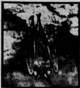
Življenje se vrača

Kako spe živali zimsko spanje? Ker je zimsko spanje čas dolgega in hudega posta, se žival na to dobro pripravi tako, da si nabere zalogo masti pod svojo kožo. Tako n. pr. delata netopir in polh. Druge pa nakopičijo zalogo hrane v svoja prezimovališča. Hrček si zgradi posebno, od letnega ležišča drugače zgrajeno prezimovališče, pred kateroga nanosí velike kumpje žita, potem zadela vse dohode in izhode. Podobno napravijo jazbec, jež in svizec. Netopirji se obesijo z nogami na kako oporo in vise t glavo navzdol. Krča pa uporabijo za nekaj plašč, v katerega se popolnoma zavijejo. Te živali prezimujejo včasih kar posamezno, včasih