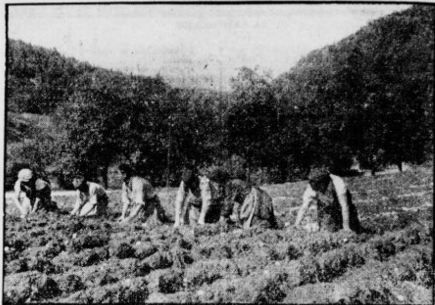
Izorani krompir deljejo na kupe

ki se niso in se tudi še danes ne navdušijo za vsako novotarijo. Razne evropske vlade so uvidele koristnost krompirja, zakaj koder so ga začeli gojiti, niso poznali več lakote.