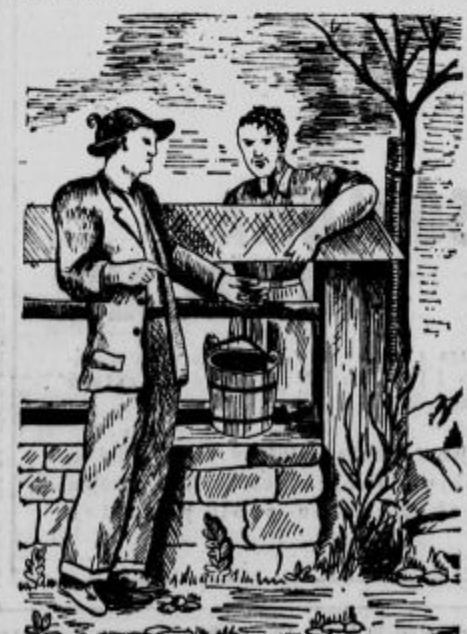
Fanta se pogovarjata, da konji ne marajo te vode

Spet nekaj dni potem, ko je bil vaški vodnjak očiščen, ko se fantom in dekletom žulji, ki so jih dobili pri vrtenju »motorog« pri vodnjaku, še niso dobro zaečili, je prišel še neki gospod, ki je na Bregu in v Našovah izpraševal o psu in o vodnjaku. Bil je sluga od kantonske gosposke iz Mekinj, kamor je tedaj ta stran Gorenjske spadala. Zavil je k Oborhu. Tam mu je oče postregel z nekaj polički kraškega terana, mati pa je prinesla veliko domačo klobaso ter še nekaj za po poti zavila. Mož pa je postal nato slep in gluhi!