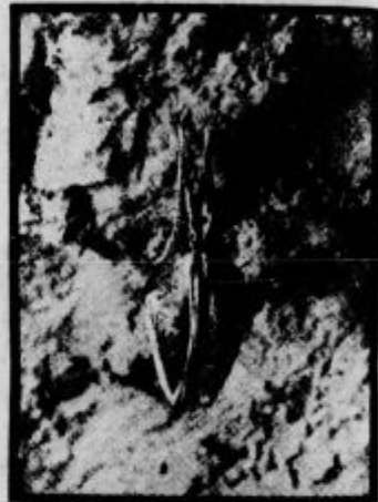
Netopir spi zimsko spanje

Nekatere živali v naših krajih zimske, ledenomrzle dni kar prespe. Kaj je temu vzrok? Nekateri sodijo, da pomanjkanje primerne hrane, drugi krivé mraz. Če gledamo prvo, pomanjkanje hrane, opazimo, da gredo spat res predvsem take živali, ki si v zimskem času ne najdejo primerne hrane bodisi, da je ta rastlinska, bodisi, da je živalska, pa je pozimi ni mogoče najti, hroščev, polžev, mušic itd. Nekatere živali, kakor polhi, netopirji in drugi, si za dobo zimskega spanja ne pripravijo prej nobene zaloge, ker ves čas samo spe, drugi, kakor hrček, vervečka itd., pa si preskrbe za tiste dni, ko so budni, lepo zalogo hrane.