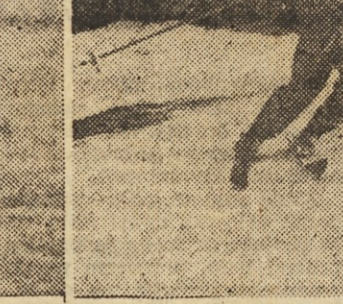
Bilo je kot pozno pomladi. Sonce je žgalo, ko se je truma smučarjev podala do Celjske koč...