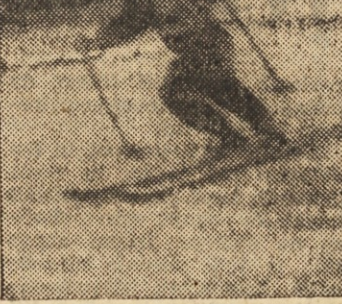
Bilo je kot pozno pomladi. Sonce je žgalo, ko se je truma smučarjev podala do Celjske koč...