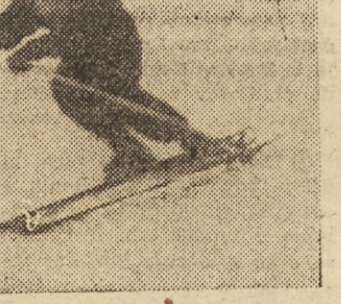
Bilo je kot pozno pomladi. Sonce je žgalo, ko se je truma smučarjev podala do Celjske koč...

Tako. Najin razgovor je bil pri kraju. France je še vzel poročilo v roke, dodajal, spreminjal, vnašal podatke. Nisem ga več motil.