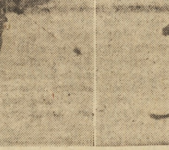
Bilo je kot pozno pomladi. Sonce je žgalo, ko se je truma smučarjev podala do Celjske koč...