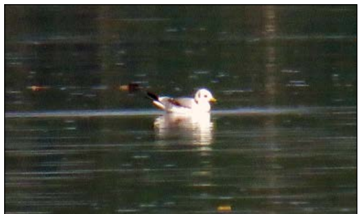
Slike 1 – 6 / Figures 1 – 6: (1) prilivka Burhinus oedicnemus, 26. 4. 2018, Škocjanski zatok ; (2–3) ploskokljunec Calidris falcinellus, 7. 7. 2018, Fontanigge, Sečoveljske soline ; (4) ozkokljuni liskonožec Phalaropus lobatus, 5. 5. 2018, Fontanigge, Sečoveljske soline ; (5–6) triprsti galeb Rissa tridactyla, 25. 4. 2018, Amerika, Ormoško jezero