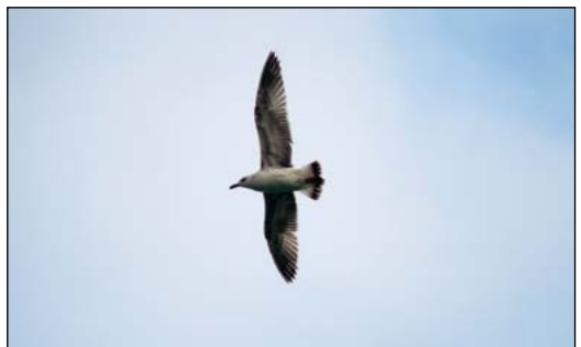
Slike 37 – 42 / Figures 37 – 42: (37) beloliska Melanitta fusca, 29. 11. 2018, Bled ; (38) beloliska Melanitta fusca, 7. 12. 2018, Brežice ; (39–40) plamenec Phoenicopterus roseus, 5. 2. 2018, Turnišče, Ptujsko jezero ; (41) kamenjar Arenaria interpres, 5. 5. 2018, zadrževalnik Medvedce ; (42) črnomorski galeb Larus cachinnans, 25. 3. 2018, Brežice