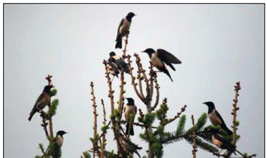
Slika 25 – 30 / Figures 25 – 30: (25–26) robidna trstnica Acrocephalus dumetorum, 24. 9. 2018, Sečoveljske soline ; (27) rožnati škorec Pastor roseus, 13. 5. 2018, Movraški kuk ; (28) rožnati škorec Pastor roseus, 22. 5. 2018, Brestanica ; (29) rožnati škorec Pastor roseus, 23. 5. 2018, Idrija ; (30) rožnati škorec Pastor roseus, 24. 5. 2018, Dolgi Most