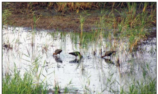
Slike 7 – 12 / Figures 7 – 12: (7) triprsti galeb Rissa tridactyla, 30. 10. 2018, morje pred Piranom ; (8) zalivski galeb Chroicocephalus genei, 27. 4. 2018, Fontanigge, Sečoveljske soline ; (9) velika govnačka Stercorarius skua, 23. 9. 2018, Ptujsko jezero ; (10) sredozemski viharnik Puffinus yelkouan, 9. 6. 2018, morje pred Piranom ; (11) plevica Plegadis falcinellus, 2. 1. 2018, Ankaran ; (12) plevica Plegadis falcinellus, 21. 8. 2018, Škocjanski zatok