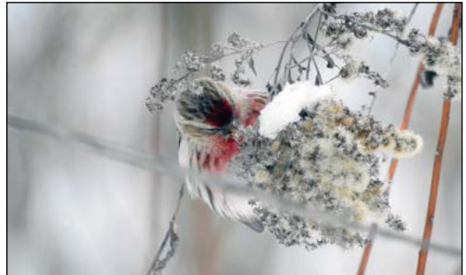
Slike 31 – 36 / Figures 31 – 36: (31) rožnati škorec Pastor roseus, 24. 5. 2018, Lesce ; (32) rožnati škorec Pastor roseus, 26. 5. 2018, Ptujsko jezero ; (33): rožnati škorec Pastor roseus, 27. 5. 2018, Velike Lašče ; (34) rožnati škorec Pastor roseus, 26. 6. 2018, Dolenje Jezero ; (35–36) severni brezovček Acanthis flammea, 4. 3. 2018, Brežice