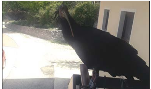
Slike 49 – 52 / Figures 49 – 52: (49) rjasta kozarka Tadorna ferruginea, 23. 4. 2018, zadrževalnik Medvedce ; (50) črni labod Cygnus atratus, 17. 1. 2018, Škocjanski zatok ; (51) mandarinka Aix galericulata, 1. 12. 2018, Škocjanski zatok ; (52) klavžar Geronticus eremita, 30. 4. 2018, Banjščice