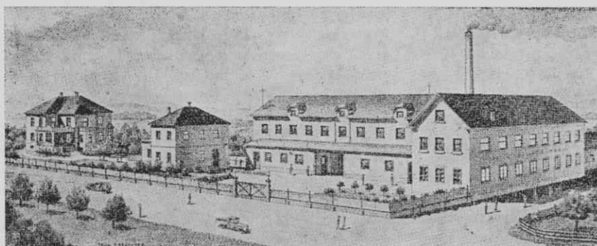
Tovarna vate in obvezilnega materiala Kocjančič & drug na Viru

nizira po zgledu delavstva na Količevem »brez strahu, ker jim bodo stali ob strani vsi organizirani tovariši in tovarišice«. Ob sklepu prvega sestanka so vsi navzoči podpisali pristopnice za JSZ. 3a