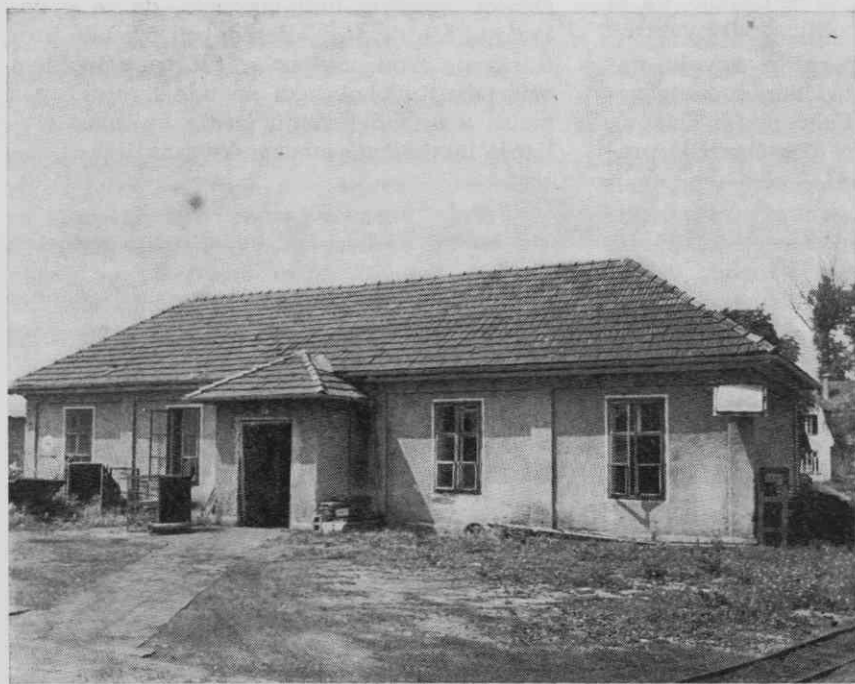
Prvi obrat na Količevem

Takšne razmere so vladale tudi na domaškem območju, 1 kjer so po propadu evropsko znane slamnikarske industrije v prvi svetovni vojni začela zaradi veliko cenene delovne sile, ugodnih energetskih virov in prometnih zvez nastajati nova industrijska podjetja, kot leta 1920 Bonačeva papirnica na Količevem in Bistra, kasnejša tovarna barv in škroba Medić-Zankl, v Domžalah,