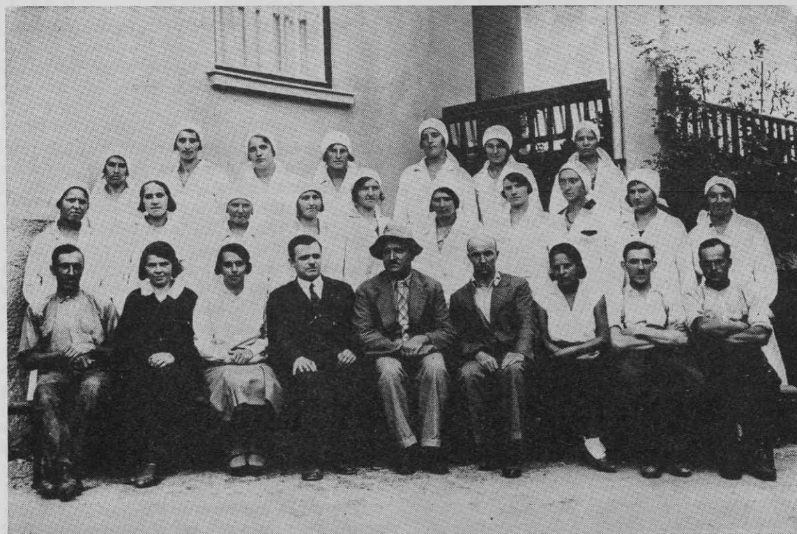
Podjetnik, družabniki in delavstvo 1935