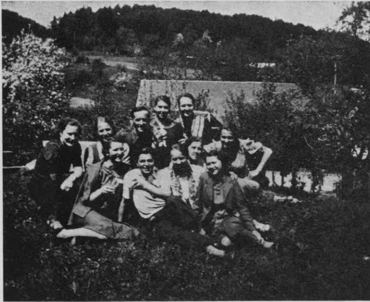
Sindikalni izlet na Dobeno 1939