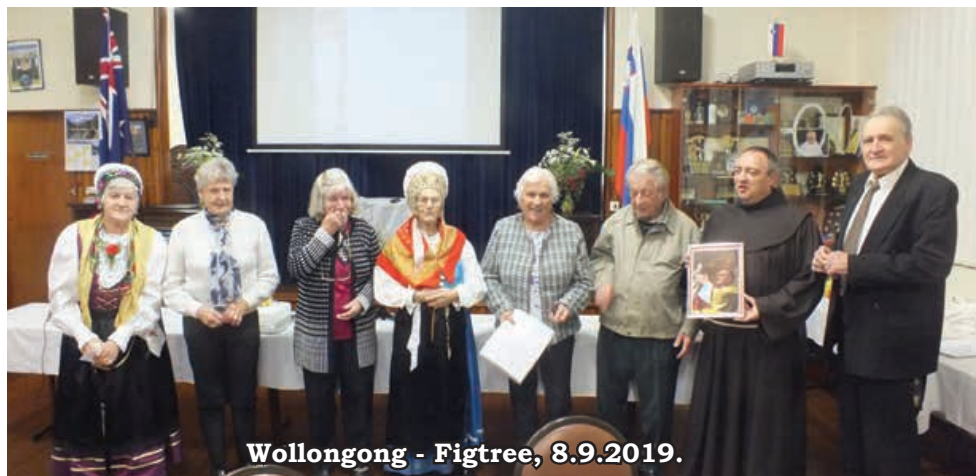
Wollongong - Figtree, 8.9.2019.