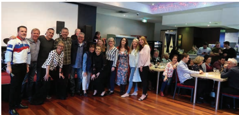
Del mlade generacije je pokazal, da znajo tudi slovensko peti in so nas presenetili s pesmijo »Mi se imamo radi, radi, radi ...«

otroci - tretja generacija in dvorana je bila tako polna, da smo morali nekatere odbiti, saj ni bilo več prostora.