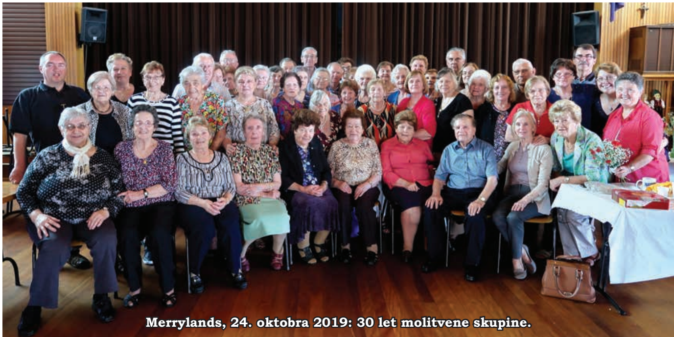
Merrylands, 24. oktobra 2019: 30 let molitvene skupine.