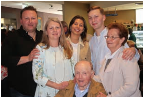
Tri generacije Gojakovih