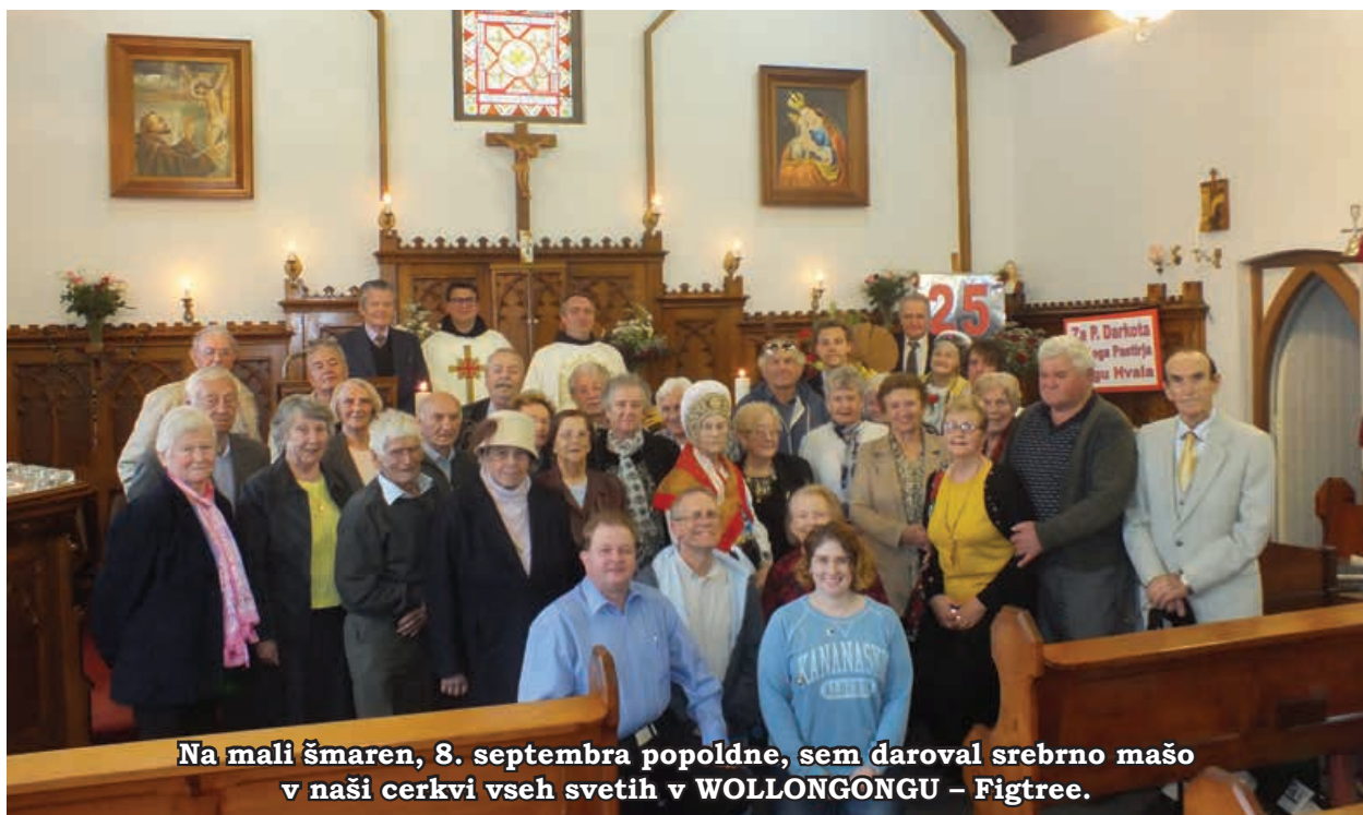
Na mali šmaren, 8. septembra popoldne, sem daroval srebrno mašo v naši cerkvi vseh svetih v WOLLONGONGU – Figtree.

Lepo je bilo romanje v MARIAN VALLEY, kjer smo se zbrali rojaki iz Kraljičine dežele, Viktorije, Južne Avstralije in iz NSW srebrnomašnik ob 10. obletnici kapelice Marije Pomagaj. Znamenje, ki ste ga domači rojaki pripeljali s Planinke in ga postavili ob vzhodu, nas bo spominjalo na pokojne rojake in tudi na znamenja ob poti na Božjo pot doma. Lepšega koščka doma nimamo daleč nikjer takole. Naslednje leto ali pa na naslednje romanje pojdite z nami še drugi, če vam je mogoče! Iz Sydneya smo šli dvakrat z avtobusom, veliko teh rojakov sedaj ne more več na dolgo pot, ste pa še drugi, ki vas bo očarala lepota tega milostnega kraja, zato nikar ne mečkajte. V Marian Valley je sv. maša med tednom vsak dan ob 9.00 dopoldne, ob sobotah ob 11.00 dopoldne, ob nedeljah ob 11.00 dopoldne in ob 4.00 popoldne, za