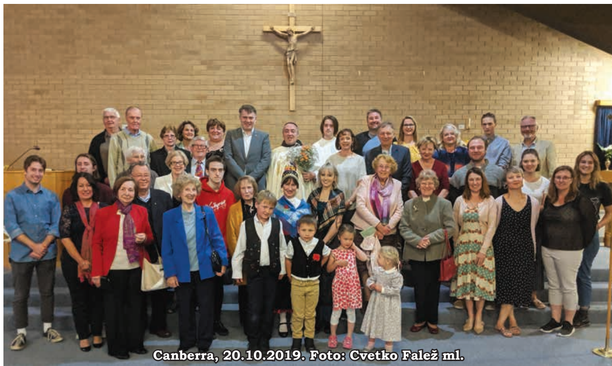
Canberra, 20.10.2019.