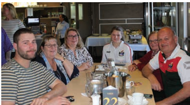
Tri generacije Pahorjevih

v naše klube ali društva, kakor smo navajeni že desetletja. V našem Klubu Triglav Mounties smo se že navadili, da moramo družinska praznovanja, kot je očetovski dan, rezervirati že več tednov prej, saj vedno zmanjka prostora. Tudi letos je bilo tako. Celo terasa zunaj ob otroškem igrišču je bila do zadnjega kotička polna. Za kosilo je bilo treba malo počakati, saj hrano v restavraciji Trigs pripravljajo sproti, da je vedno sveža in okusna, med čakanjem pa so si ljudje lahko postregli solate iz bogatega solatnega bara in se ohladili z brezplačnim kozarcem piva.