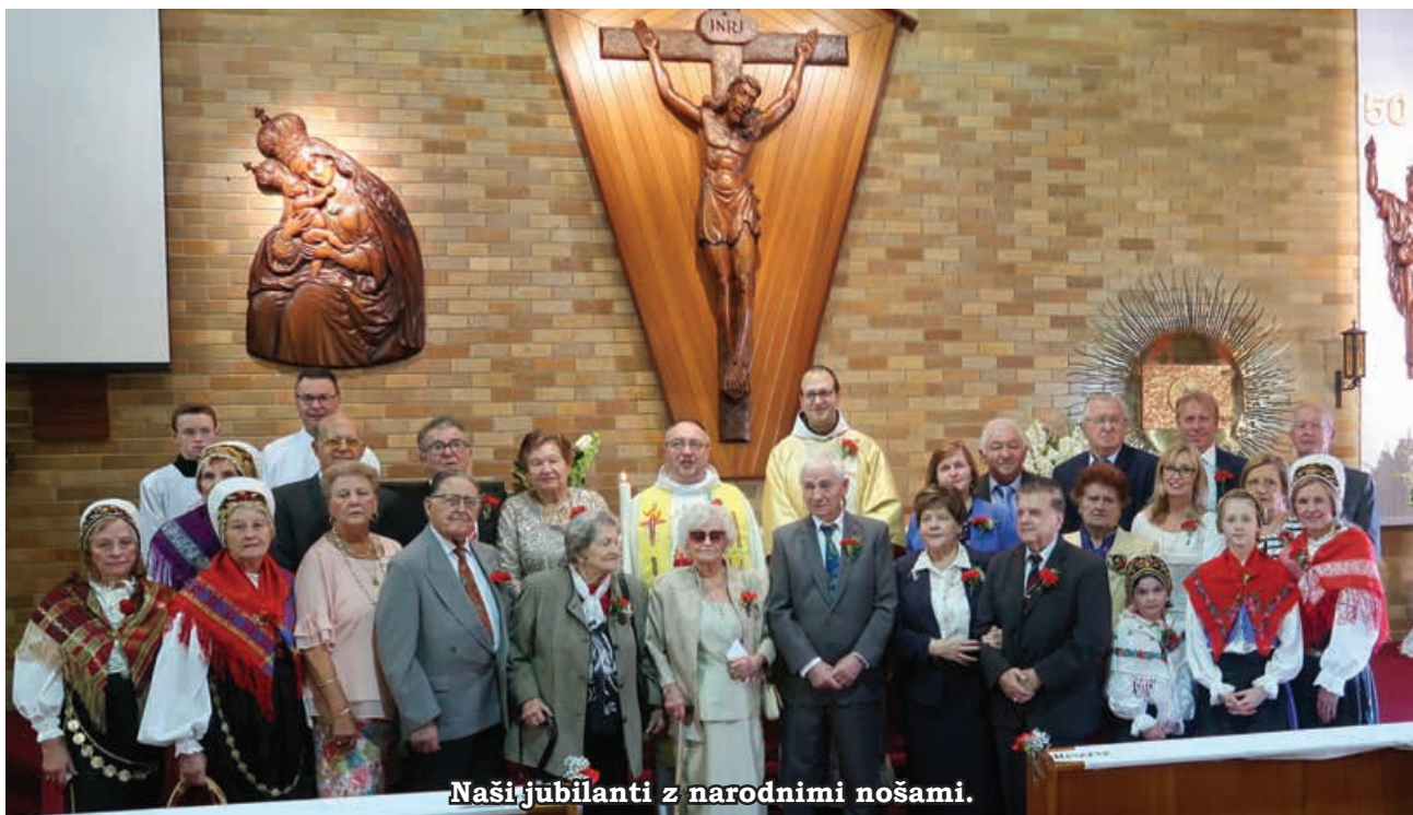
Naši jubilarji z narodnimi nošami.

The coming year will be a celebration of many 'firsts'. The first celebration of Holy Mass, the first wedding,