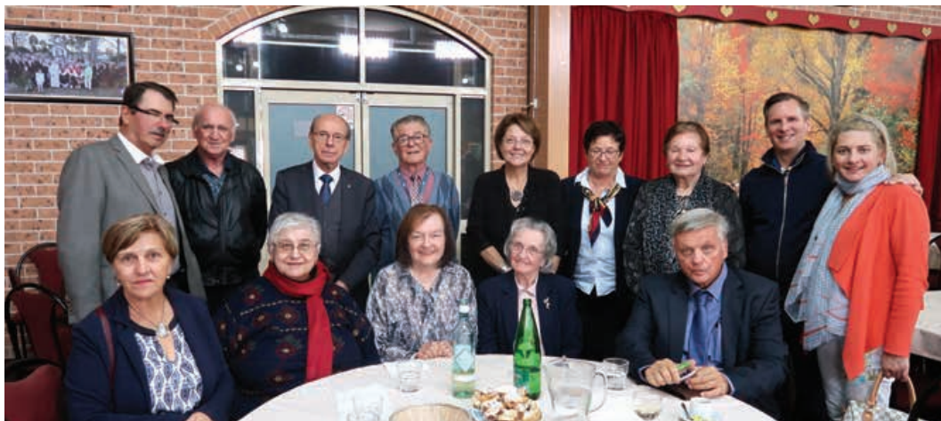
Obiskovalci iz Maribora z rojaki na Slovenskem društvu Sydney.

v kako novo restavracijo ali izletno točko, še vedno pa nas je kar veliko, ki gremo praznovat