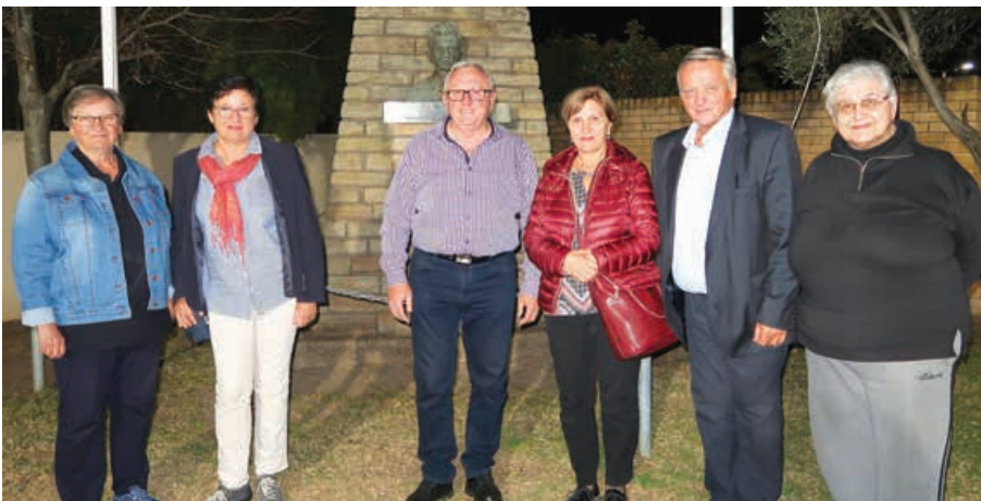
Obiskovalci iz Maribora pred spomenikom Ivana Cankarja v Klubu Triglav.

mesece predavala na University of Western Sydney v Campbelltownu in občasno tudi na TAFE (ljudska univerza).