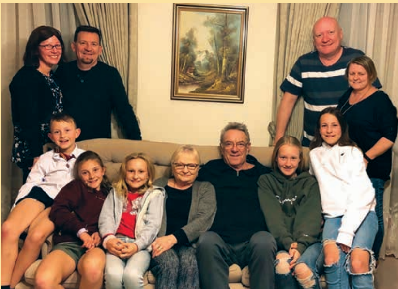
Čestitamo vsem slavlencem!