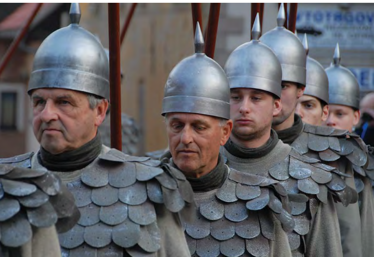
Filistejci iz prizora »Samson« iz uprizoritve Škofjeloškega pasijona 2015.