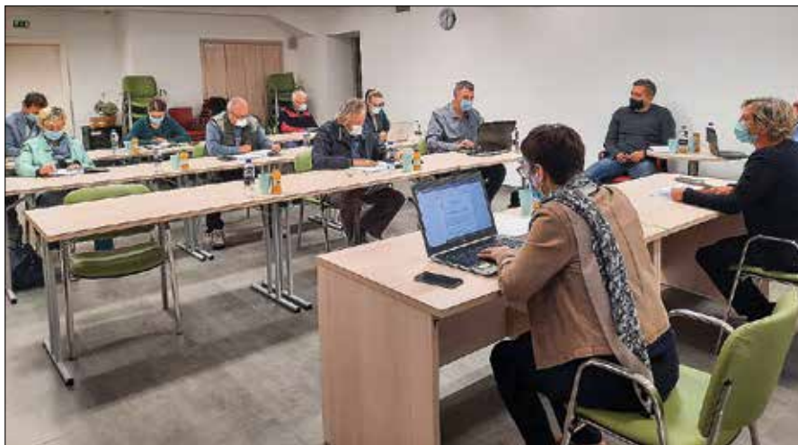
Občinski svet je predlagal Komunali Mozirje, da pripravi elaborat z izračunom cene storitve praznjenja malih komunalnih čistilnih naprav in greznic najkasneje do decembrske seje občinskega sveta.

Uredba o odvajanju in čiščenju komunalne odpadne vode iz malih komunalnih čistilnih