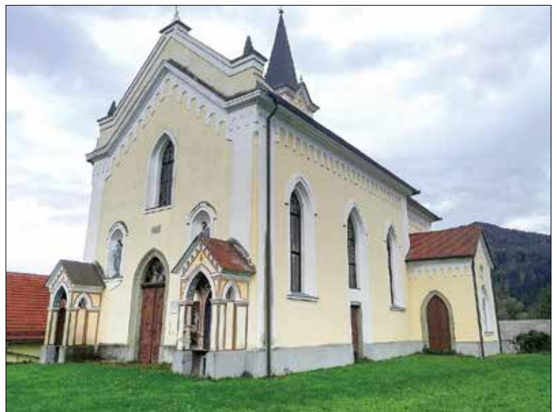
Današnja cerkev (iz leta 1861) svetega Nikolaja v Ljubiji s severozahoda

1668. Cerkev, ki je imela estrih, je ležala tako globoko, da je bilo treba vanjo vstopiti po nekaj stopnicah. Ko so to cerkev porušili, se je pokazalo, da je bila zgrajena v treh različnih obdobjih. Najstarejši in najboljši del zgradbe je bil v prezbiteriju, ki je bil delno zgrajen iz kvadratnih kamnitih blokov. Pozneje je bila iz slabega materiala zgrajena ladja, ki je segala do pevskega kora in so jo nazadnje podaljšali še za 5 čevljev [= približno 1,5 metra], da so lahko namestili lesen balkon za pevski kor. Ta cerkev je imela tri oltarje, namreč glavni oltar svetega Ožbalta, potem pa na desni oltar svetega Miklavža in na levi svete Ane. Med oltarjem svetega Miklavža in stranskimi vrati je bila leta 1725 zgrajena prižnica.