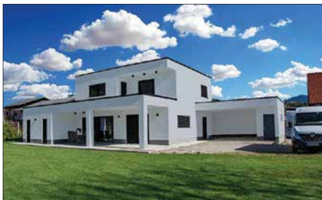
Montažne hiše Rihter so grajene po najboljših energijskih standardih, ki stanovalcem zagotavljajo minimalne stroške ogrevanja in maksimalno udobje bivanja.

Nova hiša ni le streha nad glavo, ampak izraža tudi življenjski slog.