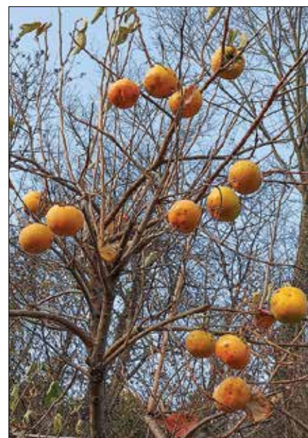
Kaki, slastni sadež, imenovan tudi zlato jabolko.

Kivi - rjavi plodovi vitaminov in svežega okusa