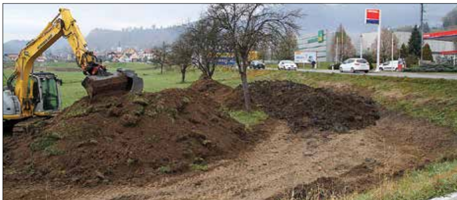
Meteorni jarek bo potekal ob regionalni cesti.