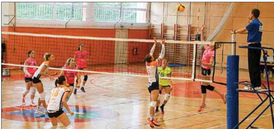
V tretjem setu so Mozirjanke pokazale, da obvladajo igro.

Tako treningov kot srečanj se štiri mlajše perspektivne igralko v dogovoru z vodstvom kluba zavoljo razmer okoli novega koronavirusa ne udeležujejo.