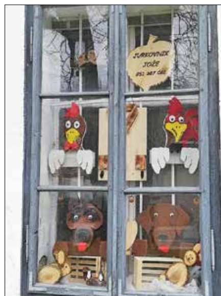
Sodelujoči v akciji so svoja dela postavili na okna Zavoda Stanislava ...