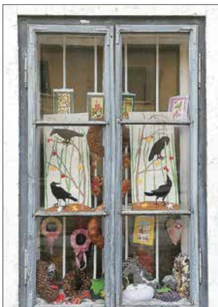
... in tako omogočili mimoidočim, da si ogledajo bogat izbor ročnih izdelkov.