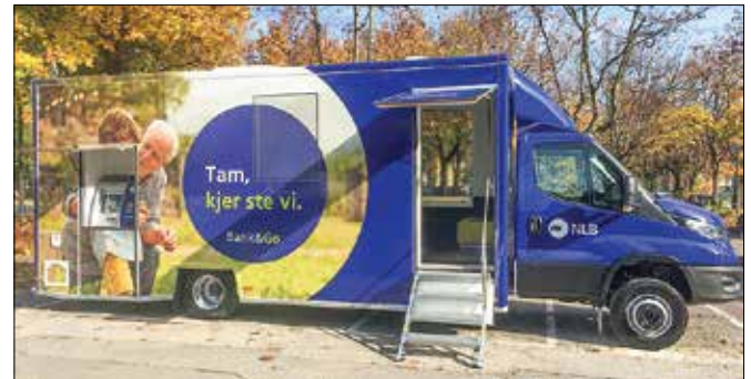
NLB mobilna poslovalnica Bank&Go bo ponujala bančne storitve, znanje, izkušnje in nasvete, predvsem pa osebni stik.