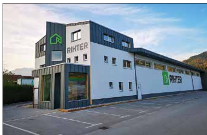
Prenovljena stavba podjetja Rihter na Ljubnem. (Fotodokumentacija podjetja Rihter)

Obiskovalci so se lahko »sprehajali« po prostoru in ga kar iz domačega naslonjača raziskali do zadnje podrobnosti. Rihterjevi strokovnjaki za montažno gradnjo so predstavili celovitost ponudbe, od začetne ideje do ključa, potek gradnje ter konstrukcijske sisteme in tehnologijo gradnje visokokakovostnih in energetske učinkovitih hiš. Sodelovali so tudi strokovnjaki za ogrevanje, prezračevanje in financiranje. Predstavljena hiša je odličan primer individualnim željam prilagojene tipske hiše, ki se s svojo moderno, racionalno in energetske učinkovito zasnovo izkazuje kot najbolje prodajani model.