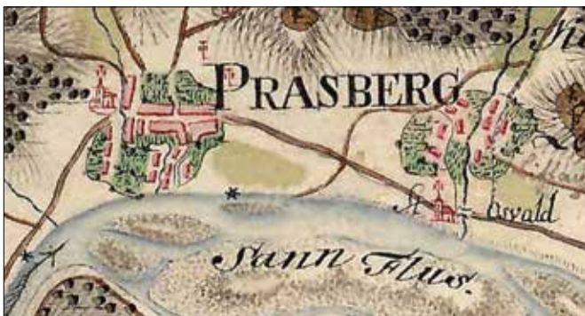
Prejšnja ljubijska cerkev, namreč svetega Ožbalta (St. Oswald), na vojaškem zemljevidu izpred leta 1787: Prasberg = Mozirje, Sann Flus = Savinja