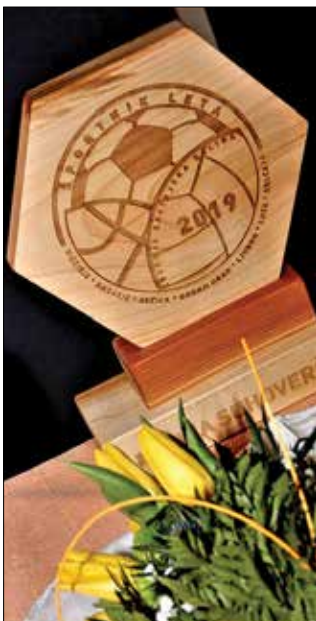
Pokalov za leto 2020 žal ne bo.