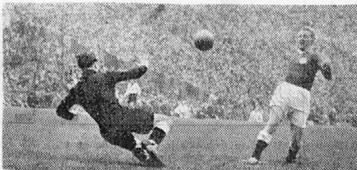
Strel v vrata — gol!