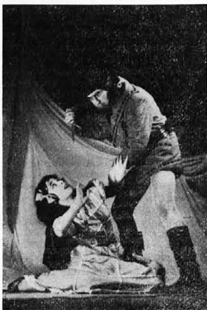
Prizor iz Sneguljčice

pregled nad življenjem koroških Slovencev, zlasti na kulturnem področju. Izdaja jo Družba sv. Mohorja v Celovcu, Viktringer Ring 26.