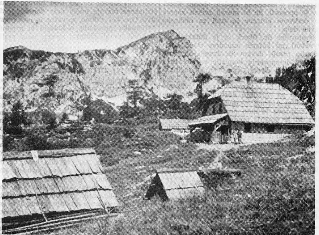
Redko katere planine so tako lepe in polne motivov kot naši Julijci. Kdo bi si mislil, da je na planini Krstenici, 1800 metrov visoko — sirarna? Kogar bo pot zanesla tod mimo, naj ne pozabi obiskati to sirarno. Lepo mu bodo postregli

Dobro pobudo pa je minister dal z umetnostno razstavo, ki jo je odprl prejšnjo nedeljo v Rimu. Razstavljenih je 4000 del, ki so jih izbrali iz 7000 risb dijakov vseh šol od osnovnih do vseučilišč. Nekaj tisoč risb so poslali tudi iz drugih držav. Razstava bo odprta nekaj tednov.