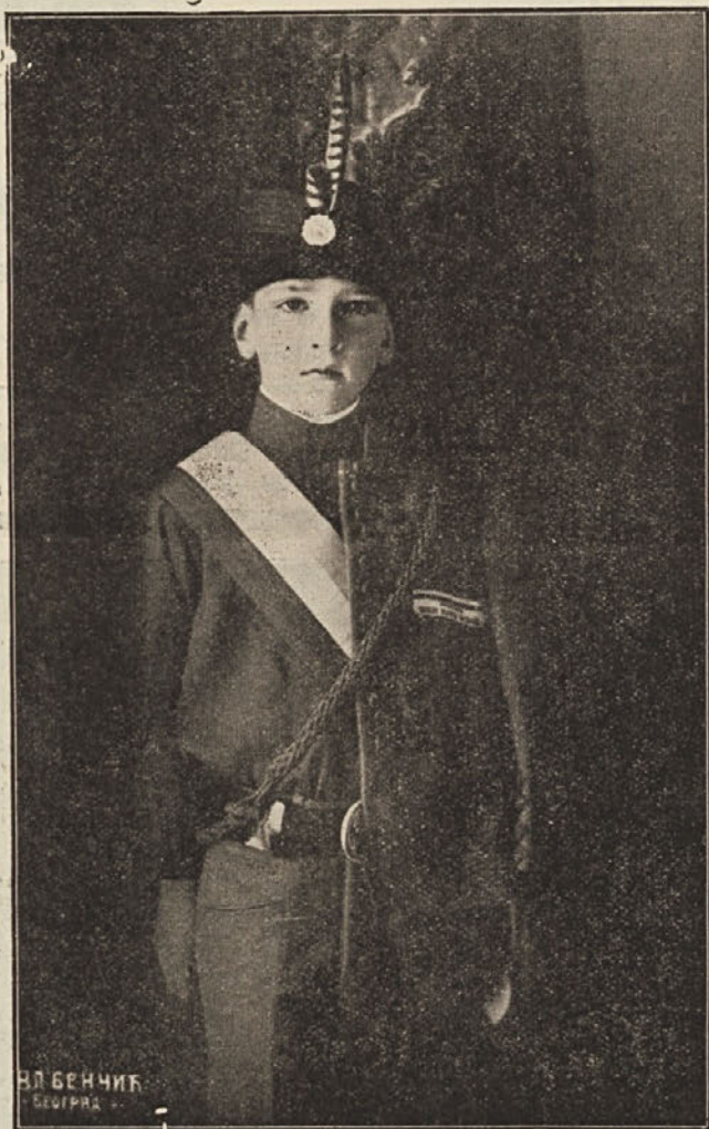
Њ. В. Краљ Петар II.

Још исте вечери 9-ог октобра, тек год. по звршеном атентату у Марсељу, телеграфски је обавештена Управа Двора Њ. В. Краља и Министарство Спољних Послова, као и мало доцније цела Краљевска Влада и све надлежне личности. На хитан позив Њ. В. Кнеза Павла, све ове личности сакупиле су се у Двору на Дедињу, па у духу нашег Устава прогласили за новог Краља, нашег љубљеног досадањег Престолонаследника Петра, прворођенога сина блаженопочившег Краља Александра.