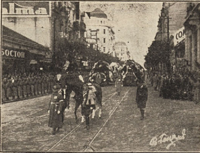
Краљевог коња на погребу воде два гардиста

Наш народ је имао прилике да се увери, колико је наш владар био цењен у Европи па и ван ње. На погребу је лично учествовао Председник француске Републике Г. Лебрен, Њ. В. Краљ Румуније Карол, свемоћни Председник Пруске владе Г. Геринг као изванредни изасланик Г. Хитлера, Енглески Принц Ђорђе, Бугарски Принц Кирил, као и изасланици ових европских држава.