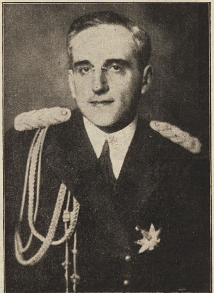
Последњи снимак Краља Александра I.

На дан 9. ов. месеца у 4.15 часова, пао је у Марсељу (Француска) као жртва злочиначког атентата наш љубљени краљ Александар I Ујединитељ, баш у моменту када је пошао у пријатељску Француску, да искрено учврсти наше трајно пријатељство братској нам Француској, и да тако удружени најбоље послуже делу светског мира. Пао је као жртва погођен метцима наших Државних непријатеља, и то баш у моменту, кад је био не само нама, већ и целом човечанству највише потребан. Убили су највећег миротворца земљине кугле само зато, да би после овога атентата, бацили у катастрофу рата цео већ иначе напаћени свет. Својом мудром и миротворном политиком, он је био скренуо пажњу на нас целога света, а наши спољни непријатељи били су љубоморни до лудила, што је избор Божијом вољом пао баш на наше Југословенско племе, да дарује цело човечанство овим нашим неумрлим генијем. Овим гнусним злочиним, наша су срца рањена тако, да ће она вечито крварити. Пао је за свето дело мира, али је иза њега остало 15,000.000 Југословенских синова — његових дивних јунака, који су чврсто решени да доживотно следују идеалима свог великог вође, на чувању светског мира, а нарочито наше Отаџбине љубљене Југославије.