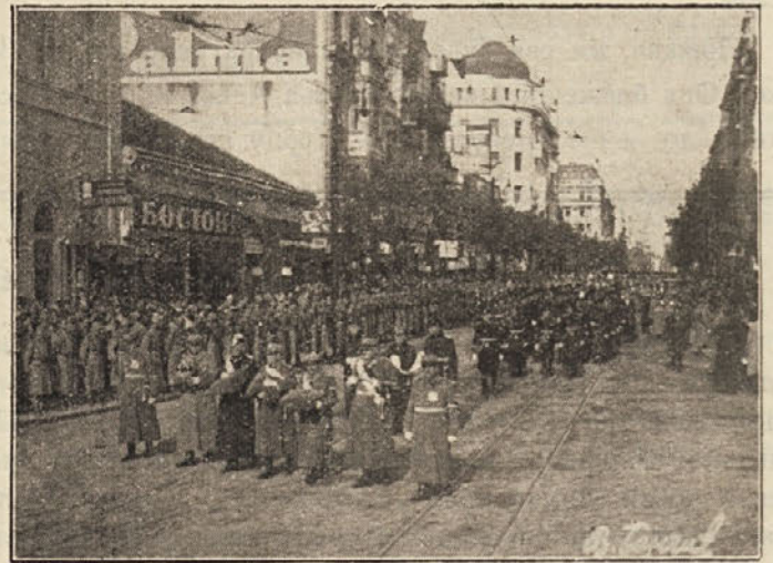
Официри носе краљевска достојанства на погребу: круну, стег, јабуку, сабљу ит.д.