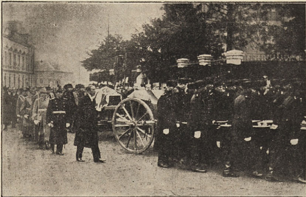
Ковчег на лафету вуку војници Краљеве Гарде