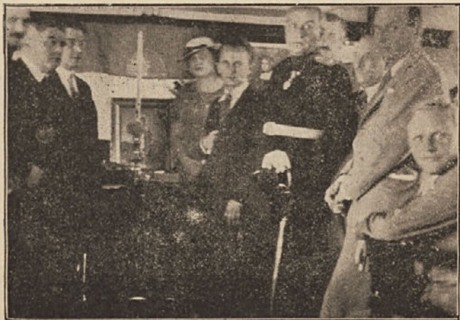
Ивасланик Њ. В. Краља са време резања колача

Није ни једно ни друго, већ Удружење ложача државних железница и бродова Краљевине Југославије прославља своју славу, свог патрона Огњену Марију