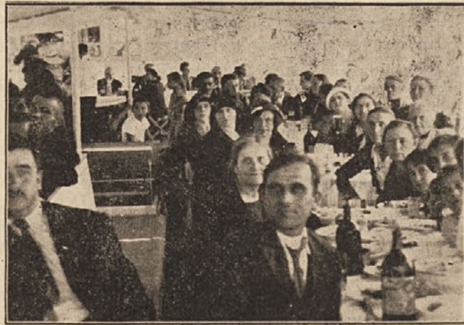
Један део гостију за време ручка.

Марија“ беше усидрен у самом пристаништу. Од наших најбољих декоратора готово уметнички, беше искићен многобројним тробојкама, државним па и интернационалним заставама. Штек, њихов прилаз па и ближа околнина била је у сјајном декору. Од ранога јутра са брода се чују умиљати звуци музике, сваки се у чуду пита