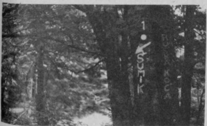
Pogled na smerokaz povzroča občutek prijetnosti in spodbujanja k nadaljevanju poti

avtomobilskih ali drugih nižinskih poteh, kvarili izgled gozdnega okolja in bi predstavljali njegove tujke. Tega so se dobro zavedali tudi planinci PD IMPOL, ki so si na pomoč poklicali kar naravo. Tako so vse markacije in navedbe krajev, do katerih je mogoče priti po tej ali oni planinski poti, označene kar na drevesih. Takšna obeleževanja imajo razen naravnega izgleda še eno prednost. So namreč mnogo trajnejša, saj jih razboriteži, ki „morajo“ pokazati svojo moč tudi v naravi, ne uspejo kar zlahka obrniti ali celo uničiti, kot je to velikokrat usoda mnogih siceršnjih smerokazov. Se ena prednost je, ki jo ne bi veljalo opustiti. To pa je, da se po smerokazih PD IMPOLA odvija le promet pešcev. Foto in tekst: VH