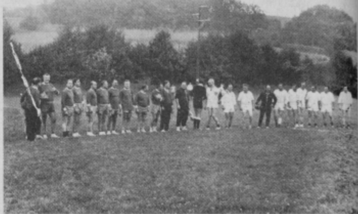
Pred nogometno tekmo v Ivanjkovcih

prešli v vodstvo z 2:0, potem so se Ormožani malo potrudili in skoraj izenačili pa se jim ni posrečilo. Pri rezultatu 3:2 so skoraj izenačili, vendar je nasprotnikov golman spretno branil svoja vrata tako, da v