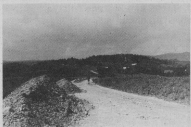
Kupi gramoza čakajo na planerje

Največji delež pri financiranju, kakor tudi pri opravljenih delih pa bo prav gotovo imelo Gozdno gospodarstvo Maribor, obrat Slov. Bistrica, ki je že pred tem prevzel ta cestni odsek v svoje upravljanje od občinske skupščine Slov. Bistrica. Ker pa GG, obrat Slov. Bistrica ni nameraval v celoti financirati tudi asfaltiranja ceste skozi naselje, se sedaj dogovarjajo o tem samih krajanje, za katere je to velika priložnost, da si olepšajo svoje središče, hi iz leta v leto postaja privlačnejša turistična točka. Kljub temu, da bo tudi pri delih za ureditev asfaltiranja ceste skozi