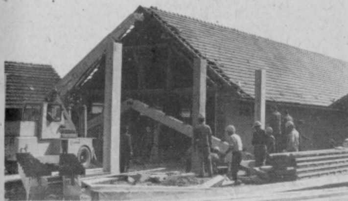
Novi obrat bo pripravljen za proizvodnjo do oktobra

od 40 do 50 % večjo produktivnost. To je nekaj zanimivosti iz proizvodnega programa opekarnice v Žabjeku. V kratkem bomo torej že na domačem tržišču lahko nabavljali sodobne stropovne elemente, kate-