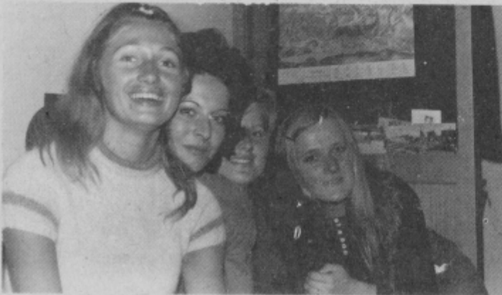
Aparat je zabeležil trenutek njihovega veselja