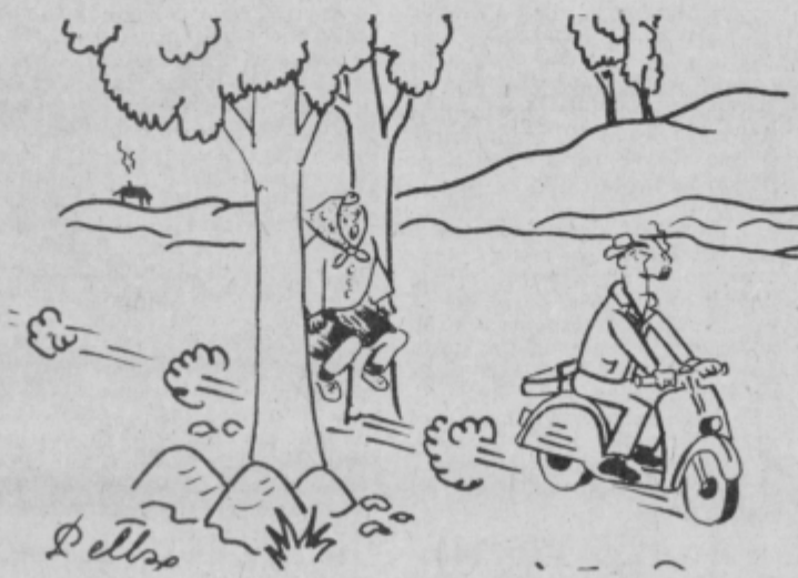
„Počakaj, prehod ni bil dovolj širok.“

Po vsem tem sodijo raziskovalci, da so sanje človeku prav tako potrebne kakor spanje. Sanjajo vsi ljudje, razlika je zgolj v tem, da se nekateri tega ne spominjajo. Sanj v barvah je po nekaterih ugotovitvah okoli osemdeset odstotkov. Raziskovanje sanj kot znanost je tako rekoč še v povojih, torej utegnejo znanstveniki na tem področju odkriti še marsikaj koristnega za zdravje.