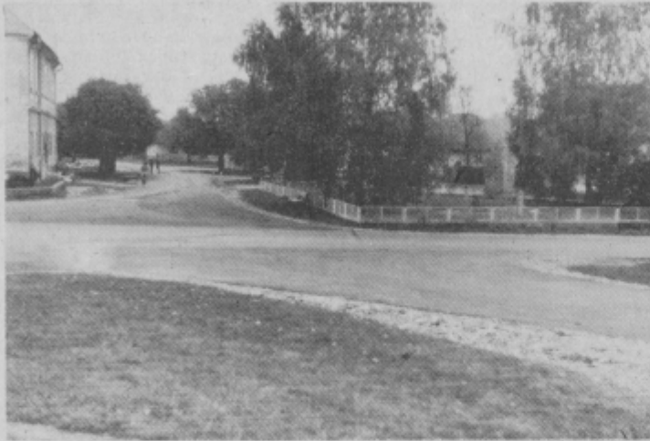
Zopni prah je izginil s trga. Zamenjala ga je lepa asfaltna plast, ki povezuje trg s cestami na vse strani

ge ter od prebivalcev na trgu in Steničjaku zbrali 4.900.000 starih dinarjev prostovoljnih prispevkov. Ker je trg pomemben za vse prebivalce kraja so menili, da naj za njegovo olepšanje prispevajo vsi krajanj.