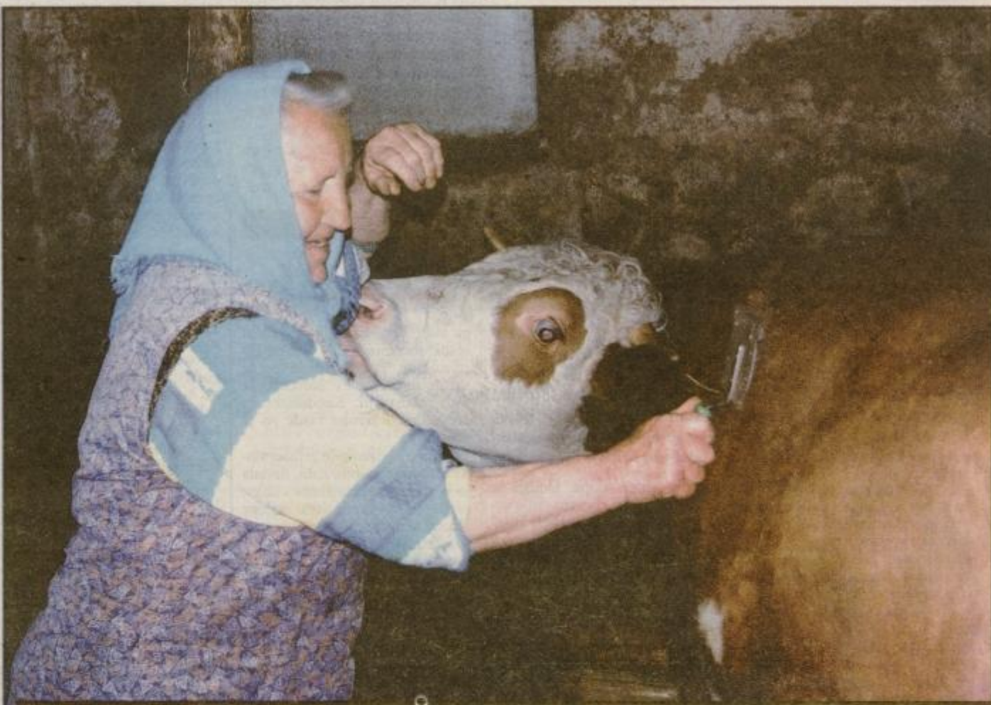
Ženska ni samo mati, tudi delo ji ni prihranjeno...