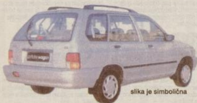
slika je simbolična

PAAM AUTO d.o.o. Zavrč 7a, 2283 Zavrč, tel.: 062 761 116