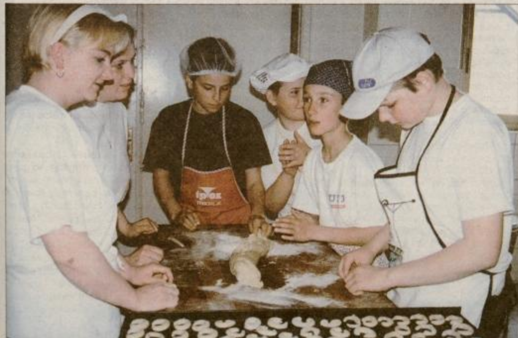
Mladi slaščičarji so preizkusili svoje spretnosti v podjetju SladkoS.