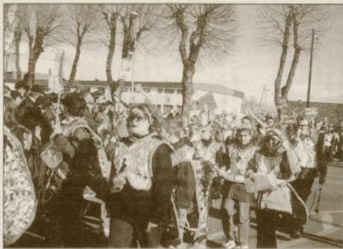
Milenijski hrošči z osnovne šole Mladika

Skupino je predstavljalo kar 100 milenijskih hroščev, ki so uničevali vse nepravilnosti v računalniških omrežjih. Uničevali so vse podatke, ki nas odtujujejo med seboj, podatke, zaradi katerih smo le številke in ne osebnosti, vse dejavnike, ki so nam vzeli čustva, prijaznost, pripadnost. Uničili so vse slabe ocene v redovalnicah, vse neopravičene izostanke in vse, česar ne maramo. Borili so se s čistilci, ki so jih hoteli uničiti. Do konca karnevala pa je teh 10 čistilcev opravilo svoje delo in življenje sedaj poteka po ustaljenih tirih.