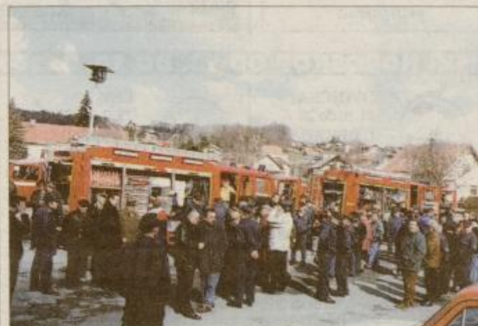
Najsodobnejši pridobitvi ptujskih gasilcev so si ogledali mnogi občani in ljubitelji gasilstva.

ka vaja s prikazom reševanja iz objekta in poškodovanih v prometni nesreči ter intervencije v nesreči z nevarno snovjo. 8. septembra dopoldne se bodo skupaj z gosti sestali na slavnostni seji, vse skupaj pa bodo začeli z osrednjo slovenostjo, ki bo 9. septembra ob 10.