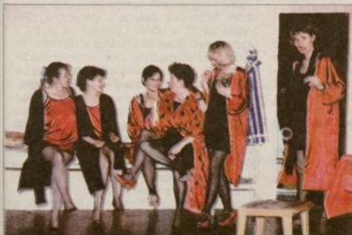
Gledališka skupina DPD Svoboda iz Slovenske Bistrice se je odločila, da bo v letošnji sezoni postavila na oder delo Kurbe Fedže Šehoviča. Na eni zadnjih vaj jih je posnel bistriški fotograf Mladen Cerić.