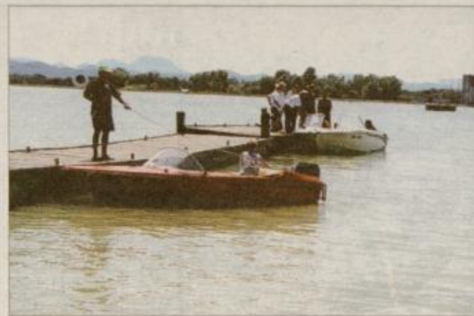
Drava in Ptujsko jezero nudita velike turistične možnosti.

Vsekakor je ta posvet dal pozitivne sklepe in izhodišča, da bomo tako na nivoju občin kot na nivoju prometnega, turističnega in okoljskega ministrstva lahko začeli skupno akcijo. Tako bomo lažje ustvarili projekte, združili domača, zasebna in družbena sredstva ter dosegli financiranje iz različnih evropskih skladov, v