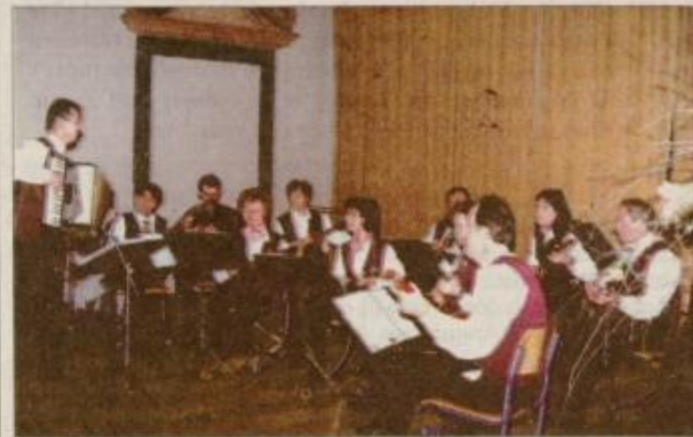
... in tamburaši iz Vidma.