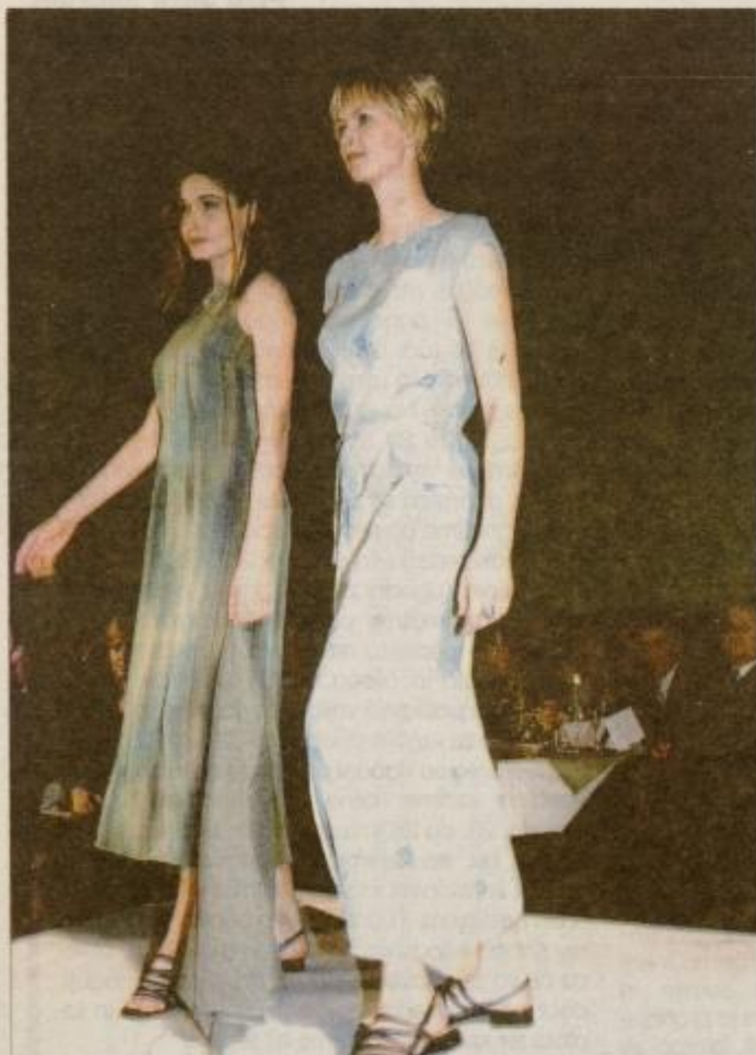
Labod je za letošnje poletje pripravil izredno dobro kolekcijo.

so tudi sedem poučnih izletov. Danes je članov več, s tem pa tudi zanimanja za različne aktivnosti in v Ljudski univerzi jim z veseljem prisluhnejo.