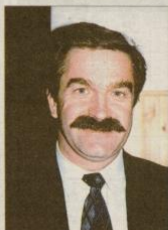
Minister za promet in zveze Anton Bergauer

potrebovali od 50 do 60 milijonov dolarjev - približno toliko, kot stane 10 km avtoceste. Ali bi se naložba izplačala, je seveda vprašanje posebne ocene, obe ministrstvi pa sta prevzeli obvezo, da