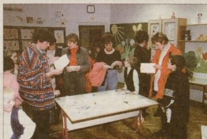
Mamice so si ogledale razstavo izdelkov svojih otrok.