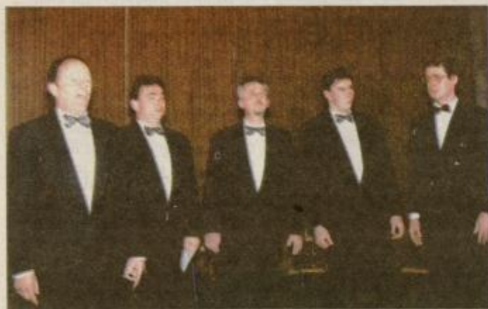
V soboto so dobrodelni koncert oblikovali pevci kvinteta Završki fantje ...