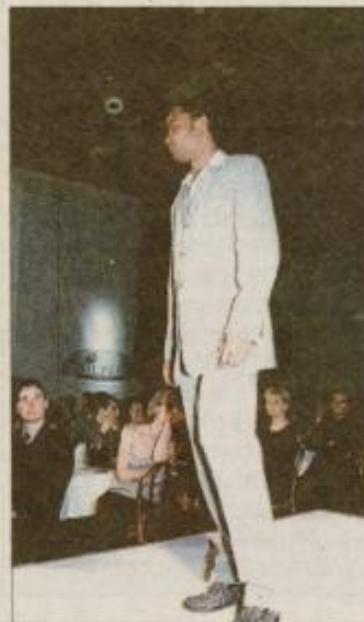
Za uspešen moški korak v pomlad in poletje so tudi letos poskrbeli v Sensu

tudi, da je zmanjkalo vstopnic za ples in revijo. Kot kaže, bodo morali v Ptuj poskrbeti "za neki hotel", da bodo omogočili vsem, ki to želijo, da bodo lahko v bodoče prišli na Mercatorjev ples. (Upamo, da je predsednik koncerna Zoran Jankovič mislil resno, saj ob zdajšnji vladajoči garnituri v Ptuj ni pričakovati, da bomo že kmalu pridobili pravi hotel!)