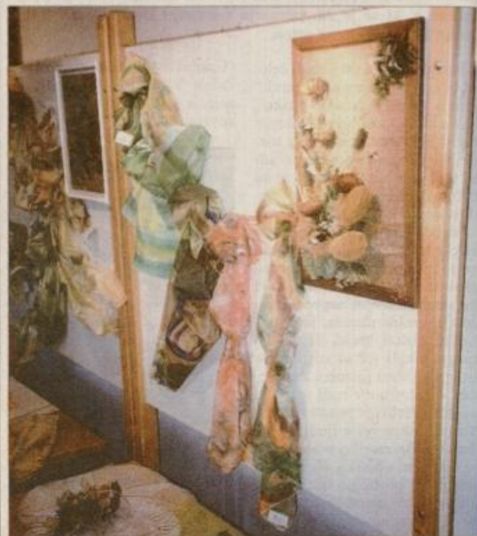
Utrinek iz razstave Poslikava na svilo.